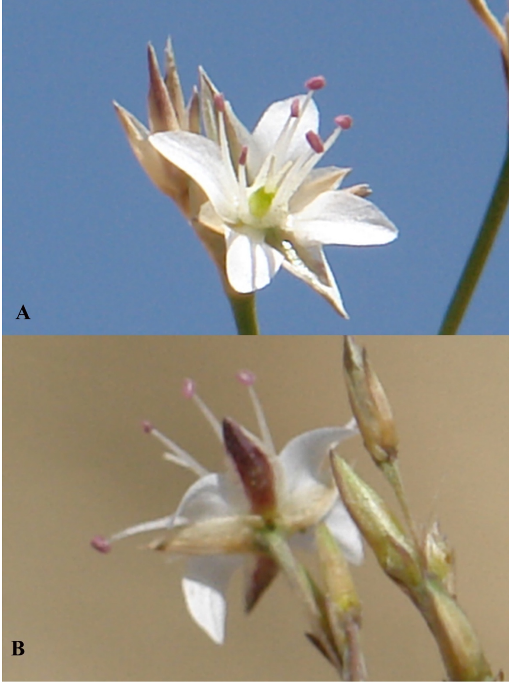
řekil 5. Bufonia kotschyana subsp. kotschyana ; A. ieęin detaylı nden grnř, B. ieęin arkadan detaylı grnř ( M. Fırat 30814 ).

Yeni lokaliteler: Bufonia kotschyana Boiss. subsp. kotschyana : Trkiye: B10 Van: Bařkale ilesi, Mor Daęı, 2370 m, 21 Aęustos 2014, M. Fırat 30814 (iekte); aynı yer. 17 Eyll 2014, M. Fırat 30991 (meyvede); Bařkale ilesi, Mor Daęı, 2770 m, 11 Aęustos 2015, M. Fırat 31516 (iekte).