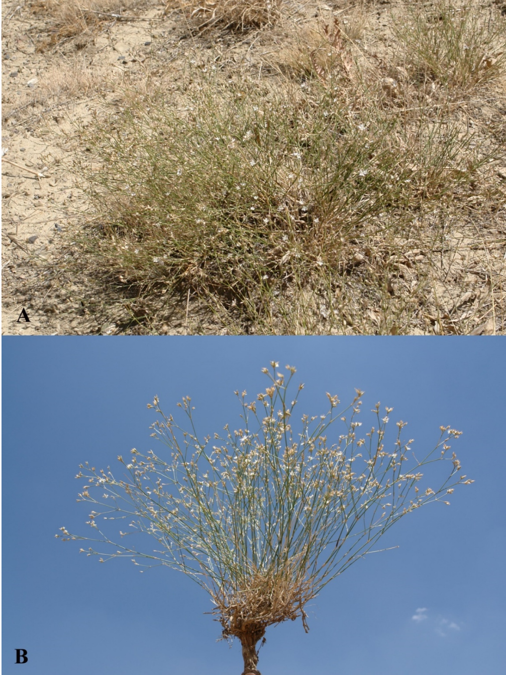
Şekil 3. Bufonia kotschyana subsp. kotschyana ; A-B: genel görünümü (M. Fırat 30814).

özellikle yaprakların dip kısmında. Çiçeklenme \pm gevşek. Talkım 1–5 çiçekli salkım halinde. Çiçek sapları 3–10 mm uzunluğunda, seyrek ile yoğun kısa havlı. Çanak yapraklar eşit değil, mızraksı, sipsivri, geniş zarımsı kısa kirpikli kenarlı, genellikle uçta kıvrık; dış çanak yapraklar 3,5–4,5 (-6,0) mm uzunluğunda, belirsiz damarlı; iç çanak yapraklar (3-) 5 damarlı. Taç yapraklar daha kısa ya da çanak yapraklar kadar uzun. Erkek organlar 8 adet. Sıtilluslar \pm ovaryum kadar veya daha uzun. Kapsül 3,0–3,5 mm uzunluğunda, çanak yapraklardan daha kısa. Tohumlar 2,2–2,5 mm uzunluğunda ve arka kısımda kısa küt kabarcıklı.