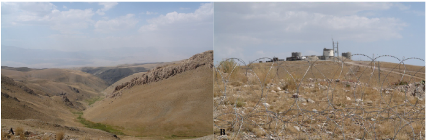
Şekil 2. A-B: Bufo kotschyana subsp. kotschyana 'nın Başkale-Van'daki habitatu (Mor dağ ve Türkiye sınırına yakın İran askeri karakolu).

Betim: Küçük yarı çalılar. Gövde çok sayıda, 20–30 (-45) cm yüksekliğinde, dik veya yükselici, genellikle kısa seyrek dallı, yoğun kısa havlı veya tüysüz. Yapraklar şeritsi-bizsi, 8–10(-15) mm uzunluğunda, ±sert batıcı, kenarları kirpikli,