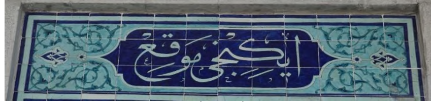
Foto 30. Haydarpaşa İskelesi İkinci Mevki Kitabesi