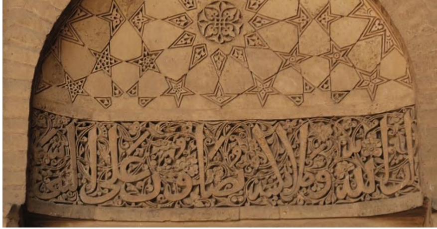
Foto 3. İsfahan Cuma Camii Çiçekli Celî Sülüs Kitabe Detayı

Erken Türk İslam mimarisinde görülen kitabelerdeki süsleme anlayışı Anadolu'daki Türk İslam mimarisinde devam etmiştir. İlk inşası Büyük Selçuklular Devri'ne ait olan Diyarbakır Ulucamii ve Bitlis Ulucamii gibi yapılarda çiçekli kûfi kitabe geleneği sürdürülmüştür (Aslanapa, 2007).