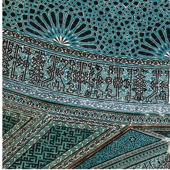
Foto 4. Konya Karatay Medresesi Ayet Kitabesi