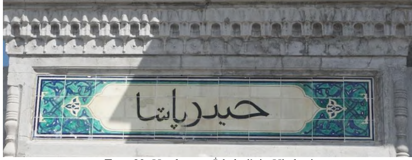
Foto 28. Haydarpaşa İskelesi'nin Kitabesi

İskelenin denize bakan cephesinin merkezindeki sivri kemerli açıklığın üzerinde bulunan çiniden yapılmış Osmanlıca "Haydarpaşa" ifadeleri yazılı kitabenin bezemeleri Ulusal Mimarlık Üslubu özellikleri göstermektedir. Ancak yazı orijinal değildir. Kartuşun her iki yanı kıvrımlı bir düzenleme ucundaki palmet motifleriyle sona ermiştir. Palmet motifinin içi kıvrık dal ve rumi motifleriyle zenginleştirilmiştir. Kartuşun iki yanındaki diğer bölümlerde turkuaz zemin üzerine lacivert renginde yapılmış benzer motiflerin oluşturduğu bezemeler izlenmektedir. (Foto 28.)