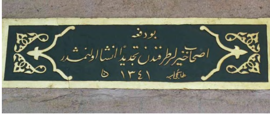
Foto 31. Ahmed Şemseddin Efendi Çeşmesi'nin Kitabesi

Onarım kitabesinin bezemeleri Ulusal Mimarlık Üslubu'nu yansıtmaktadır. Kartuşun her iki yanı kıvrımlı bir düzenleme ucundaki palmet motifiyle sona ermiştir. Zeminin geri kalan kısımlarında simetrik olarak yerleştirilmiş rumi, kıvrık dal ve palmet motiflerinden oluşan klasik havada tasarımlar görülmektedir. (Foto 31.)