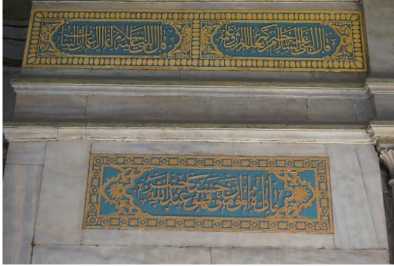
Foto 8. Seyyid Hasan Paşa Medresesi'nde Hadis Kitabeleri