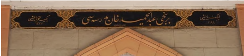
Foto 25. Sultan Hamid-i Evvel Medresesi'nin Kitabesi

Kartuşları ayıran bölümlerde ve köşebentlerde bezemeler görülmektedir. Simetrik olarak yerleştirilmiş rumi, kıvrık dal ve palmet motiflerinden meydana gelen bezemeler de mimari yapıyla uyumlu olarak Ulusal Mimarlık Üslubu'nu yansıtmaktadır. (Foto 25.)