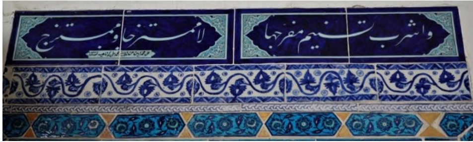
Foto 23. Hırka-i Saadet Dairesi'nde Kaside Kitabesinde Usta İmzası

Simetrik bir biçimde tertip edilen panolarda kaside beyitleri celî ta'lik hat ile yazılmıştır. Kaside çini panoda kartuş sayılabilecek bir alanda sınırlandırılmıştır. Kartuşun sağ ve sol bölümleri kıvrımlı çizgilerle daralarak sona ermektedir Köşebentler rumi, kıvrık dal gibi klasik motiflerden meydana gelen bir kompozisyonla zenginleştirilmiştir. (Foto 23.)