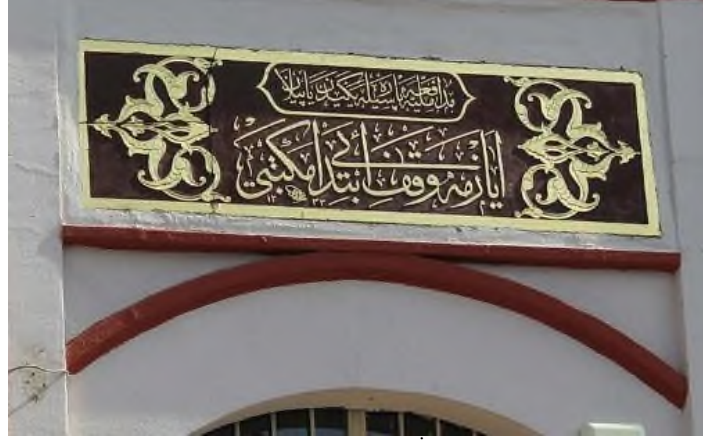
Foto 24. III. Mustafa Mekteb-i İbtidaisi'nin Kitabesi

Kitabenin her iki yanında iri bir şekilde kullanılan rumi, kıvrık dal ve palmet motifleri, Ulusal Mimarlık Üslubu süsleme anlayışının, adı geçen yapı üzerindeki yansımalarıdır. (Foto 24.)