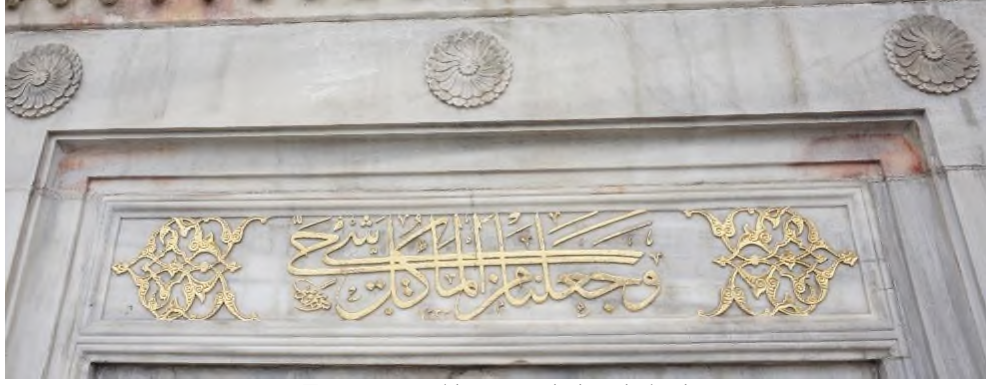
Foto 22. Kısıklı Çeşmesi'nin Kitabesi