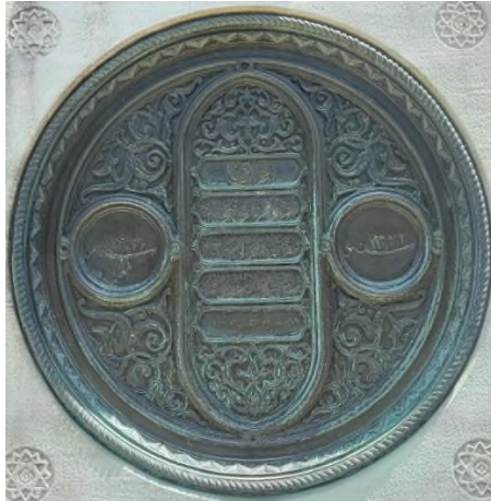
Foto 27. Tayyare Şehitleri Anıtı'nın Kitabesi

Bronz kitabedeki bezemeler Ulusal Mimarlık Üslubu'nu yansıtmaktadır. Ortadaki dikey kartuşun alt ve üst bölümünde simetrik olarak rumi, palmet ve kırık dal motiflerinden meydana gelen klasik bir tasarım göze çarparken, kartuşun dışında kalan zeminlerde de benzer motiflerin tekrarlandığı görülmektedir. (Foto 27.)