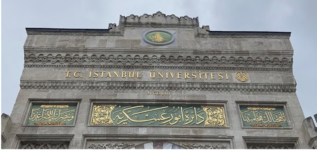
Foto 10. Bab-ı Seraskeri'nin Kitabesi