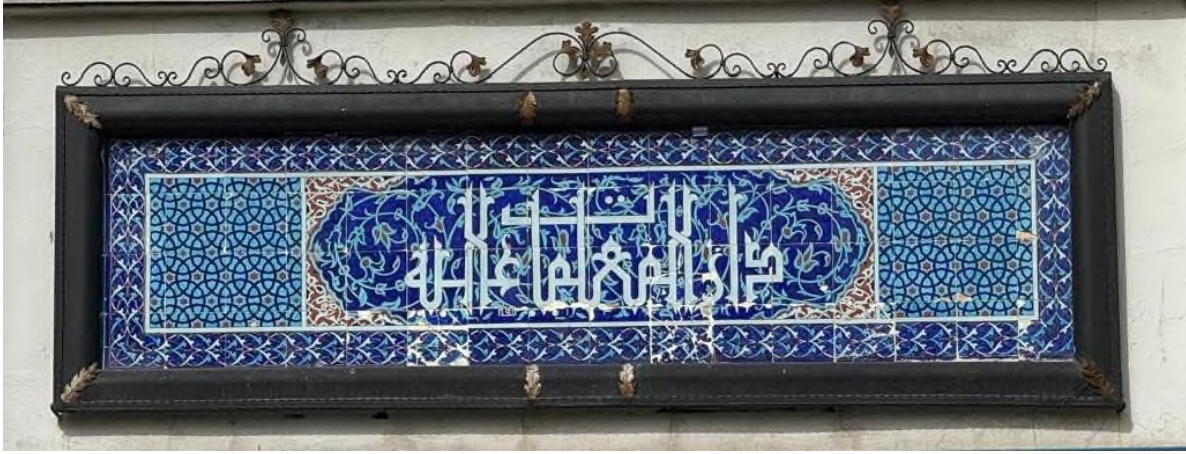
Foto 13. Darümuallimat Binası'nın Kitabesi