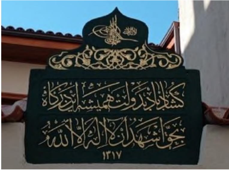
Foto 12. Kara Baba Tekkesi'nin Kitabesi

19. yüzyıl sonu 20. yüzyıl başlarında gerçekleştirilen onarım sırasında eklenen kitabenin tepelik kısmında Ulusal Mimarlık Üslubu'nu yansıtan altın yıldızlı rumi, kıvrık dal ve palmet motiflerinden oluşan kompozisyon yer almaktadır. Tepeliğin üzerinde yer alan ve yukarı bakan kısmı sivri sona eren elips form içinde ise tuğra biçiminde istiflenmiş kelime-i tevhid bulunmaktadır. (Foto 12.)