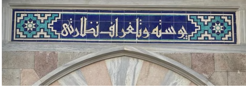
Foto 15. Posta ve Telgraf Nezareti Binası'nın Kitabesi