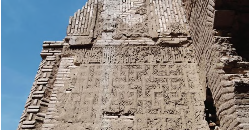
Foto 2. Ribat-ı Mahi Çiçekli Kûfi Kitabe Detayı

Karahanlı Devri mimarisinin özellikleri Gazneliler Dönemi'nde de devam etmiştir. Bu dönemde de kullanılan en önemli malzeme tuğla olmuştur. Yapıların kitabeleri genellikle bitkisel motiflerle zenginleştirilmiş kûfi yazılardan oluşmaktadır. Gazneli Mahmud'un emriyle Şehname yazarı Firdevsi'nin anısı için 1019 yılında Serahs yolu üzerinde inşa edilen Ribat-ı Mahi, 4 eyvanlı plan tasarımıyla önemli bir yapıdır. Yapının eyvanlarının arkasında bulunan birimlerin kubbe ile örtülmesi, kubbe-eyvan ilişkisi açısından mühimdir (Aslanapa, 2019: 56). Yapının günümüze ulaşan bölümünde taç kapıda bir bordür formunda yerleştirilen tuğladan yapılmış kitabesinde kıvrık dal, rumi ve çiçek motifleriyle zenginleştirilmiş kûfi hat görülmektedir. (Foto 2.)