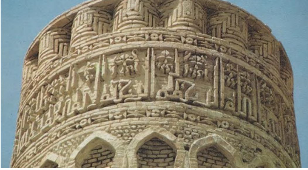
Foto 1. Çar Kurgan Minaresi Çiçekli Kûfi Kitabe Detayı

Karahanlı Devri mimarisinin özellikleri Gazneliler Dönemi'nde de devam etmiştir. Bu dönemde de kullanılan en önemli malzeme tuğla olmuştur. Yapıların kitabeleri genellikle bitkisel motiflerle zenginleştirilmiş kûfi yazılardan oluşmaktadır. Gazneli Mahmud'un emriyle Şehname yazarı Firdevsi'nin anısı için 1019 yılında Serahs yolu üzerinde inşa edilen Ribat-ı Mahi, 4 eyvanlı plan tasarımıyla önemli bir yapıdır. Yapının eyvanlarının arkasında bulunan birimlerin kubbe ile örtülmesi, kubbe-eyvan ilişkisi açısından mühimdir (Aslanapa, 2019: 56). Yapının günümüze ulaşan bölümünde taç kapıda bir bordür formunda yerleştirilen tuğladan yapılmış kitabesinde kıvrık dal, rumi ve çiçek motifleriyle zenginleştirilmiş kûfi hat görülmektedir. (Foto 2.)