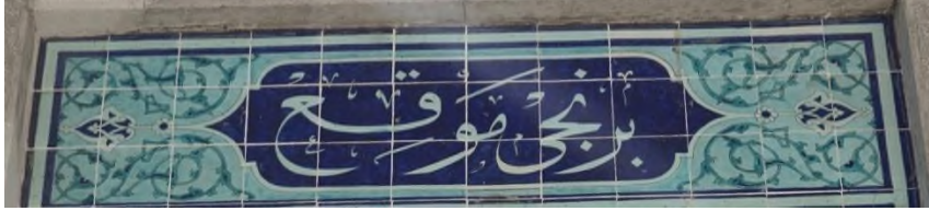
Foto 29. Haydarpaşa İskelesi Birinci Mevki Kitabesi

İskelede mevkileri belirten "Birinci Mevke" ve "İkinci Mevke" ifadelerinin yazılı olduğu kitabeler de bulunmaktadır. Bu kitabelerdeki bezemeler benzer olup renk kullanımında farklılıklar söz konusudur. Kartuşla sınırlandırılan ifadeler lacivert zemin üzerine yazılmıştır. Kartuşların her iki yanı, iskele adının yazılı olduğu kitabelerdeki gibi kıvrımlı bir düzenleme ucundaki palmet motifleriyle sona ermiştir. Kartuşun iki yanındaki bölümler ise simetrik bir biçimde rumi ağırlıklı girift bir kompozisyonla zenginleştirilmiştir. (Foto 29-30.)