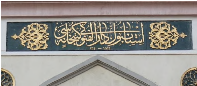
Foto 32. Medreset-ül Kuzat İstanbul Dârül Fünûnu Kütüphanesi Kitabesi

Kitabenin her iki yanında simetrik olarak yerleştirilmiş rumi, kıvrık dal ve palmet motiflerinden oluşan süslemeler Ulusal Mimarlık Üslup özelliklerini yansıtmaktadır. (Foto 32.)