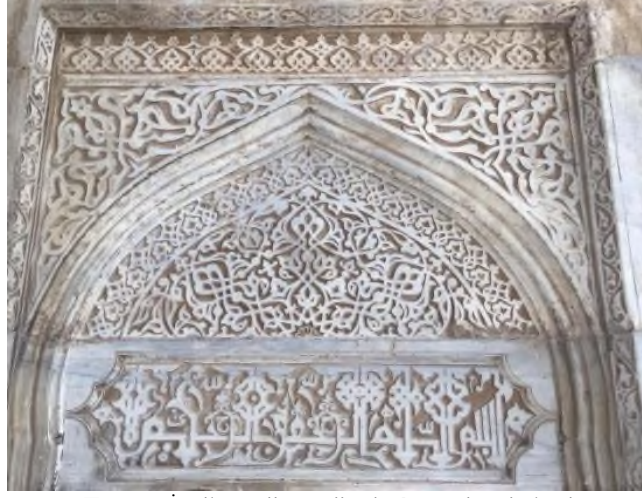
Foto 5. İznik Yeşil Camii'nde Besmele Kitabesi

motifleri görülmektedir. Bazı harflerdeki bitkisel süslemelerin uzantıları bir araya getirilerek örgülü/geometrik süsleme biçimi oluşturulmaya çalışılmıştır. (Foto 5.)