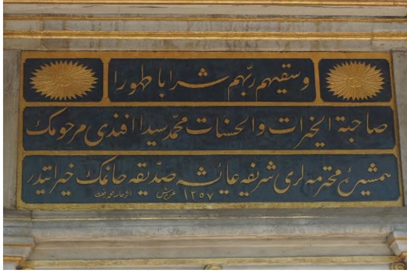
Foto 9. Ayşe Siddika Hatun Çeşmesi'nin Kitabesi

motifini hatırlatan kompozisyonla benzerliği, üslubun kitabe süslemelerine olan etkisini yansıtmaya bakımdan önemlidir. (Foto 9.)