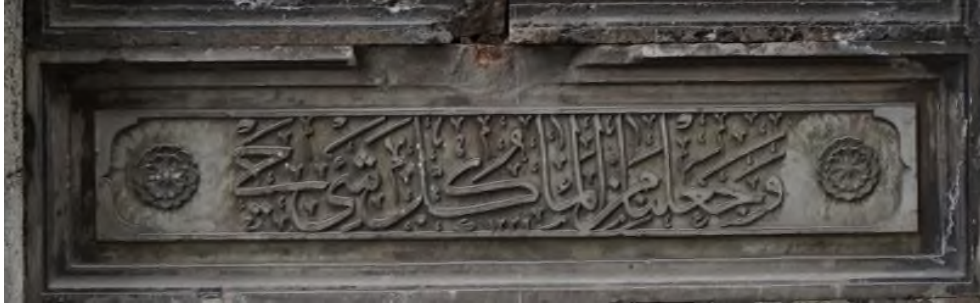
Foto 21. Çemberlitaş Şatır Sokak Çeşmesi'nin Kitabesi

Yatay dikdörtgen formlu kitabe mermerden yapılmıştır. Kitabe üzerinde Ulusal Mimarlık Üslubu özellikleri gösteren süslemeler ise, kitabenin her iki köşesinde yer alan ve kabartma tekniğinde yapılmış klasik formlu gülbezek motifleridir. (Foto 21.)