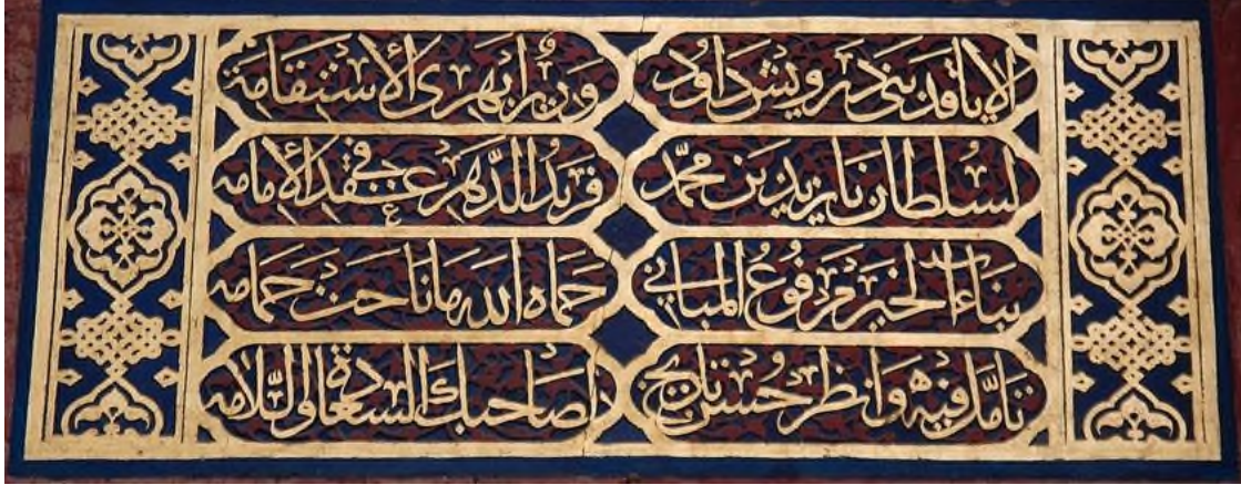
Foto 6. Davut Paşa Camii'nin Kitabesi