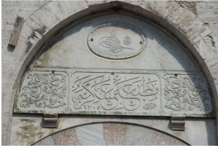
Foto 11. Süleymaniye Darüşşifası'nın Kitabesi

Kitabe kartuşunun her iki yanında bulunan kareye yakın alan içinde kabartma tekniğinde yapılmış rumi ve kıvrık dal motifleriyle Ulusal Mimarlık Üslubu'na işaret eden kompozisyonlar göze çarpmaktadır. (Foto 11.)