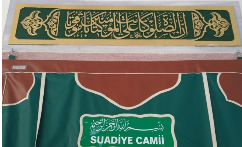
Foto 14. Suadiye Camii'nin Kitabesi

Kitabedeki motifler caminin mimari üslubunu yansıtan bir görünümdeydir. Yazıyı çevreleyen kartuşun her iki yanında klasik motiflerden oluşan bir kompozisyon izlenmektedir. Kartuşun kıvrımlı hatlardan oluşan yanlardaki uç bölümleri simetrik olarak yerleştirilmiş büyük palmet motifleri şeklinde sona ermiştir. Palmetlerin içi daha küçük palmet, rumi ve kıvrık dal motifleriyle zenginleştirilmiştir. (Foto 14.)