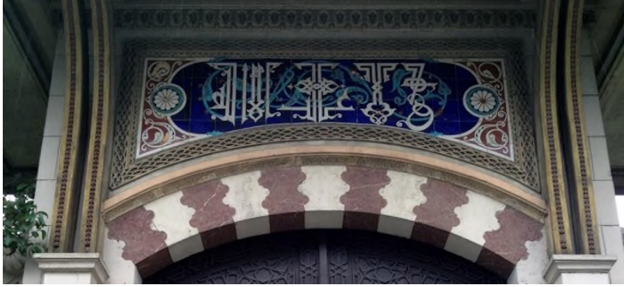
Foto 19. Abdülmeccid Efendi Köşkü'nün Kitabesi

Köşk bahçesini sokak ile ayıran kapının basık kemer açıklığının üzerinde yatay dikdörtgen panoda çiniden yapılmış kitabesi bulunmaktadır. Kitabede kûfi yazı türüyle " La galibe illallabi " ifadeleri yazılıdır. Kitabedeki süslemeler Ulusal Mimarlık Üslubu'nu yansıtmaktadır. Harflerin uçları geometrik motif ve rumi, palmet gibi bitkisel motiflerle zenginleştirilmiştir. Metnin zeminine yazıyla sarmaş dolaş biçimde turkuaz renkli rumiler işlenmiştir. Kitabeyi sınırlandıran kartuşun köşebentlerinde kırmızı zemin üzerine beyaz renkte yapılmış rumi ve kıvrık dal motifleri burada da klasik esintiler olarak belirmektedir. (Foto 19.)