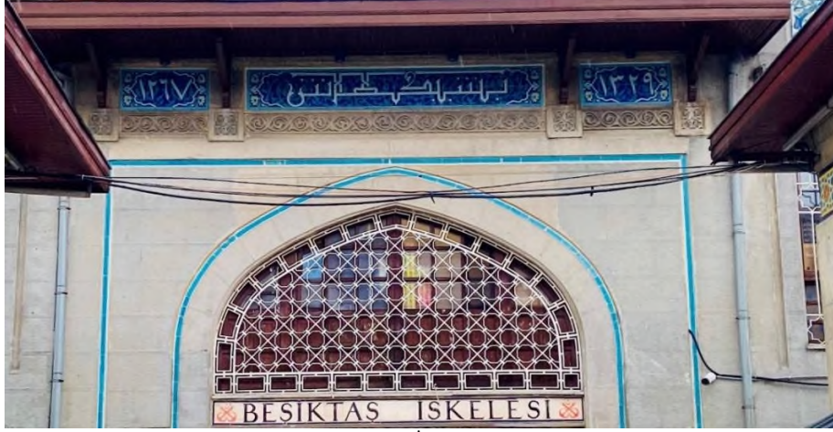
Foto 20. Beşiktaş İskelesi'nin Kitabesi