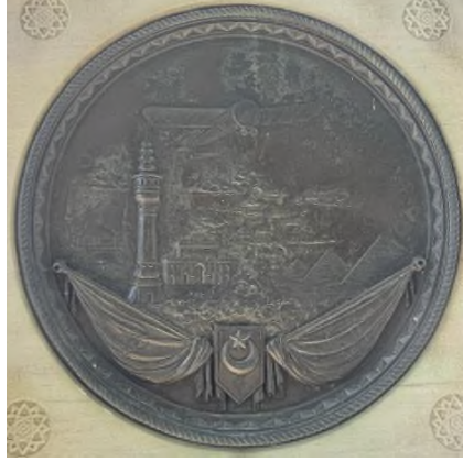
Foto 26. Tayyare Şehitleri Anıtı'nın Tasvir Kitabesi