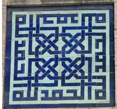
Foto 16. Hubyar Camii'nde Ma'kılı Kitabe