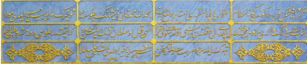
Foto 17. Yeşilköy Mecidiye Camii'nin Kitabesi (www.ottomaninscriptions.com)

Kitabenin sağ ve sol alt paftalarında simetrik bir biçimde işlenen altın yaldızlı salbekli şemse motifleri Ulusal Mimarlık Üslubu'nu yansıtan kitabe bezemelerine örnektir. Salbekler palmet motifi biçimindedir. Şemse motifinin içi kıvrık dal ve rumi gibi klasik motiflerle zenginleştirilirken salbeklerin içi de daha küçük palmet ve rumi motifleriyle tezyin edilmiştir. (Foto 17.)