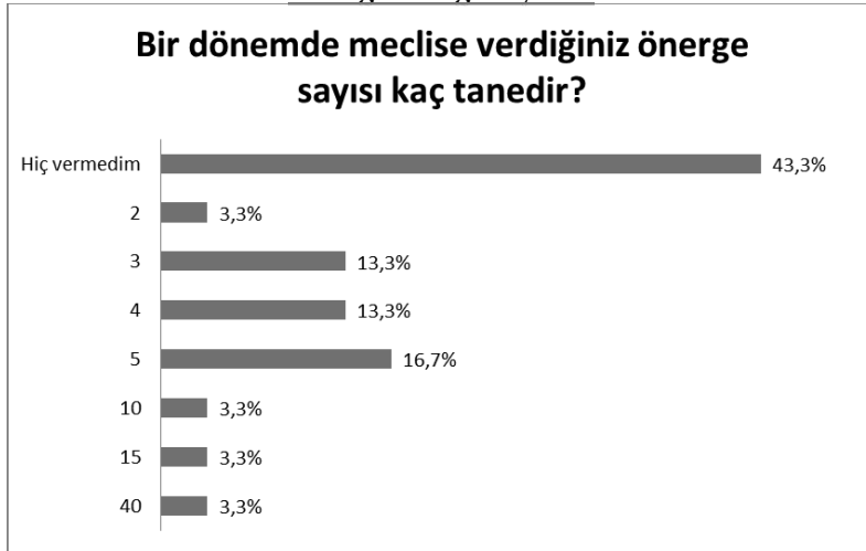
Grafik3: Adıyaman Belediyesi Meclis Üyelerinin verdiği önerge sayıları

Belediye meclisine verilen önergeler açısından üyeleri değerlendirdiğimizde ise %43,3'nün hiç önerge vermediği görülmektedir.