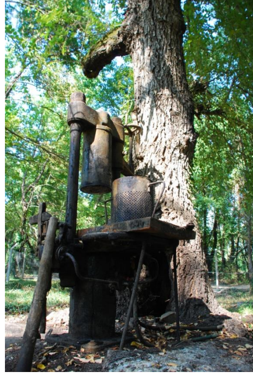
Şekil-1.Sığıla ormanı içerisinde bir görünüm. Şekil-2.Sığıla yağı üretiminde kullanılan pres.

Köyceğiz Bölgesi'nde Osmanlı İmparatorluğu Dönemi'nden bu yana çeşitli dönemlerde değişen yerel tarım politikaları üretim biçimlerinde değişimlere yol açarak Anadolu Sığıla Ormanları üzerinde baskı yaratmışsa da, bu değişimler 1950-2010 arası dönemde olduğu kadar dönüştürücü ve yok edici bir etki yaratmamıştır. 1950-2010 arası dönemde ortaya çıkan baskının daha çok devlet eliyle şekillendiğini görmekteyiz. İlgili dönemde devlet için narenciye üretimi daha ekonomikti ve Anadolu Sığıla Ormanları bu getiri için feda edilebilirdi. Anadolu Sığıla Ormanları'nın bulunduğu alanlarda narenciye tarımı yapmak üzere ormanın yok edilmesi, bu yeni alanların bakımı-sulaması, narenciye ürünlerinin satışı, nakliyesi, pazarlaması için piyasa oluşturulması talebi ve tüm bu sorunlar için politik ve hukuki düzenlemelerin tamamlanması devlet tarafından yerine getirilmiştir. Narenciye alanları