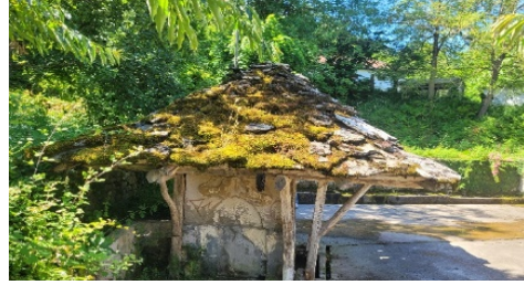
Şekil 1 Otmanlı Çeşmesi

Fırınlar, köyün günlük yaşamında önemli bir rol oynamıştır. Serenderler ise sadece mimari açıdan değil, aynı zamanda tarım faaliyetleri için sağladığı uygun ortam ile de köyün tarımsal geçimini desteklemektedir. Köydeki sivil mimarlık örneği yapılar ise geçmişle günümüz arasında bir köprü kurmaktadır. Bu yapılar, geleneksel Ayancık mimarisinin izlerini taşıyan ve köyün karakteristik dokusunu oluşturan unsurlardır. Bakırlı Zaviye köyü, sadece fiziksel yapısıyla değil, aynı zamanda kültürel kimliği ve tarihi derinliğiyle de öne çıkmaktadır.