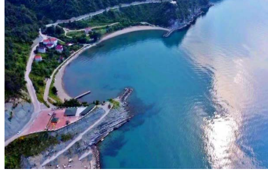
Şekil 15 Çamurca Plajı