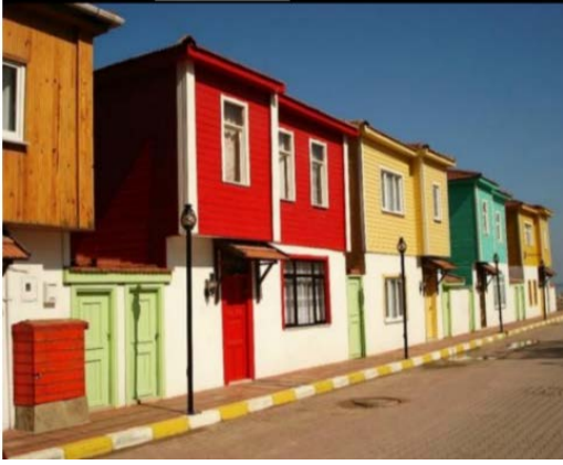
Şekil 11 Hakan Ünal Caddesi Tarihi Evleri