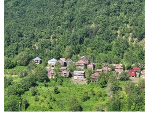
Şekil 7 Kızılcaakaya Köyü evleri

Kızılcaakaya Köyü: Kızılcaakaya, Sinop'un Ayancık ilçesine ait bir köydür ve ismini köy halkı tarafından adının tepesindeki kaya taşlarından almaktadır. Sinop il merkezine 77 km, Ayancık ilçe merkezine 35 km uzaklıktadır. Beton binalardan yoksun bir yapıya sahip olan köy, tarihi boyunca büyük bir nüfusa ev sahipliği yapmış, ancak 1970'lerden itibaren göç almıştır. Köyde yaşlı nesil Batı Anadolu ağzıyla, genç nesil ise İstanbul ağzıyla konuşmaktadır. Köyde camii ve artık hizmet vermeyen bir ilkokul bulunmaktadır. Misafirperverlik köy halkı için önemli olup, geçmişte misafirler için özel bir misafir odası bulunmaktaydı. Köydeki geleneksel düğünler üç gün sürer ve atlarla yapılan alaylarla gelinler damat evine götürülürdü. Kızılcaakaya'nın gastronomik zenginlikleri arasında Mısır Keşkeği, Tirit ve Kestane Böreği gibi yemekler yer almaktadır. Doğal güzelliklerle çevrili olan köy, uçurumun kenarına ve yüksek bir tepeye kurulmuştur, etrafını Karadeniz ormanları kaplamaktadır (Köylerim, 2020).