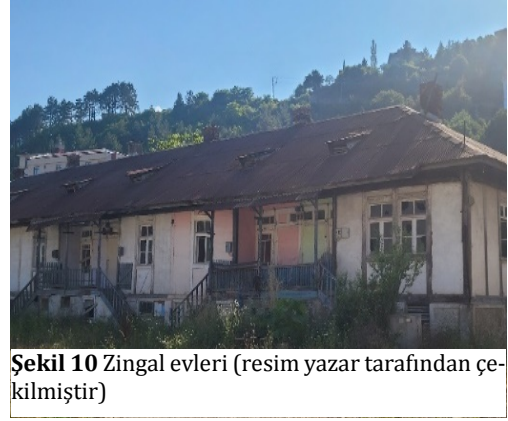
Şekil 10 Zingal evleri

Belçika Evleri (Zingal Evleri): Zingal şirketi, Ayancık'ta modern bir yerleşim ve endüstriyel altyapı oluşturarak bölge ekonomisinin ve sosyal hayatının gelişimine katkıda bulunmuştur. Fabrika çalışanları için özel lojmanlar ve işçiler için barakalar inşa edilmiş, bu alan zamanla Koloni Mahallesi olarak adlandırılmıştır. Bu sosyal yapı, Ayancık'ın demografik ve kültürel yapısını önemli ölçüde etkilemiştir. Zingal, sosyal ve sportif alanların inşasında öncü rol oynamış, tenis kortu, futbol sahası, voleybol ve basketbol sahaları gibi tesislerle bölgedeki sosyal hayata katkı sağlamıştır. Zingal şirketi, 1942 yılına kadar 35 lojman ve baraka inşa ederek kendi personeline konut sağlamıştır. Fabrikanın şehirdeki konut inşaatındaki başarısı, şirketin ticari anlamda da bir girişimde bulunmasına yol açmış ve Türkiye'nin ilk prefabrik evini üretmesine öncülük etmiştir (Kılıç, 2022).