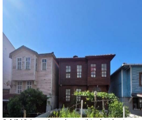
Şekil 12 Ayancık merkez tarihi evleri

Ayancık'ın tarihi zenginlikleri ve özellikle sahil boyunca yer alan yalı evleri, turistler için büyük bir çekim merkezi haline gelmiştir. Bu evlerin turizme açılması, bölgenin tarihî ve kültürel çeşitliliğini keşfetmek isteyen ziyaretçiler için önemli bir fırsat sunmaktadır. Sahil şeridindeki bu ahşap yapılar, Ayancık'ın geçmişini anlamak ve bu zengin mirası görmek isteyen turistlere benzersiz bir deneyim vadetmektedir.