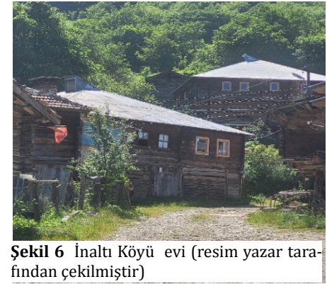
Şekil 6 İnalıtı Köyü evi

İnalıtı Köyü ve İnalıtı Mağarası : İnalıtı Köyü, Sinop il merkezine 83 km, Ayancık ilçe merkezine 29 km uzaklıkta bulunan bir yerleşim yeridir ve özellikle İnalıtı Mağarası ile tanınmaktadır. Köy, doğal güzelliklerinin yanı sıra tarihle harmanlanmış arkeolojik zenginliklere de ev sahipliği yapmaktadır. Kaya Yaylası mevkiindeki höyük ve antik yerleşim alanı, bölgenin tarihi dokusunu yansıtan önemli bir arkeolojik alan olarak öne çıkmaktadır. İnalıtı Mağarası, denizden 1070 metre yükseklikte, Kaya Yaylası mevkiinde konumlanmıştır. Mağaraya araçla ulaşımın mümkün olduğu ilk 50 metrelik bölüm, ziyaretçilere kolay bir erişim sunmaktadır. MTA tarafından 1996 yılında gerçekleştirilen inceleme sonucunda, mağaranın 300 metrelik bölümü aydınlatılarak turizme açılmıştır. Ancak, mağaranın devamındaki 358 metrelik kısım içerisinden sadece 125 metrelik bölümün turizme uygun olduğu belirlenmiştir. İnalıtı Mağarası, doğu-batı yönünde uzanan bir galeriye sahiptir ve ziyaretçilere etkileyici bir tarihî ve coğrafi deneyim sunmaktadır (Kültürportali.gov, 2021).