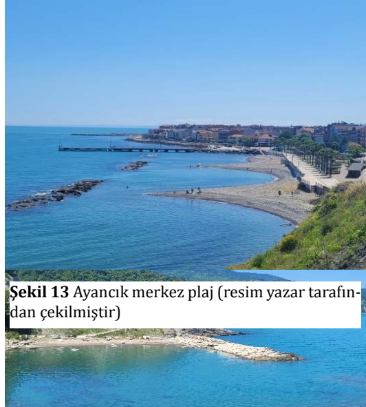
Şekil 13 Ayancık merkez plaj

Ayancık Merkez plajı: Ayancık Merkez İlçe Plajı, özellikle dalga kıranı sayesinde negatif etkilerden korunarak, doğal güzellik barındırmaktadır. Bu plaj, sadece deniz ve kumdan ibaret olmayıp, aynı zamanda çeşitli tesisler ve düzenlemelerle ziyaretçilere bir deniz tatili deneyimi sunmaktadır. Ayancık Merkez İlçe Plajı'nda yapılan suya giriş merdiveni, ziyaretçilere rahat ve güvenli bir deniz erişimi sağlamaktadır. Sahil kenarında yer alan kafeler, çimlikler ve gölgelik oturma alanları, ziyaretçilere dinlenme ve keyif alma imkânı sunmaktadır. Plajın en dikkat çekici özelliklerinden biri, turkuaz renkteki suları ve arkasında uzanan orman manzarasıdır. Denizin berraklığı ve turkuaz rengi, güneşin deniz yüzeyinden batışı Ayancık Merkez İlçe Plajı'nı benzersiz kılan özellikler arasında yer almaktadır. Plaja ulaşım, sahil boyunca uzanan tek şeritli ve virajlı bir yol ile sağlanmaktadır.