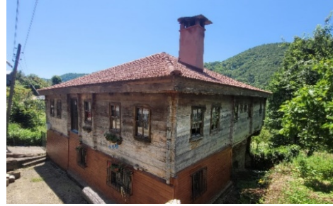
Şekil 2 Bakırlı Zaviye köyü evi