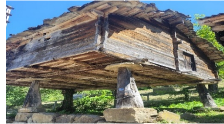
Şekil 3 Bakırlı Zaviye köyü serender örneği