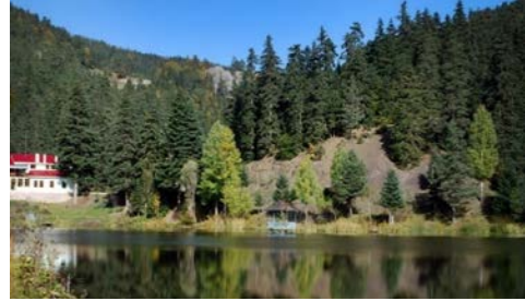
Şekil 8 Akgöl

Akgöl: Ayancık İlçesi'nin güneyinde konumlanan Akgöl, bölgedeki doğal zenginlikleri ve turistik potansiyeliyle öne çıkan bir destinasyondur. 1991 yılında Akgöl Yaylası olarak adlandırılan göl, iki akarsuyun birleşmesiyle oluşmuş ve turistik bir merkez ilan edilmiştir. 3 dönümlük bir alanı kapsayan göl, günübirlik geziler için ideal bir yerdir (Türkiye Kültür Portalı, 2023). Çevresindeki ormanlık alanlar, ziyaretçilere doğal piknik imkânı sunarken, sık köknar ağaçları ve çeşitli yaban hayvanlarıyla bölgenin doğal güzelliklerini vurgular. 2018'de Tabiat Parkı olarak tescillenen Akgöl, Çangal Dağı'nın zirvesinde konumlanarak mavi ve yeşil tonlarıyla görsel bir şölen sunmaktadır. Ayrıca, Orman İşletme Müdürlüğü'ne ait tesisler, ziyaretçilere konaklama ve hizmet imkanları sağlayarak Akgöl'ün turistik çekiciliğini artırmaktadır. Akgöl, Ayancık bölgesinde doğayla iç içe bir deneyim sunan önemli bir turistik destinasyondur (Akyol, 2023).