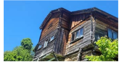
Şekil 5 Avdullu Köyü evi

Avdullu Köyü :Avdullu Köyü, Sinop il merkezine 90 km, Ayancık ilçe merkezine ise 35 km uzaklıkta bulunmaktadır. Bu konumuyla, bölgenin önemli bir köyü olarak dikkat çekmektedir. Ulaşım açısından, köyün çevresindeki doğal güzellikler ve turistik destinasyonlarla bütünleşmiş bir kanyon yolunun varlığı, tarihi dokusunu koruyan ahşap evleri turistlerin ilgisini çekmektedir. Avdullu Köyü, doğal güzellikleriyle ünlü bir tabiat harikası olarak görünmektedir.