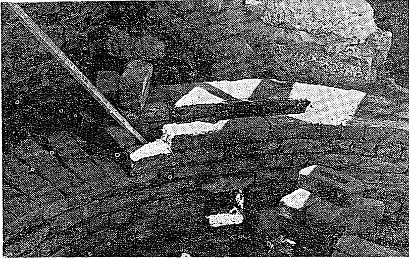
Resim 14. Fişek deliği ve gömlek duvarı. (Yapım halinde)