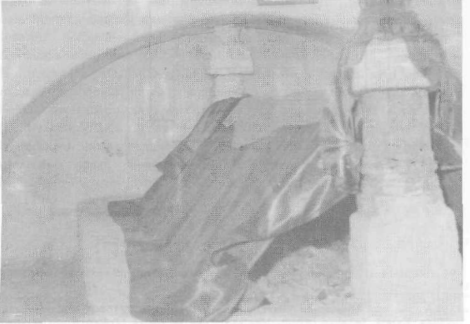
Resim 2. Seki, Eşref Paşa Türbesi, içten görünüş