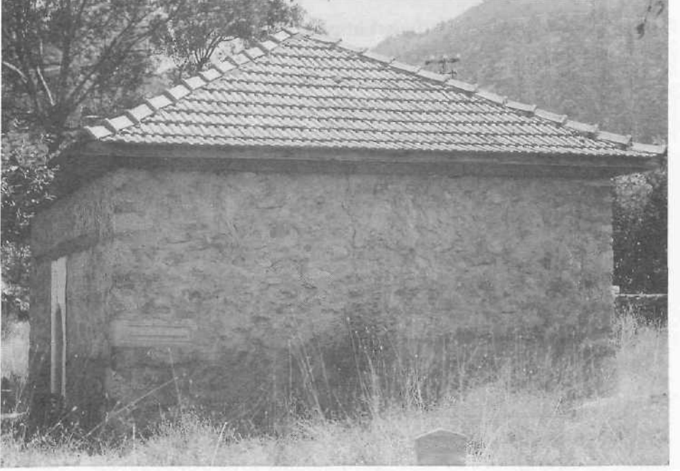
Resim 1. Seki. Eşref Paşa Türbesi, genel görünüş