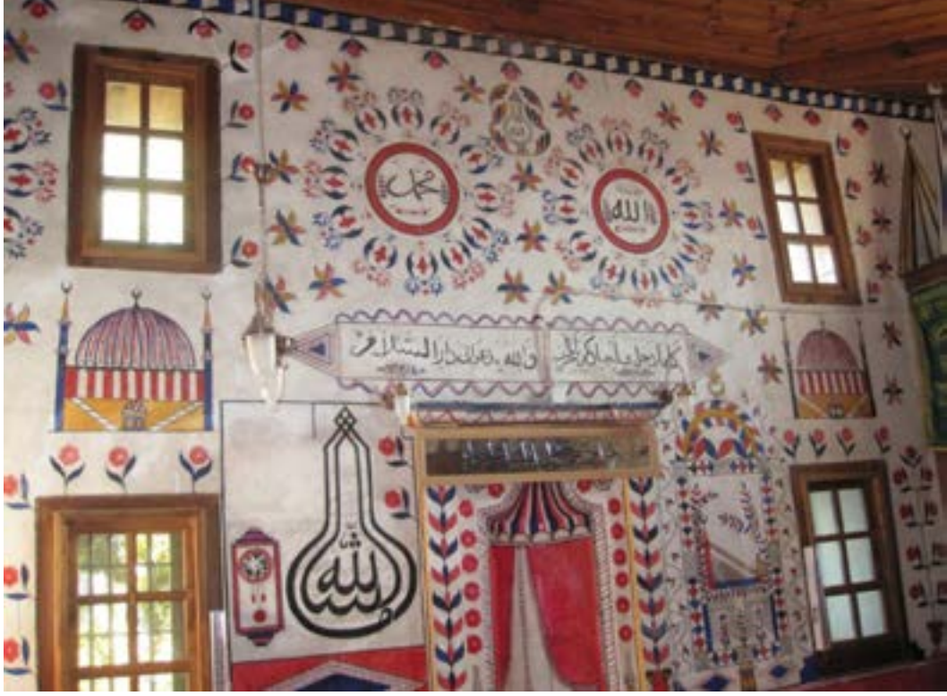
Resim 3. Savaş Köyü Aşağı Tekke Mahallesi Camii Mihrabı