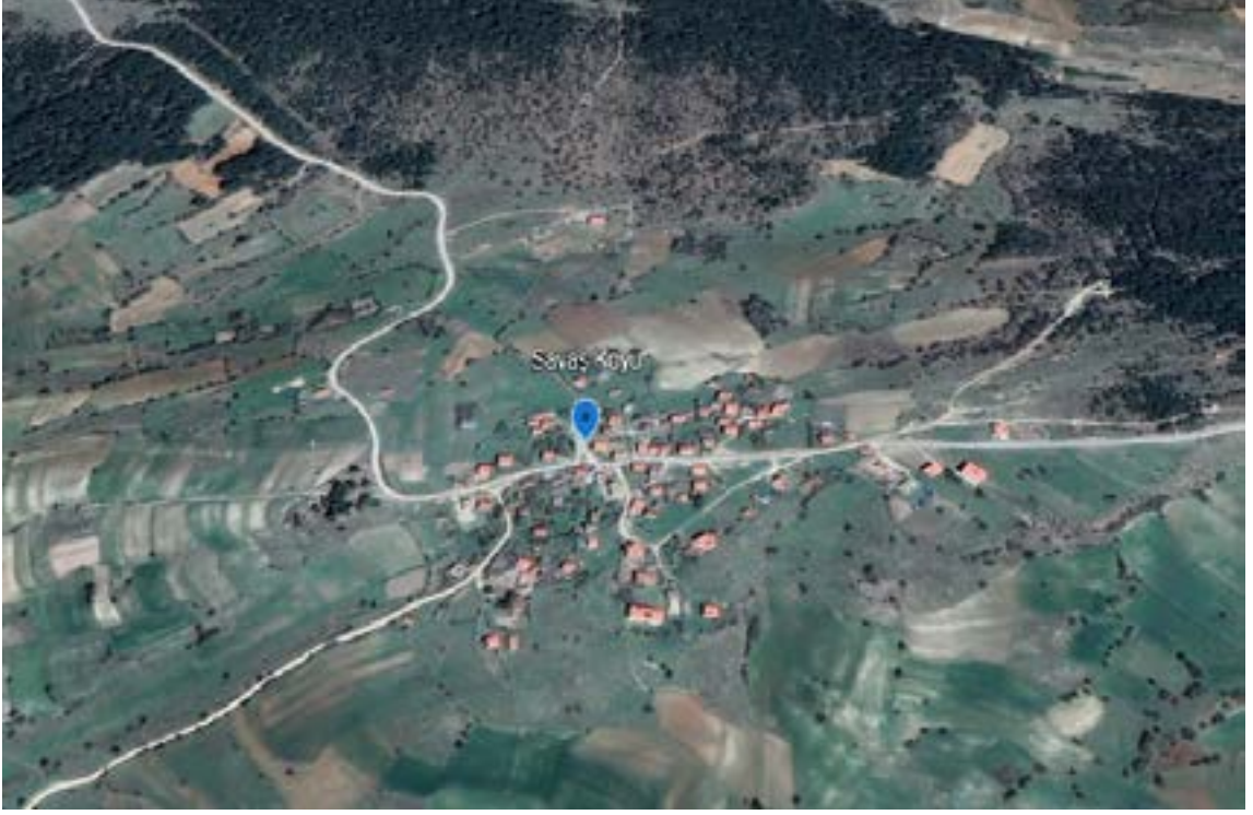
Resim 1. Ömer Seydi Zaviyesi'nin Hizmet Verdiği Savaş Köyü.