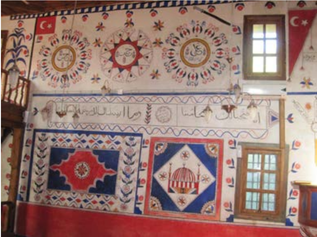
Resim 4. Savaş Köyü Aşağı Tekke Mahallesi Camii Kalem İşi Süslemeler