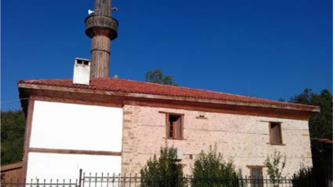
Resim 2. Savaş Köyü Aşağı Tekke Mahallesi Camii Dış Görünüő