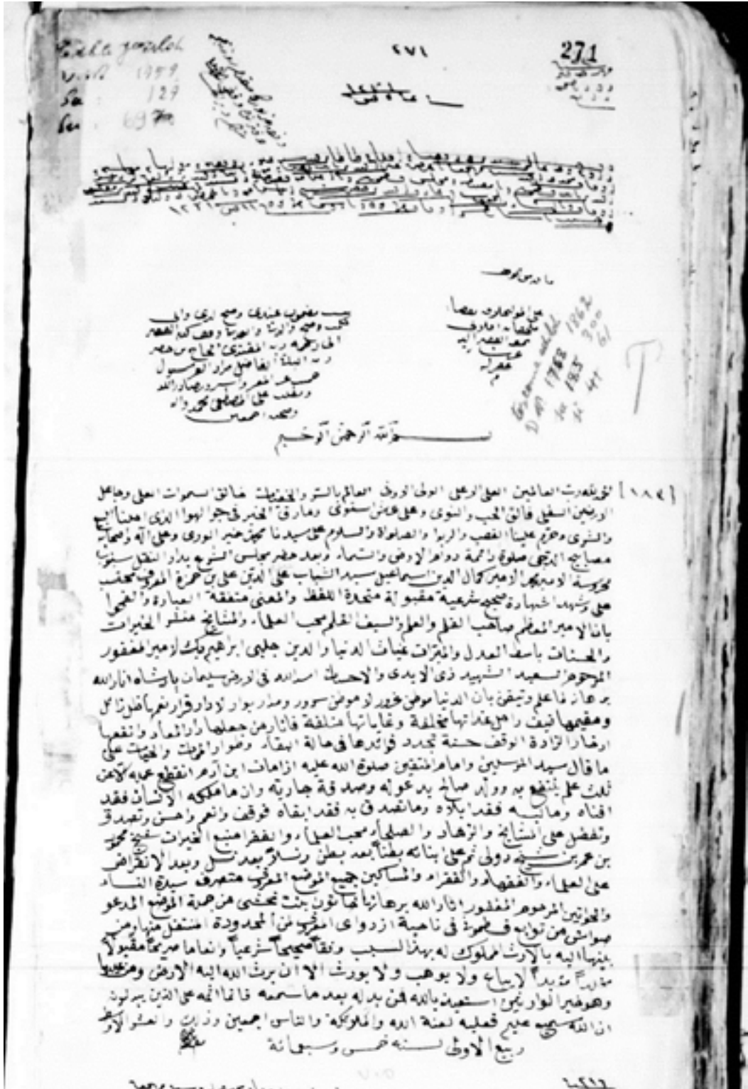
Belge 1. Şeyh Mahmud bin Ömer bin Şeyh Dolu Zaviyesi Vakfının H. 705/M. 1305 Tarihli Arapça Vakfiye Sureti (VGMA. VD. 582: 271/183).