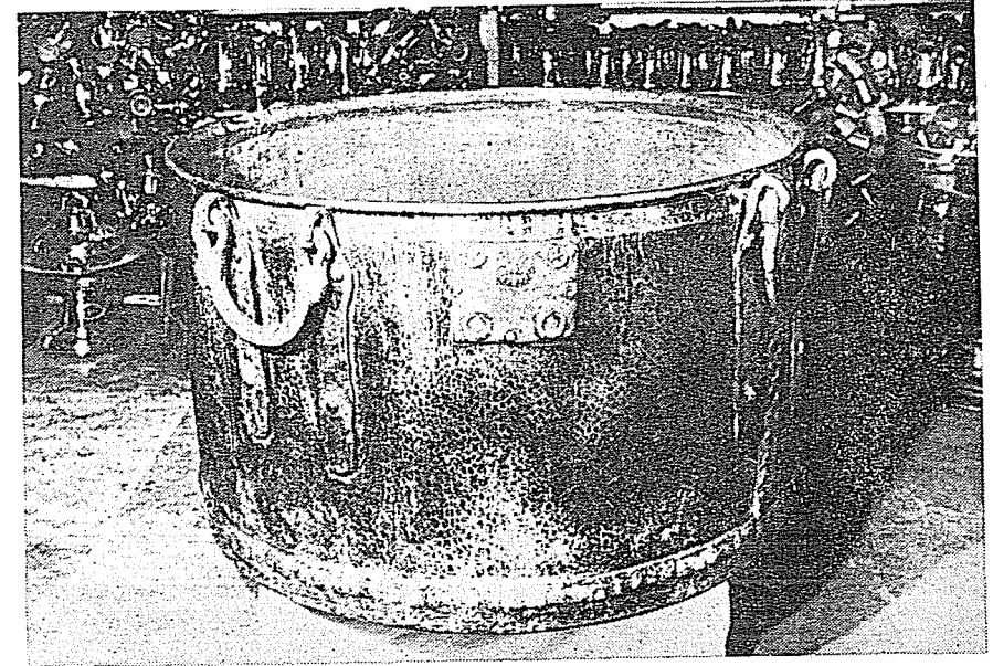
Resim 1. Kazanın genel görünüşü.