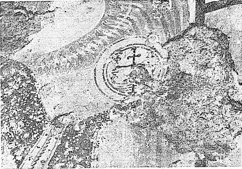
Resim 4. Melek figürünün elindeki küre.