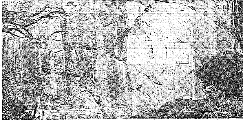
Resim 1. Freskoların kaya üzerinde genel görünümü.