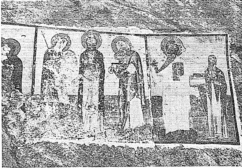
Resim 5. Meryem, Vaftizci Yahya ve İncilci Yahya; İsa Pantokrator ve bâni freskoları.