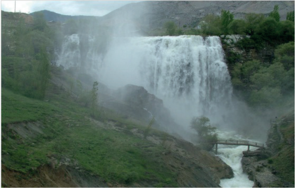
Foto 4. Tortum Şelalesi