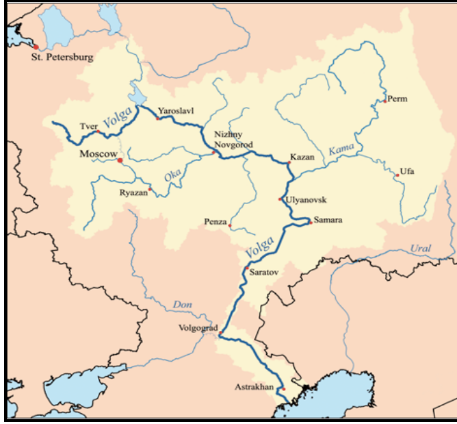
Şekil 1. Astrahan Şehri ve Volga Irmağı Havzası.

Rus hâkimiyetinde önemini koruyan Astrahan şehrinin 19. yüzyılın ilk çeyreğindeki coğrafi, ekonomik, siyasi ve dini yapısı hakkında İngiliz ve Fransız seyyahların seyahatnamelerinden faydalanılarak bilgi verilmeye çalışılmıştır. Şehirlerin bugünü için geçmişini doğru okuyabilmek son derece önemlidir. 1800'lü yılların başında Astrahan şehrinin fotoğrafına katkıda bulunabilmek için Fransız ve İngiliz seyyahların eserleri taranmıştır. Söz konusu yıllarda Rusya güneyine seyahat eden başka seyyahlar bulunmakla birlikte, eserlerinde bu şehirden hiç bahsetmemişlerdir.