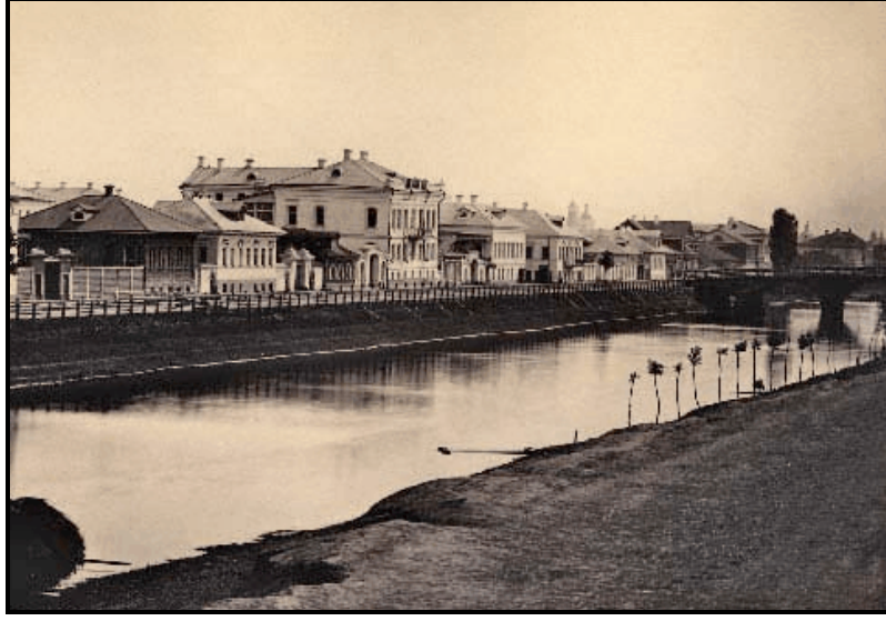
Foto 3. Astrahan’da Balıkçılık Yapılan Kanallardan Biri (Varvartsiev Kanalı 1870).

Balıkçılıkla uğraşanların sayıları, seyahatnamelerde farklı olsa da Astrahan’da 10 binin üzerinde bir nüfusun, 3 binden fazla gemiyle balıkçılık yaptığı, şehrin nüfusunun önemli bir kısmının bu işte çalıştığı, Astrahan’ın bir balıkçılık merkezi olduğu ve birçok ailenin bu işten çok zengin oldukları söylenebilir. Volga üzerinde yapılan balıkçılık şehirdeki nüfusun devamını sağlayan en önemli beslenme etkenidir. Balıklar; tuzlanıp kurutulularak uzun süre muhafaza ediliyor ve bütün Rusya’ya tanıtıldığı için de rahatlıkla alıcı buluyordu. Astrahan’ın havyarı da bütün Avrupa ülkeleri tarafından tanınıyordu. Volga kıyıları boyunca balık tuzlayan ve kurutan devasa boyutta büyük işletmeler vardı 52 . Prens Kourakin’in çiftliğinde çok sayıda Kalmuk hizmetçi çalışıyor ve bol miktarda balık tutuyorlardı.