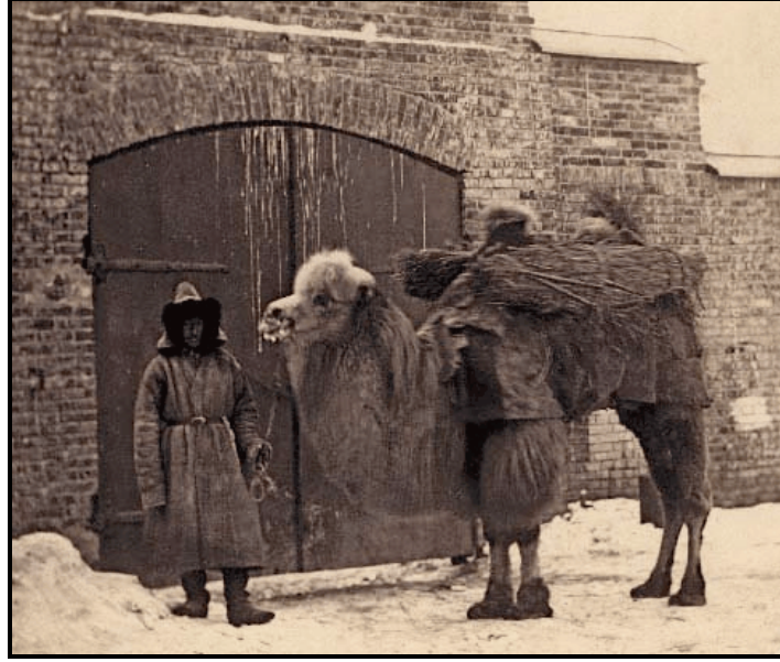
Foto 2. 19. Yüzyıl Sonlarında Devesiyle Taşımacılık Yapan Bir Astrahan'lı (1870).