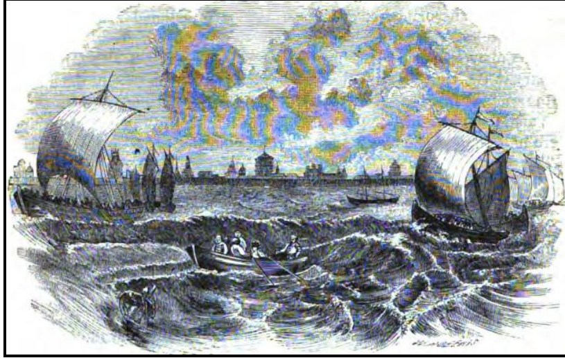
Şekil 2. Sears'a Göre Gemiler ve Astrahan Şehrinin Denizden Görünümü (s.250'den)