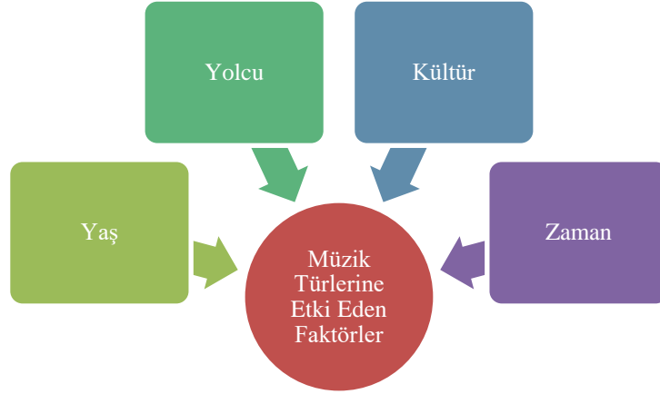
Şekil 2. Müzik Türlerine Etki Eden Faktörler