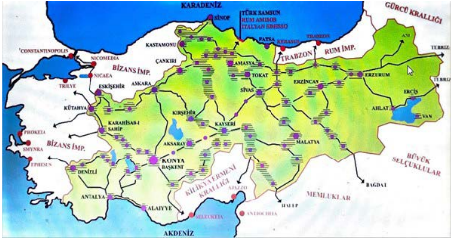
Harita 3: Türkiye Selçuklu Devleti şehirleri ve ulaşım ağı (Özcan, 2017, 140).