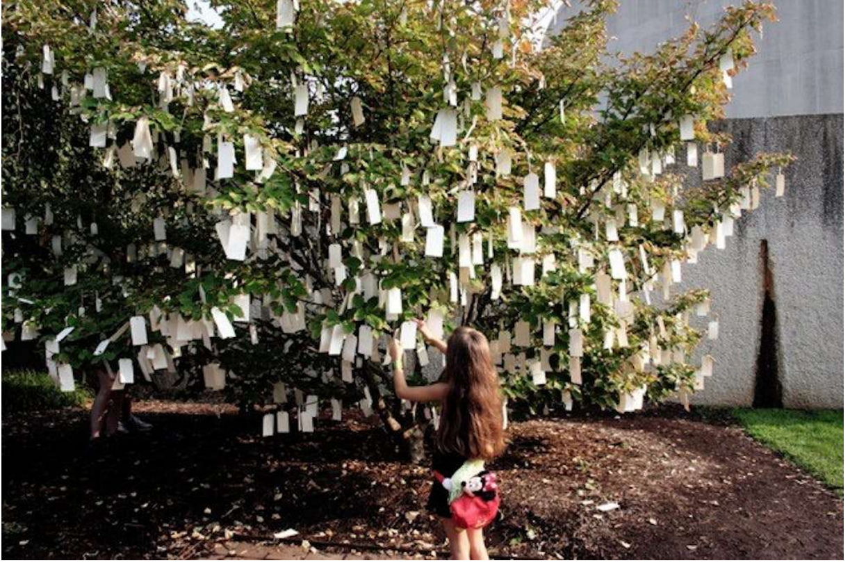
Resim 4. Yoko Ono's 'Wish Tree' Series, 2018, Photo Courtesy of Studio One