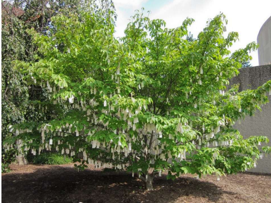
Resim 1. Yoko Ono, 2007, Wish Tree, Washington, DC, Installed at the Hirshhorn Museum and Sculpture Garden