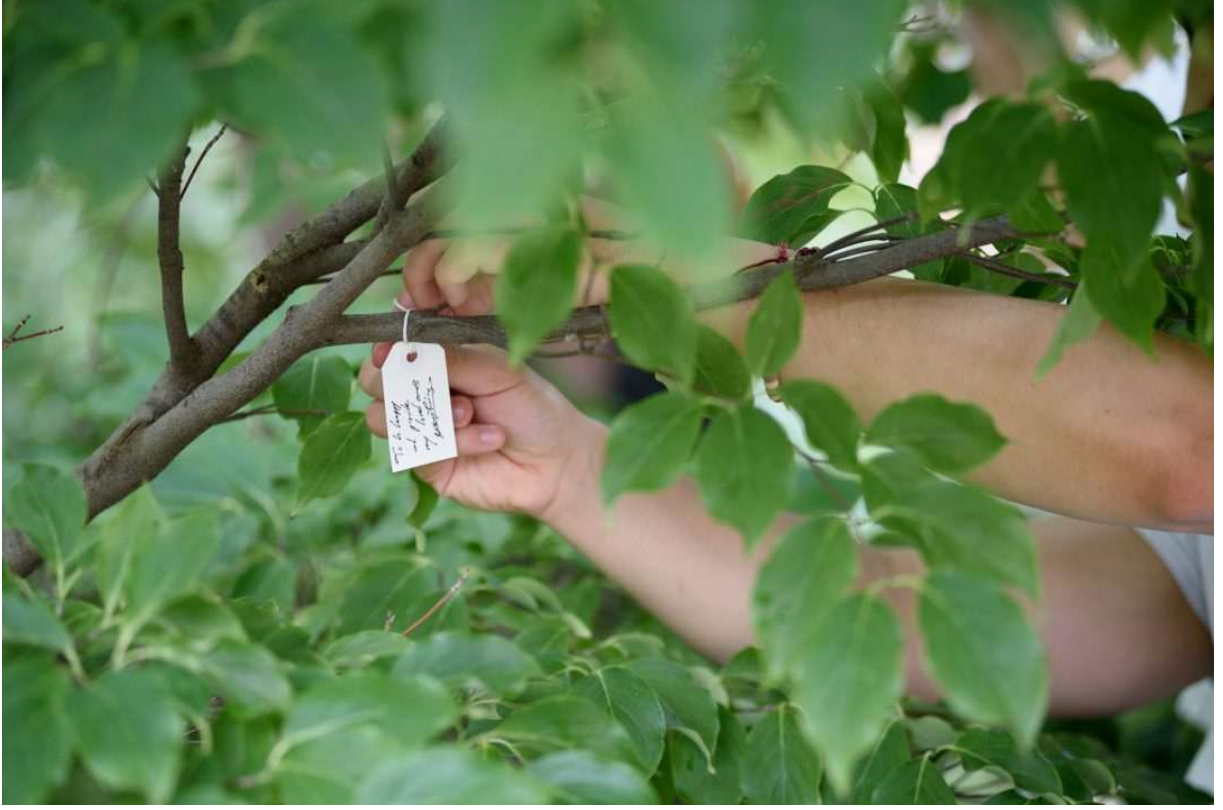
Resim 1. Yoko Ono, 2007, Wish Tree, Washington, DC, Installed at the Hirshhorn Museum and Sculpture Garden