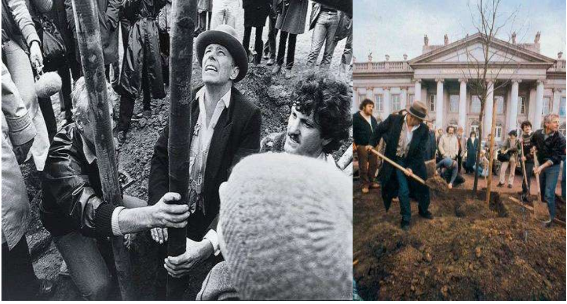
Resim 1. Joseph Beuys, 7000 Meşe, 1982