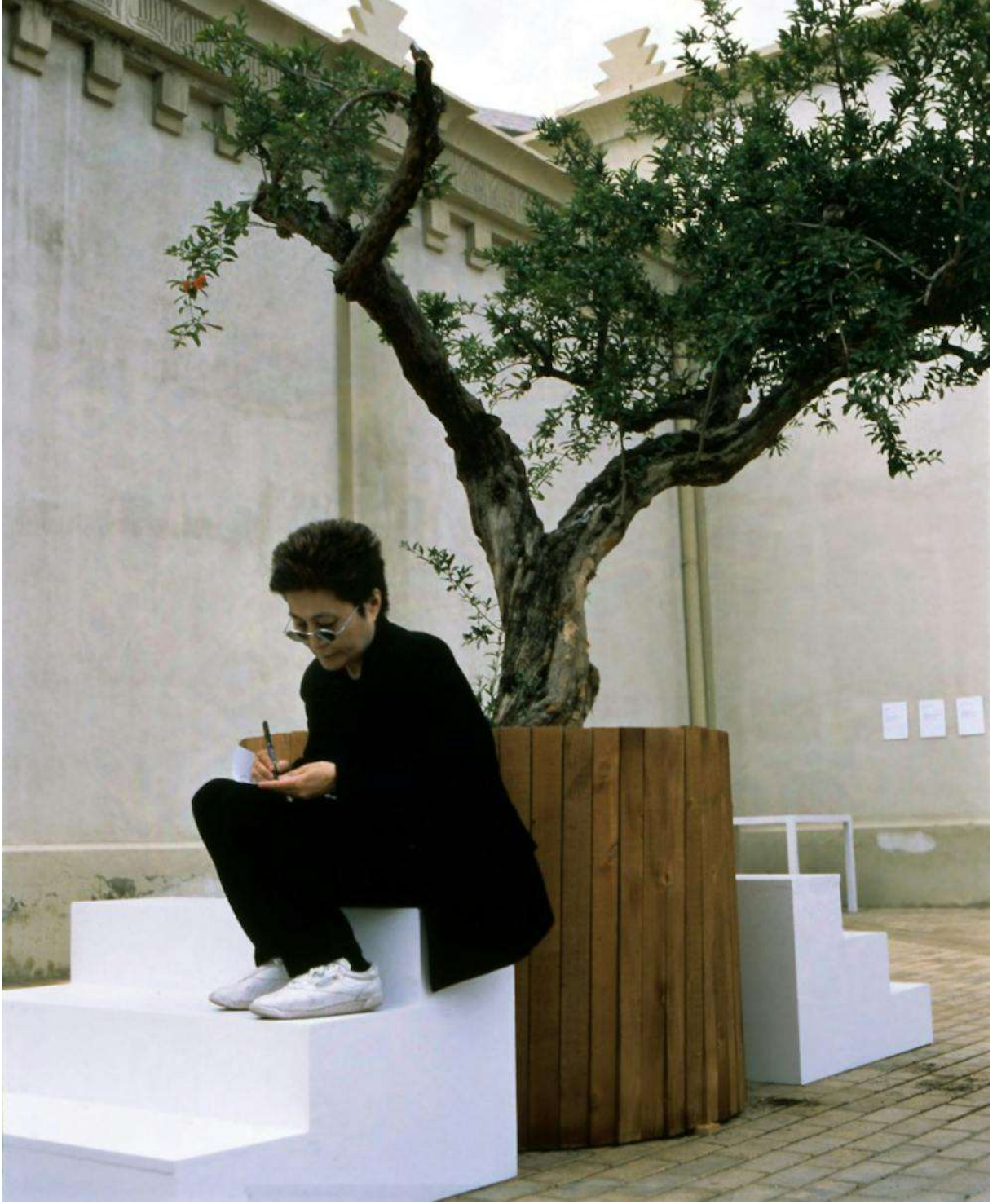
Resim 3. Yoko Ono's 'Wish Tree' Series, 2018