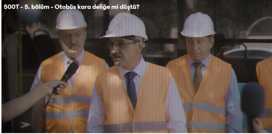
Açıklama Yapan İstanbul Valisi