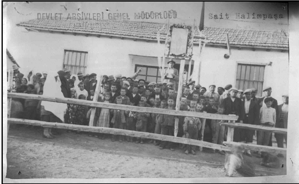
Eskişehir'in Sait Halimpaşa köylülerinin Atatürk'ü Matem Töreni.