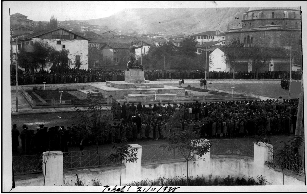
Tokat'taki Matem Töreninden bir kesit