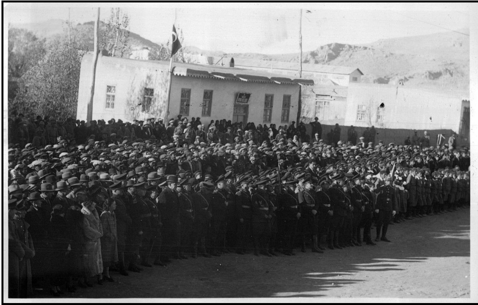
Van'daki Matem Töreninden bir kesit