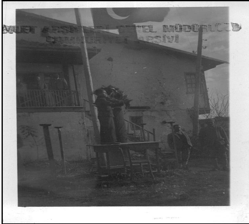
Uşak Banaz'daki törende öğrencilerden Ahmet Yılmaz konuşma yaparken