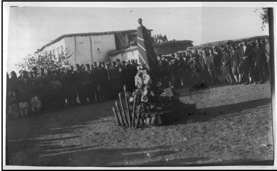
Cumhuriyet Alanında matem töreni yapan Bismilliler