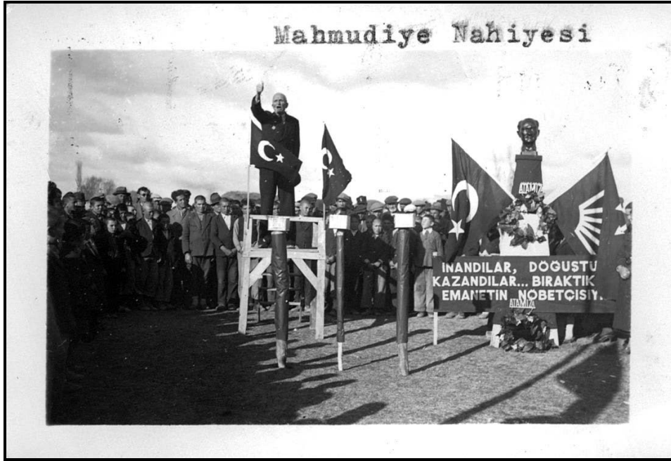
Eskişehir'in Mahmudiye Nahiyesindeki Matem Töreni.