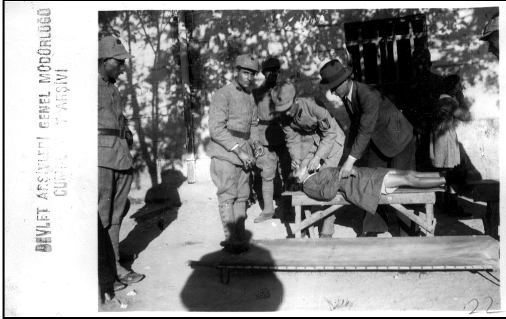
Mersin'deki Matem Törenlerinde bayılan öğrencilerden biri ve onu tedavi eden askerler