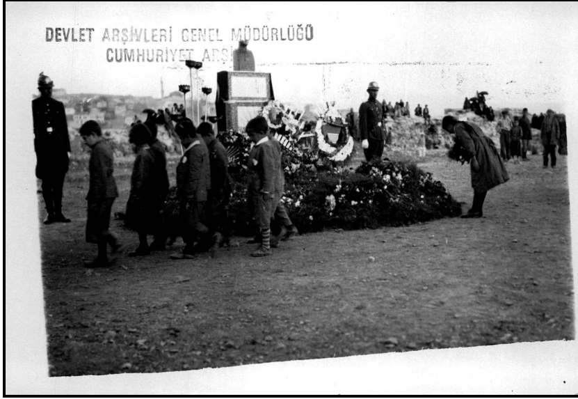
Maraş'taki Matem Töreninde çocuklar saygı geçişini yaparken