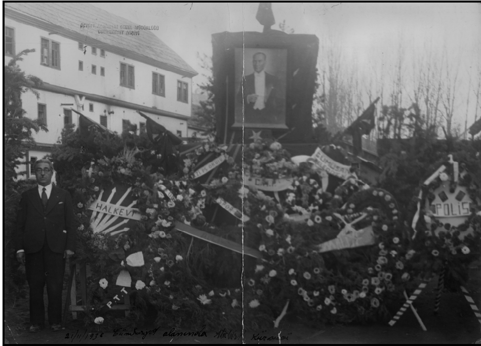
Gümüşhane Cumhuriyet Alanı'nda hazırlanan Atatürk Kursüsü.