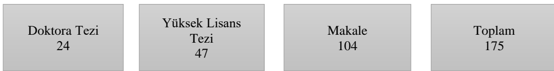
Şekil 1. Araştırmanın veri kaynakları

Çalışmada, doküman incelemesi yöntemi ile yapılan literatür taraması sonucunda ulaşılan veri kaynakları şekil 1’de gösterilmiştir: