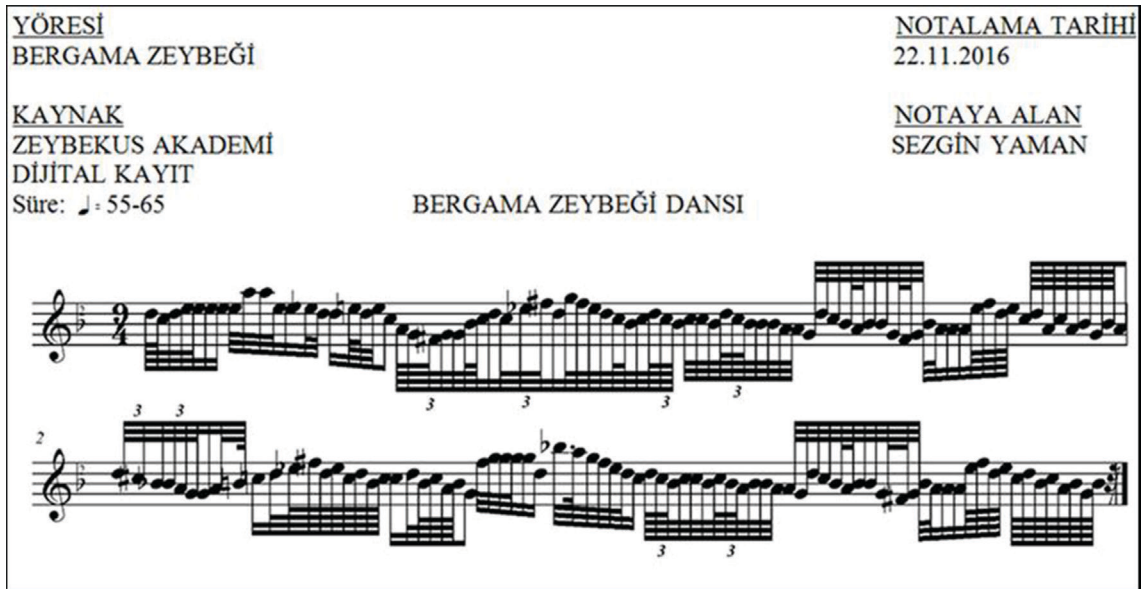
Nota 2: Bergama Zeybeği Dansı'nın eşlik müziği notası