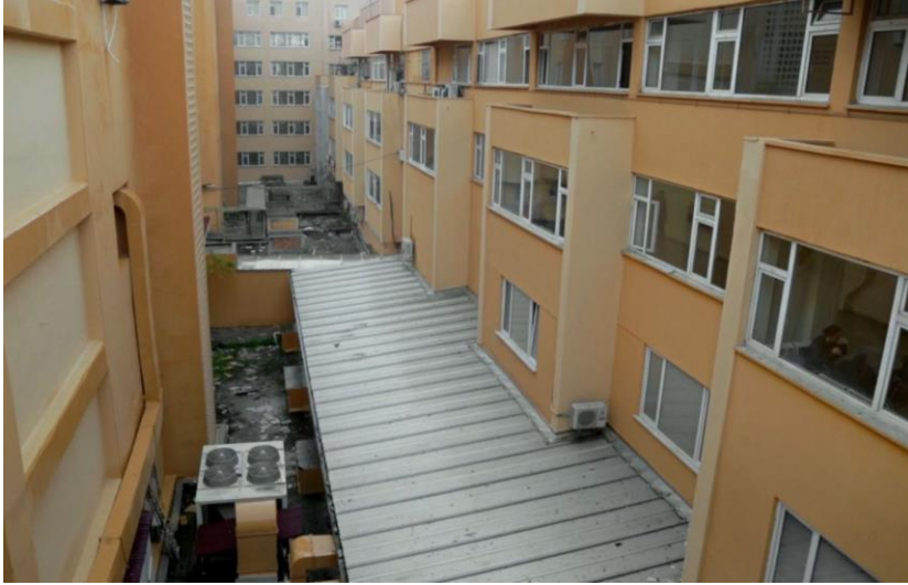
Resim 1. Maddenin Halleri 'nde Cerrahpaşa'nın Monoblok binaları

yapılar veya boş sokaklar kurmaca bir anlatı içinde toplumsal bir çöküş hikâyesini desteklemek için kullanılabilirken gerçekten yıkılmış bir yapının hikâyesi bir belgeselin başlı başına anlatısını oluşturabilir. Maddenin Halleri de bu çerçevede ikinci kategoride yer alır. Belgeselin anlatısının öznesi olan tıp fakültesi ve semt, bulunduğu bölgeye ve kültüre atıfta bulunarak sosyal ve tarihsel bağlara işaret eder. Esasında, Cerrahpaşa'da oluşan bu bağları arşive dayalı bilgileri araştırmadan film üzerinden de anlamak mümkündür. Zaten semt ve fakülte üzerine toplumun ortak bir bilinçle oluşturduğu, yadsınamayacak bir hafıza vardır. Burada arşive dayalı veriler arasında bulunmayacak bir diğer şey, belki de Cerrahpaşa'nın ne kadar eski bir kurum olduğuyla bağdaşan ve bu kurumun içinde oluşan, işlerine tutkuyla bağlı sağlık çalışanlarının ve iyileştirmeye çalıştıkları hastaların portresidir. Bu bağlamda, belgesel, Cerrahpaşa Tıp Fakültesi'nin mekânsal ve kültürel dokusunu gözler önüne sererken, aynı zamanda bu mekânın toplumun hafızasındaki yerini de ortaya koyar. Mekânın yalnızca fiziksel bir yer olmadığı, aynı zamanda toplumsal ve tarihsel bir anlam taşıdığı; sağlık çalışanlarının günlük yaşamları, hasta-hastane ilişkileri ve bu dinamiklerin oluşturduğu kültür film boyunca gösterilir. Bu anlatı, seyirciye Cerrahpaşa'nın kendine özgü dünyasını ve burada yaşananları yakından tanıma fırsatı sunarken yalnızca hastanenin değil, dışarıdaki Türkiye'nin de bir portresini çizer.