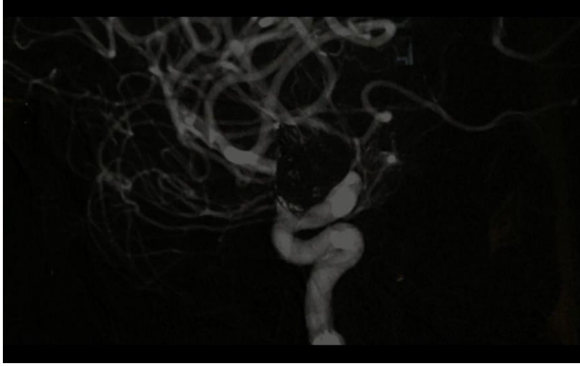
Resim 5. Akciğer tomografisi görüntüleri gibi yönetmenin görsel anlatıyı çeşitlendirdiği, davulcu sahnesi sonrası gelen ve aynı ritim eşliğinde değişen damar benzeri görseller