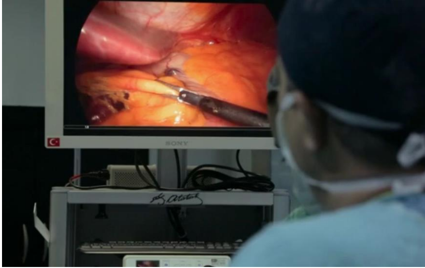
Resim 3. Gözlemci konumdaki Tortum'un kamerası laparoskop vasıtasıyla ameliyatı izlerken

Peki, yönetmen Maddenin Halleri 'ndeki gözlemci kamerasını anlatı nezdinde neye dayandırır? Tortum (2024), Maddenin Halleri 'ni, her ne kadar belgesel formunda olsa da esasında bir essay film 3 tanımlamasıyla açıklar. Esasında bu filmin bir derdi vardır ve yönetmen bu sorun üzerine seyirciyle iletişim kurmaktadır. Kendi kişisel bağları dışında, hastanenin uzun süredir tartışılan yıkılma durumu da bu durumun çıkış noktasıdır. Zaten film "Yıkılması tartışılan, doğduğum ve babamın yıllardır çalıştığı Cerrahpaşa Tıp Fakültesi'ne" yazısıyla açılır. Bu nedenle, belgeselin esas amaçlarından biri izleyiciler için eski monoblok binalara ve mekânın günlük yaşamına bir pencere açmak iken Tortum'un anlatısıyla şekillenen bir diğer söylem, binaların olası bir İstanbul depreminde yıkılacağına dair yaratılan söylemlerin, yerleşkenin bulunduğu konumun maddi anlamda değerli olması sebebiyle çıkarıldığı; bu bölgeyi otel veya daha fazla para kazandıracak bir şey için değerlendirilebileceği fikridir. Bu fikir, film boyunca sürdürülen eleştirinin kaynağıdır. Ayrıca Tortum, Cerrahpaşa Tıp Fakültesi binalarının bir kurum kültürü oluşturduğunu düşünmektedir ve bu düşüncesi Halbwachs'ın 'anısız bir öneme sahip belirli mekânlar' kavramıyla kesişmektedir. Yönetmen, bu binaların yıkılıp tekrar yapılmasından