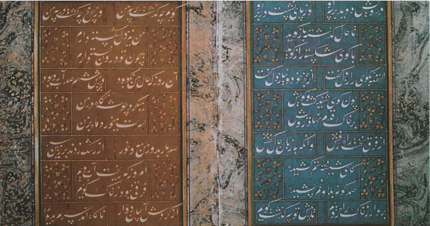
Resim 1. Guy-ı Çevgan

Ebru sanatında geleneklere bağlı kalınması, onu kültürel bir miras haline getirmiştir. Sanatın geleneksel yapısını sürdüren ustalar, öğrencilerine verdikleri icazetlerle (izin, diploma), ebru sanatında bir ekolün başlamasına neden