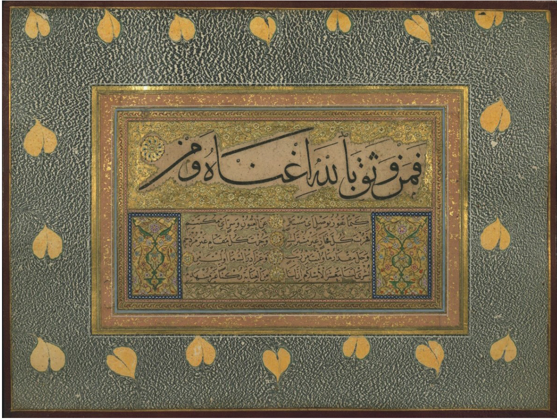
Resim 2. Hatip Ebrusu