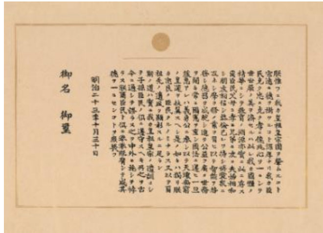
Görsel 1. 1890 Yılı, İmparatorluk Eğitim Fermanı