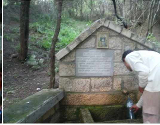
Ek. 6: Aleksandriya- “Tekke Bölgesi”nde Aziz İliya Manastırı