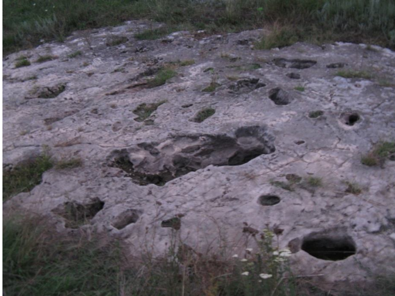
Ek. 5: Bulgaristan’ın Dobriç iline baęlı Aleksandriya- “Tekke Bölgesi”nde şifalı su kaynaęı.