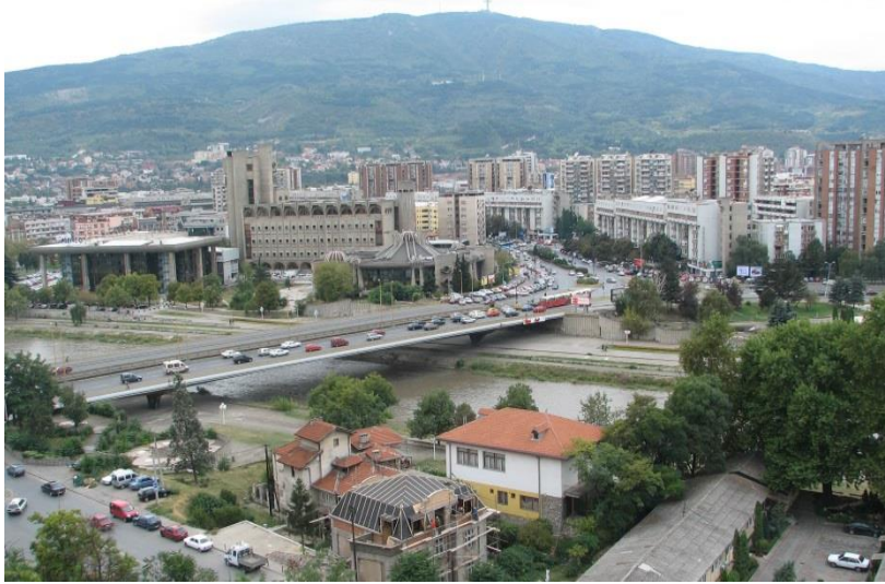
Vardar Nehri ve Üsküp

Neredeyse bütün Balkan şehirlerini gezdim, gördüm.. Bunlar arasında beş Rumeli şehri var ki, özellikle onların Osmanlı'nın medeniyet mirasını kutsal bir emanet gibi muhafaza etmeye çalıştığına, sayısız Anadolu şehrine nispet yaparcasına bunu başardığına da şahit oldum. Bu şehirler Saraybosna, Mostar, Prizren, Berat ve Üsküp'tür. “ Rumeli'nin Beş Şehri ” diyorum ben onlara..