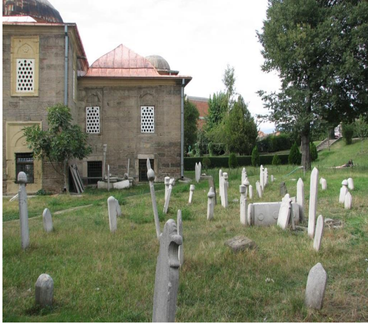
Üsküb'te Alaca Camii ve Mezarlığı

Mektebe başlayışım kadim an'aneye tamâmiyle uygun oldu. Erkenden muallim-i evvel Sabri ve muallim-i sâni Ganî efendiler bizim selâmlığa geldiler; çarşıdan bana savatlı bir divit, boyundan geçirilir, sırmalı bir cüzdanlık alınmıştı.