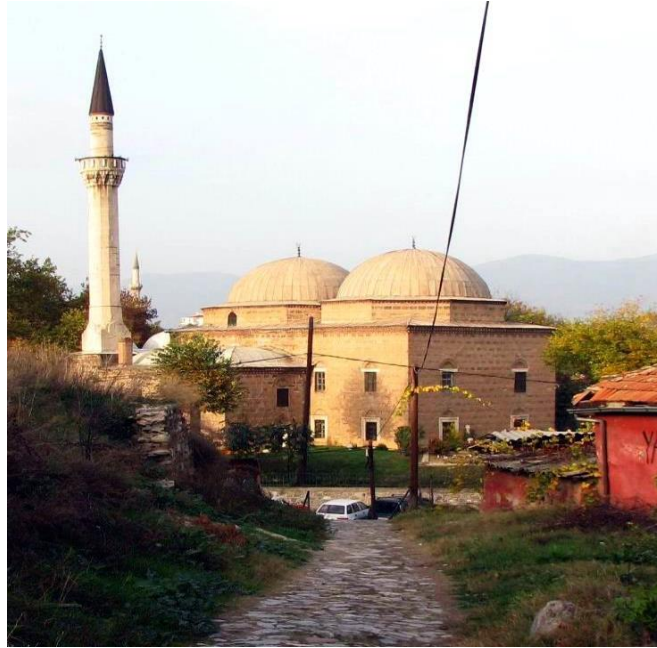
İsa Bey Camii-Üsküp