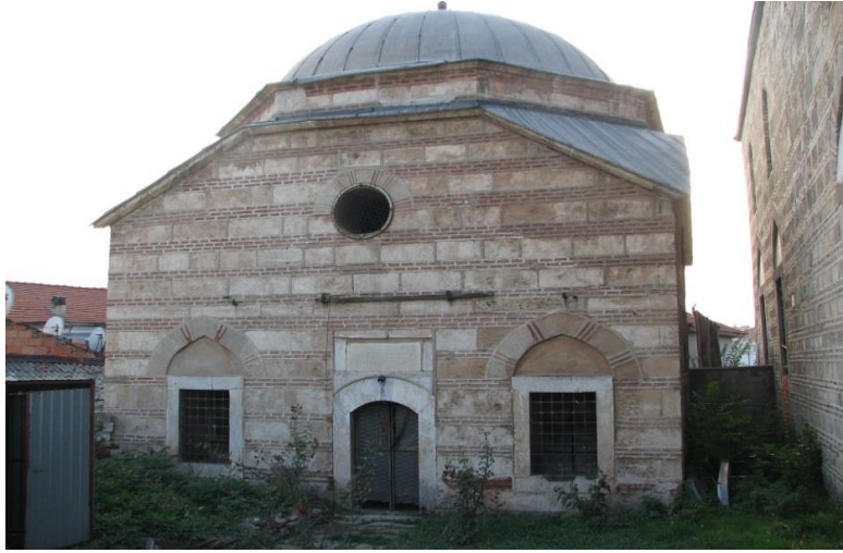
Beyhan Sultan Türbesi – Üsküb

Yeni Mektep, Sultan Murad Câmii’nin arkasında “ Beyan Baba Türbesi ”nin avlusundaydı. Beyan Baba Türbesi, İstanbul’da bile misli nâdir görülebilen harikulade asîl bir mimarî ile yapılmış bir türbedir. Üsküb’ün ve Filibe’nin mimarîde muasır olan Bursa devrinden bir eserdir. Pâdişâh hanedanına âit bir türbe olduğu, mermerlerin zenginliğinden ve duvarların metinliğinden derhal anlaşılır.