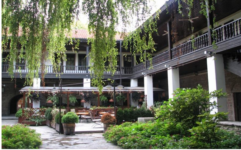
Üsküp’te Kapan Han