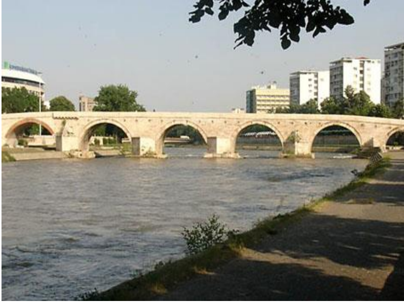
Üsküp'te Vardar Nehri ve Fatih Sultan Mehmed Köprüsü

Düşlerimin gerçek olduğu anı, Üsküp'le bulduğum, Vardar'a kavuştuğum ilk günü elbette unutamam.. Kimler gelmiş kimler geçmiş buralardan.. Persler, Makedonlar, Romalılar, Bizanslılar, Cermenler, Gotlar, Slav kavimleri ve Avarlar.. Aslında Türk kavimlerinden Hunlar, Avarlar, Oğuzlar, Kuman ve Peçenekler Osmanlı'nın bu topraklara gelişinden çok önce buralara gelmişler.. Evlâd-ı fâtihânın Rumeli ile buluşması tarihin seyrini de değiştirmiş buralarda.. Ve İstanbul henüz fethini beklerken, bir gün Gelibolu'da ayaklarını karaya basan Türk akıncıları, bir çılgın âşık gibi koşup kollarını boynuna dolayıvermişler Rumeli'nin.. Ve o nazlı vücûda saraylardan, hanlardan, camilerden, medreselerden, imaretlerden, köprülerden süslü elbiseler, göz alıcı kaftanlar giydiren Türk zevki, devletin ve milletin ortak gayretleriyle bu toprakları nasıl da bir açık hava müzesi haline getirmiş.. Kimi gelmiş, birer mızraklı efsane kahramanı gibi, şehirlerin ismetine nöbet tutan narin minareli camiler kurdurmuş, kimi gelmiş, garibi, konuğu, Tanrı misafiridir diye ağırlayan kervansaraylar yaptırmış bu topraklarda.