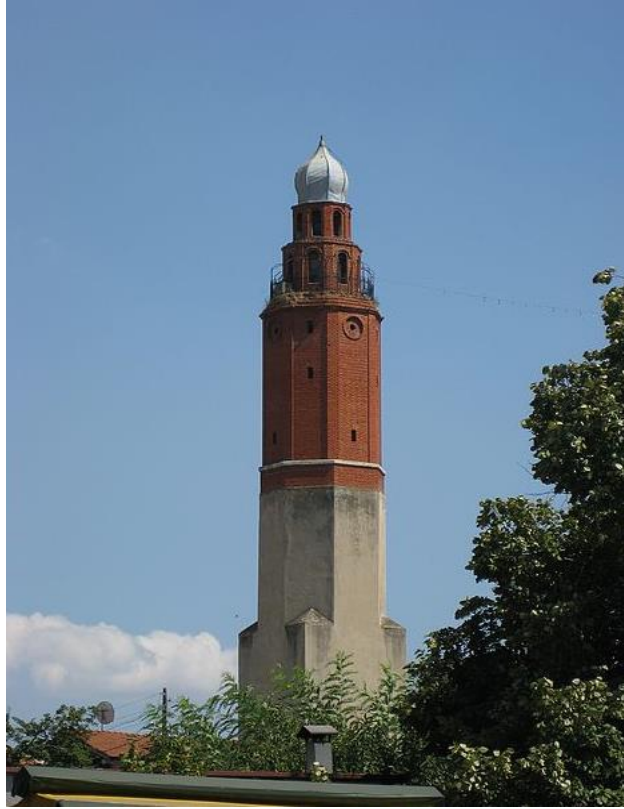
Üsküb'ün Meşhur Saat Kulesi

Evet ne hazindir ki bugün bizlere o “tek-tük” âbidelerle avunmak düştü. Beş küsur asır boyunca Üsküb'ü dünyanın en medeni, en mamur şehirlerinden biri haline getirenlerin buralardan ayrılma zamanı geldiğinde; “ Her kemâlin bir zevali vardır ” sözü, sığınacak, avunulacak tek tesellimiz oldu. Üsküb'te Osmanlı izlerinin silinmesine Vardar üzerinde tarihe tanıklık eden “Fatih Köprüsü”nün başında inşa edilmiş olan Burmalı Camiin sosyalist Yugoslavya zamanında ortadan kaldırılması ile başladı. Çünkü Sırp, 1389 tarihini hiç unutmadılar.