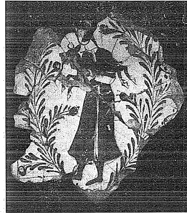
Resim 2. Kubâd-âbâd Sarayları çinilerinde av hayvanı taşıyan figür. (Konya Çini Eserler Müzesi)