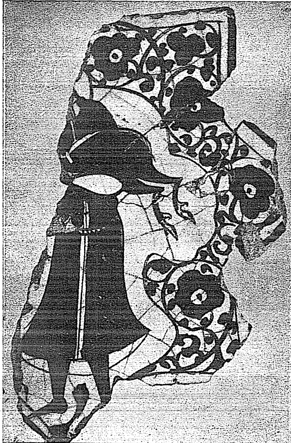
Resim 3. Kubâd-âbâd Sarayları çinilerinde başsız bir figür. (Konya Çini Eserler Müzesi)

2 — Birçok kırık parçaların yapıştırılmasıyla az-çok tamamlanabilmiş bu çini de yıldız şeklindedir. Figür olarak birinciye çok benzemektedir. Yalnız, figürün kucağında, hilâl biçiminde boynuzu olan, sevimli bir yaban keçisi