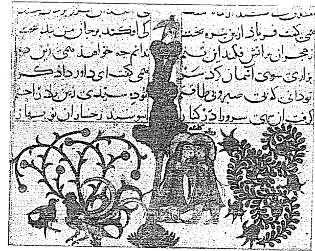
Resim 5. Varaka ve Gülşah mesnevisinden bir sayfa. Topkapı Sarayı Müzesi, Hazine Kt. No. 841, s. 33/b).

Selçuklu devri minyatürlerinde de kadın ve erkek tasvirleri biri diğeri-ne benzemekte, erkekler de kadınlar gibi sakalsız ve bıyıksız, üstelik her ikisi de saçlı olarak resmedilmektedir. Meselâ, Ayyukî'nin Gazneli Sultan