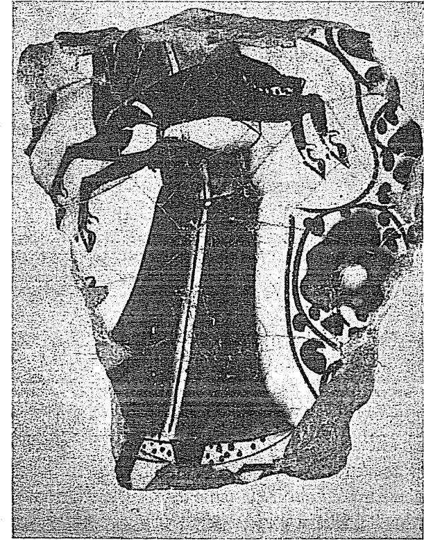
Resim 4. Kubâd-âbâd Sarayları çinilerinde başsız diğer bir figür. (Konya Çini Eserler Müzesi)

4 — Bu çini de yıldız şekilli çinilerden bir parçadır. Üzerindeki resim, üçüncü çinimizdeki figüre pek benzemektedir. Yalnız feracanın etek ucu iç kısmında benekli bir kumaş görülmektedir. (Resim: 4)