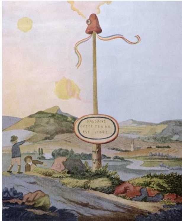
Resim 4: Goethe’nin çizdiği resme ithafen yapılan renklendirilmiş kartpostal (Goethe, Wanderers )

Koalisyon Savaşları boyunca ağaçlar Fransa’da varlığını sürdürse de kıtanın tamamında yaygınlaştığına dair bir genelleme yapılamaz. Nitekim Napolyon Bonapart ile başlayan süreçte Fransa’nın Avrupa kıtası üzerindeki hegemonyasında, hürriyet ağaçlarının arttığına dair bir kayda rastlanmamıştır. Çünkü Napolyon’un imparatorluk politikası, hürriyet ağacının