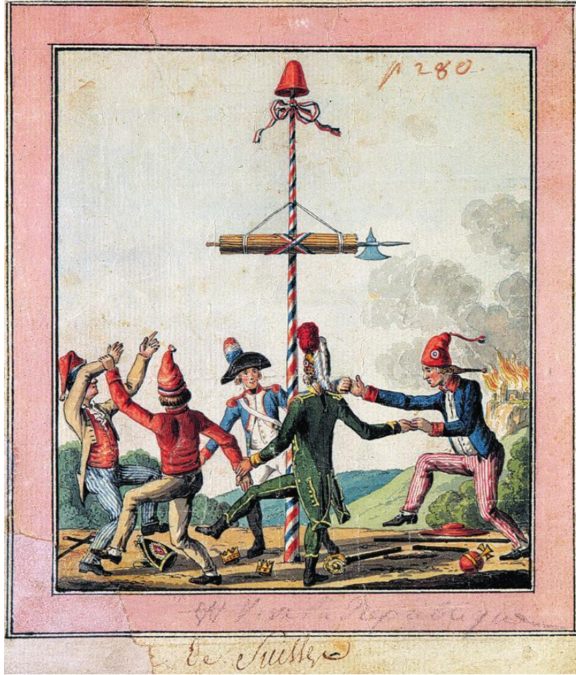
Resim 1: Hürriyet ağacının etrafında şarkı söyleyip dans edenler

Hürriyet ağaçları, mayıs ağacı kültürüyle birleşse de özünde hep gerçek ağaçlardan ilham almıştır. Şehir ve kasabaların meydanında, en görünür yerlerine canlı ağaç veya cansız bir direğin dikilmesiyle hürriyet ağacı sembolizmi gerçekleştirilmiştir. Dikilen bu ağaçların üzerine çeşitli kokartlar ve bayraklarla diğer ihtilal sembolleri asıldıktan sonra çevresinde Ça Ira , La Marseillaise gibi ihtilal şarkıları söylenerek törenler gerçekleştirilmekteydi. Bu makalenin temel meselesi Avrupa'da bu ağaç kültürünün nereden geldiği ve ihtilallerde nasıl bir rol oynadığı sorununa da derin bir analiz yapmaktır. Araştırmanın başlıca soruları şunlardır: Avrupa'da ağaç kültürünün geçmişi neydi? Amerika'daki özgürlük hareketinde bir ağaç kültürü nasıl oluştu? Fransa'ya bu kültür nasıl aktarıldı? 19. yüzyılın ortalarında tekrar bu kültürün ortaya çıkışının sebebi neydi? Bu makale, Avrupa lisanlarında pek değinilmemiş Türkçe kaynaklarda ise hiç zikredilmemiş bir olgunun hikayesini konu edinmiştir. Bir ağaç, devrimci ideallerle birlikte uzun ömürlülüğe ve doğallığa dayandırılarak bir dönemin siyasi fikirlerinde gerçekleştirilen şenliklerin sembolü olmuştur. Törenler, konuşmalar ve başka toplantılar bu ağacın altında yapılmıştır. Bu ağacın hikayesi nereden başlamıştı ve nerede son bulmuştu?