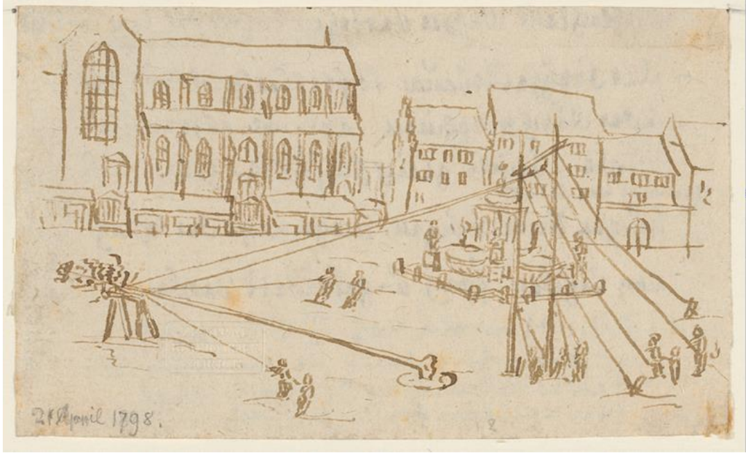
Resim 5: İsviçre’de Münsterhof Meydanı’na 1811’de yıkılan bir fiskiyenin yerine hürriyet ağacının dikilmesi