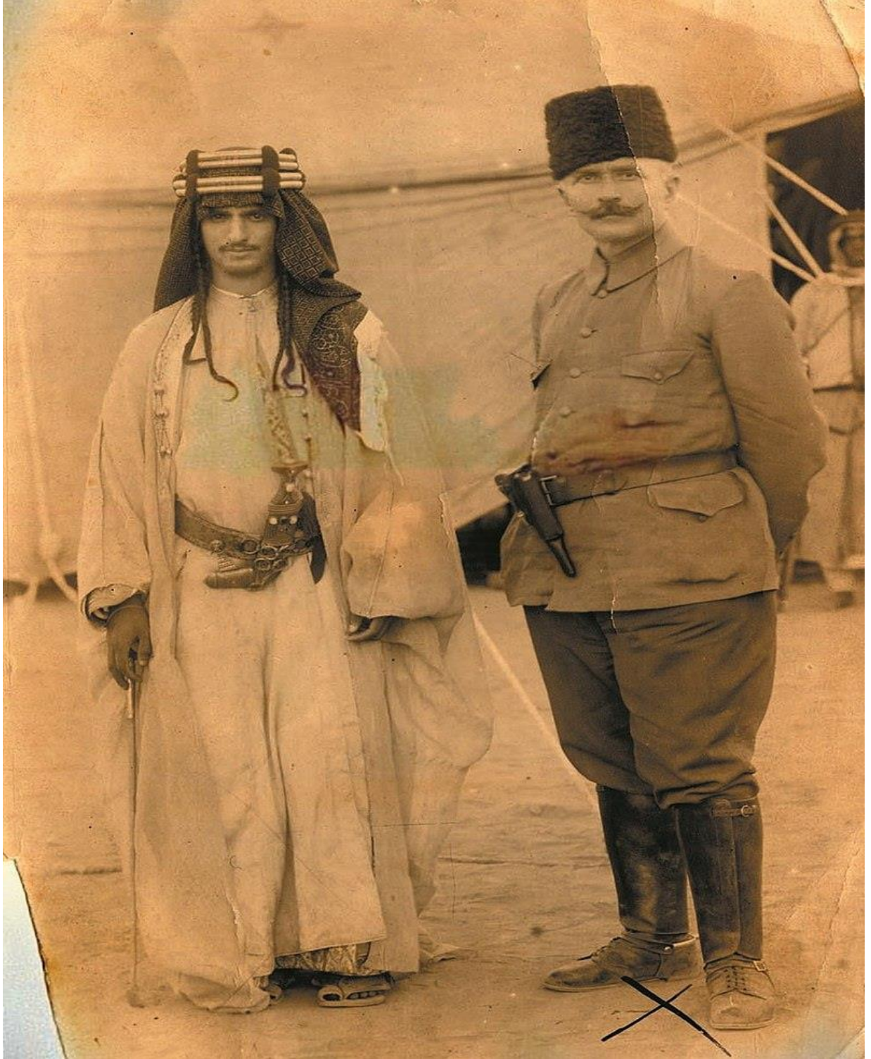
Ek-4: Cebeli Şamar Emiri Saud Bin Abdulaziz Reşid ve Fahrettin Paşa