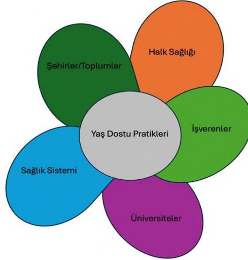
Şekil 1. Yaş Dostu Ekosistem

Yaş dostu yaklaşımına dair yapılan çalışmaların farklı disiplinlerden ve çok sayıda olması yeni bir yaklaşımın da ortaya çıkmasına neden olmuştur: Yaş Dostu Ekosistem (YDE). Yaş dostu ekosistem; halk sağlığı sistemleri, şehirler ve topluluklar, sağlık sistemleri, üniversiteler ve işverenlerden oluşmaktadır. Yaş dostu bir ekosistemin genel amacı, çeşitli sektörler arasında kolektif bir çaba sağlamak (Şekil 1) ve yaşlı yetişkinler için yaşam kalitesini iyileştirme nihai hedefini şekillendirebilecek paydaşları dahil etmektir (Fulmer vd. 2023).