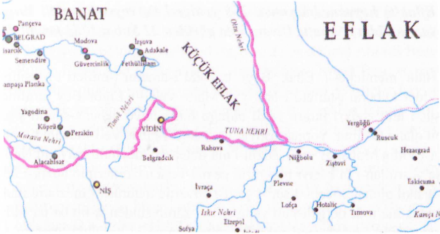
1718-1739 Sınır Değişikliğinde Tuna'nın İki Yakası