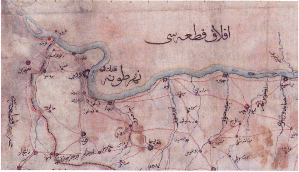
Eflak-Vidin Karşılığında Tuna'nın İki Yakası