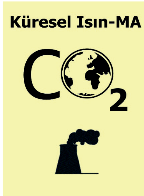
Şekil 3: K8 Tarafından Tasarlanan Afiş

K8 hazırladığı afişi (Şekil 3) şöyle açıklamıştır: 'Afişi hazırlamamdaki amaç, küresel ısınmanın dünyamıza olan etkisini açık bir şekilde anlatmaktır. Küresel ısınmanın oluşmasında rol oynayan zararlı gazların (CFC, CO 2 , Fabrika kökenli...) dünyamıza olan etkilerine dikkat çekmek istedim. Afişte kullandığım yazıyla kısa, öz ve ironik şekilde durumu izah etmeyi amaçladım. Afişte dünyanın konumu ortada olup çevresine ona zarar veren etmenlerden birini yerleştirerek durumu anlatmaya çalıştım. Sonuç olarak bu olumsuz durum karşısında insanları bilinçlendirmeyi ve tedbir almaları gerektiğini düşünüyorum.'