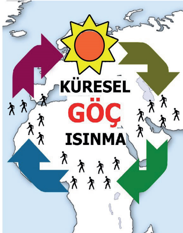
Şekil 4: K13 Tarafından Tasarlanan Afiş

Yine küresel ısınmanın sonuçlarına yönelik K13'ün tasarladığı afişin (Şekil 4) açıklaması şöyledir: 'Küresel ısınma, dünya genelinde iklim sistemlerinde önemli değişikliklere neden oluyor ve bu da birçok bölgede insanların yaşamını etkiliyor. Özellikle Güney Asya'da, artan sıcaklıklar, kuraklık, sel ve deniz seviyesinin yükselmesi gibi iklim değişiklikleri, insanların yaşamını zorlaştırıyor ve yerinden etmeye neden oluyor. Güney Asya'daki bu çevresel zorluklar, insanların yaşam alanlarını terk etmelerine ve göç etmelerine yol açıyor. Özellikle tarım ve su kaynakları üzerindeki baskılar, köylerden kentlere göçü hızlandırıyor. Aynı zamanda, iklim değişikliği nedeniyle artan doğal afetler de milyonlarca insanı evsiz bırakıyor ve göç etmeye zorluyor. Bu göç dalgaları, Anadolu ve Avrupa gibi daha kuzey bölgelere de yayılıyor. İklim değişikliğinin etkileriyle başa çıkmak için daha iyi yaşam koşulları arayan insanlar, Avrupa'nın sınırlarına doğru yol alıyorlar. Bu durum hem göçmenlerin hem de hedef ülkelerin ekonomisini, toplumsal yapısını ve politik dinamiklerini etkiliyor. Sonuç olarak, küresel ısınmanın etkisiyle Güney Asya'dan Anadolu'ya ve Avrupa'ya doğru artan bir göç trendi gözlenmektedir. Bu durum, bir takım sosyal, ekonomik ve politik sonuçlara neden olmaktadır. Bu sorunların çözümü için uluslararası iş birliği ve iklim değişikliği ile mücadele stratejilerinin etkin bir şekilde uygulanması önemlidir.'