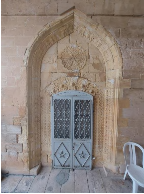
a- Eyvanın Batısındaki Oda Kapısı