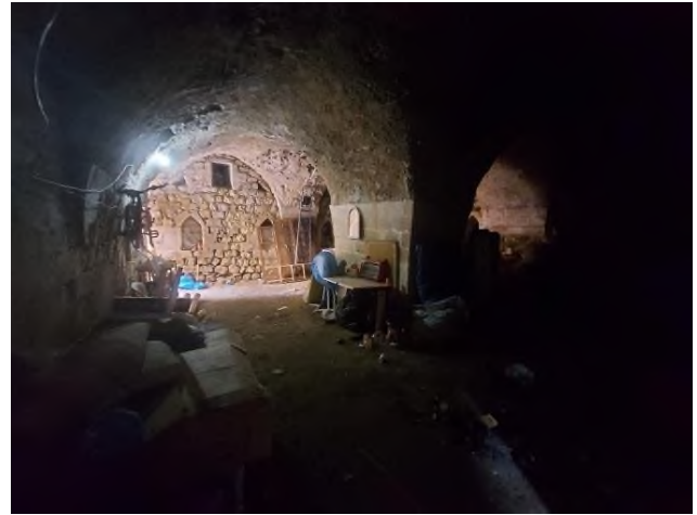
b- Genel Görünüm ve Nişler