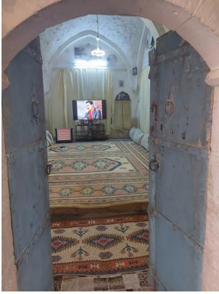
a- Odaya Girişini Sağlayan Kapı ve Kemer