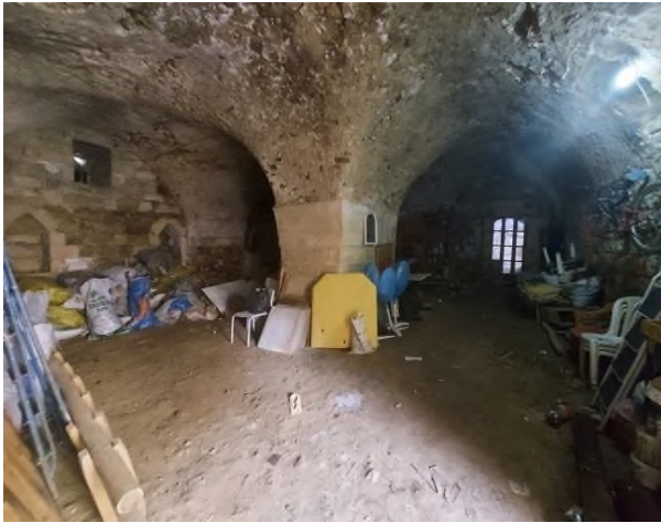
a- Beşik ve Çapraz Tonozların Düzeni

Konağın servis mekânları doğu-batı doğrultusunda uzanan avlunun etrafına yerleştirilmiştir. Avlunun doğusunda üst kata ulaşımı sağlayan merdivenler, onun hemen altında da ahıra (Ş.4) girişin sağlandığı basık kemerli kapı yer alır. Ahır oldukça büyük tasarlanmıştır. Ahırın ortasında yer alan ayak tonozları birbirine bağlamaktadır. Duvarlarda açılan nişlere ek olarak nişlerin üzerinde tavana yakın yerde mazgal pencereler yer alır. Ahırdan girişin sağlandığı daha küçük birim ise daha temiz günlük kullanım eşyaları ya da araç gereçlerin saklandığı depo vazifesi görür. Zemin katın kuzey doğusunda beşik tonozlu bir depo-kömürlük kısmı yer alır. Bu birim sadece kışlık yakacakların konduğu mekân olması itibariyle ahırdan farklı bir işleve sahiptir.