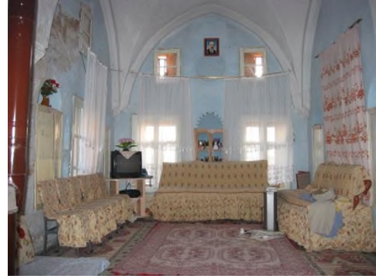
b- Odanın Görünümü