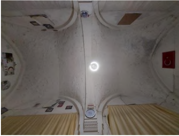
c- Çapraz Tonozlu Tavan Sistemi