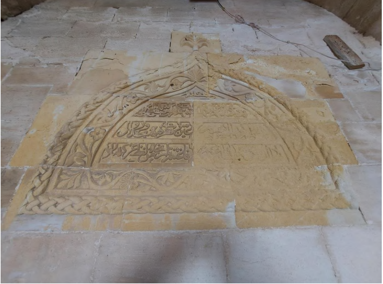
Şekil 2. Kitabenin Görünümü 2

Konağın üst kat eyvanının içindeki (Ş.2) tamir kitabesi 1290(H.)/1873-74 (M.) tarihlidir. Üç satırdan ve altı kartuştan oluşan Arapça kitabe celi sülüs hatla manzum olarak yazılmıştır. Kitabe kafes örgü motifi ile sınırlanmaktadır. Bu örgü ile yazı kuşağı arasında yer alan bordür kıvrık dallar, stilize çiçek motifleri ile müzeyyen olup belirli kısımlarında taşın yapısıyla alakalı olarak bozulmalar olduğu görülmektedir. Kitabenin tepelik kısmı ise palmet motifi ile sonlandırılmıştır.