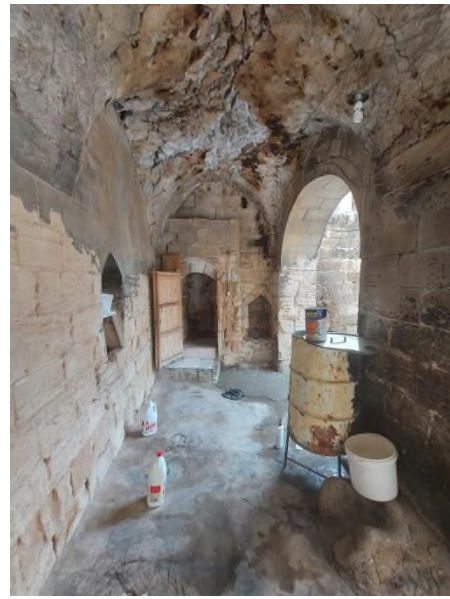
d- Güneydoğu köşedeki tuvalet