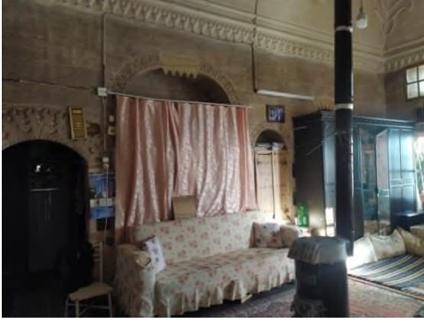
a- Başodanın Genel Görünümü

Ana eyvanın (§.11) batısında yer alan oda başodanın aksine doğu batı doğrultusunda uzanmaktadır. Bu odaya da kabaralarla bezenmiş basık kemerli bir kapı (§.15-a) vasıtası ile girilmektedir. Başodanın inşa ve süsleme anlayışına yakın tasarlanan bu odanın duvarlarına açılan nişler ve tavan süsleme detayları başodaya yaklaşmaktadır. Tekne tonozlu tavanın eteğinde ovaya bakan kuşluk pencereleri yer almaktadır.