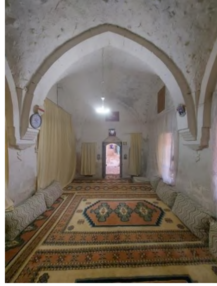
b- Odanın Genel Görünümü ve Kemerler