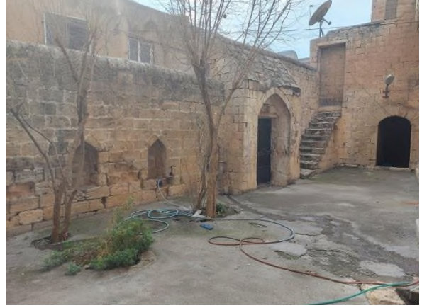
b- Avluya girişi sağlayan kapı