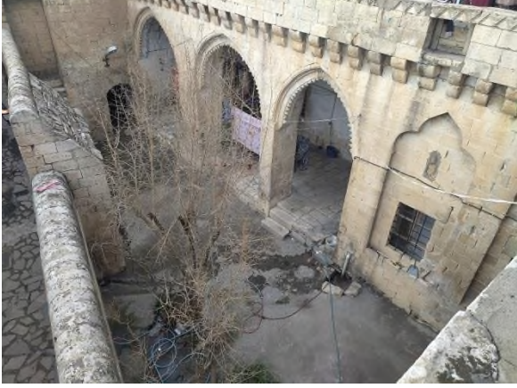
a- Doğu-batı yönünden görünüm

konağın hizmetinde çalışan görevliler için kullanılmıştır 4 . Konağın zemin katına giriş Destan 24. Sokaktan sağlanmaktadır. Konağın yüksek ve vurgulu giriş kapısı avluya doğru taşınmış, içeride sundurma şeklinde sonlandırılmıştır (Ş.3-b,c). Yüksek duvarlar ile sokaktan koparılan konağın avlusu asimetrikdir(Ş.3-a). Kalın avlu duvarları üzerinde açılan nişler (Ş.3-b), günlük kullanım eşyalarının konulduğu pratik birimler ve yemlikler halini almıştır.