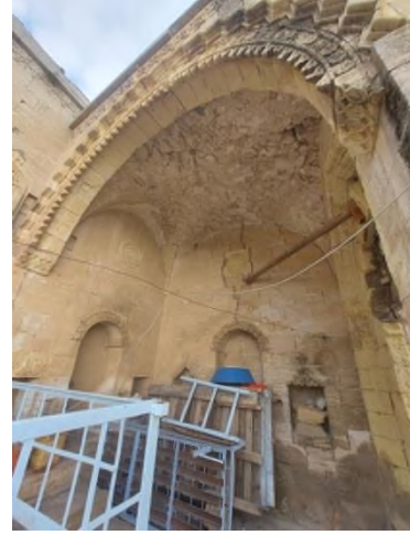
d- Doğu Yöndeki Eyvan