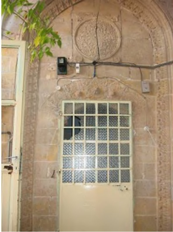
a- Odaya Girişi Sağlayan Kapı Düzeni