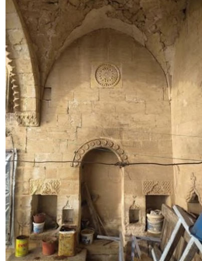
f- Doğu Eyvanın Kuzey Cephesi