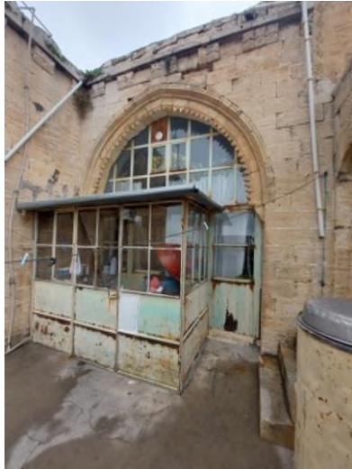
e- Batı Yöndeki Eyvan