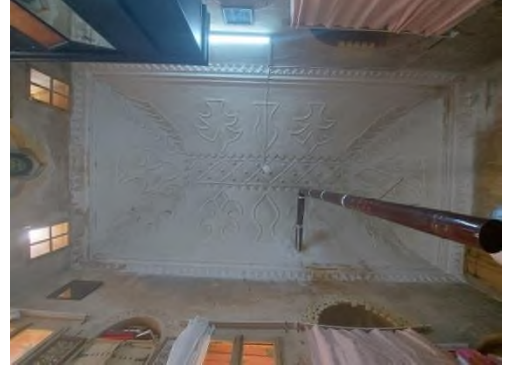
b- Başoda Tavanı