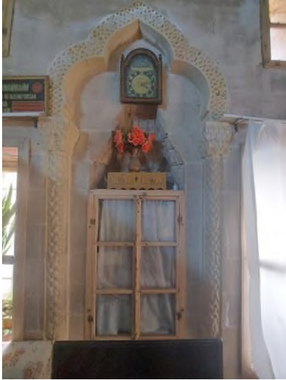
c- Başoda Mihrabiye Formlu Niş