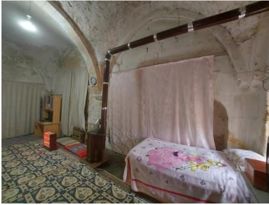
c- Odanın Cephelerinde Yer Alan Nişler