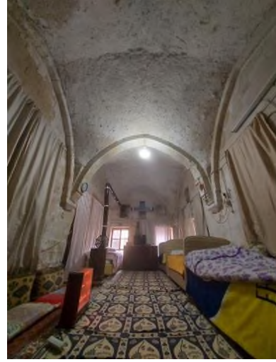
b- Odanın Genel Görünümü