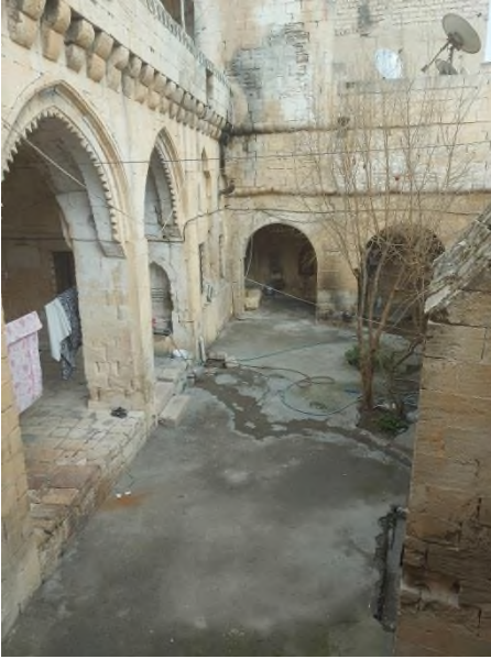
c- Batı-doğu yönünden görünüm