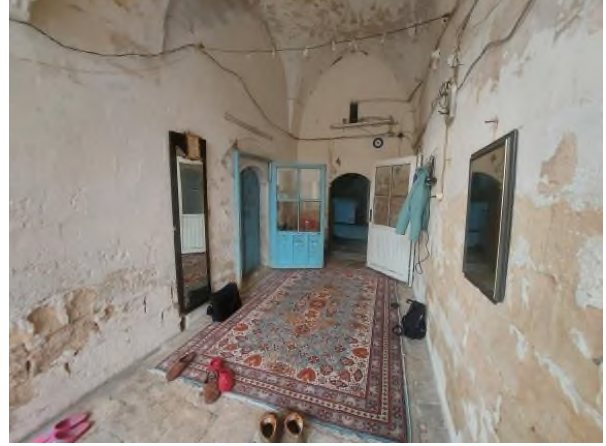
b- Zemin Kat Eyvanının İçi ve Oda Bağlantıları