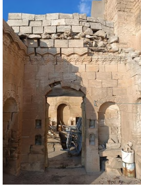
b- Odanın Günümüzdeki Durumu