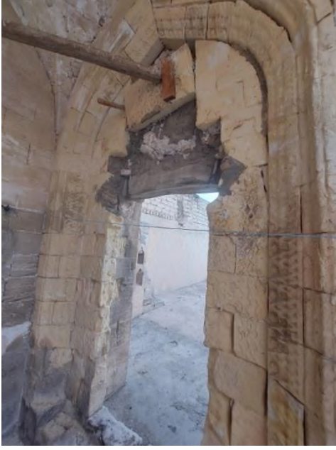
a- Eyvandan Odaya Girişi Sağlayan Kapı