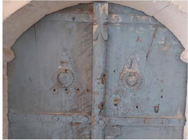
d- Geleneksel Kapı ve Kapı Tokmakları