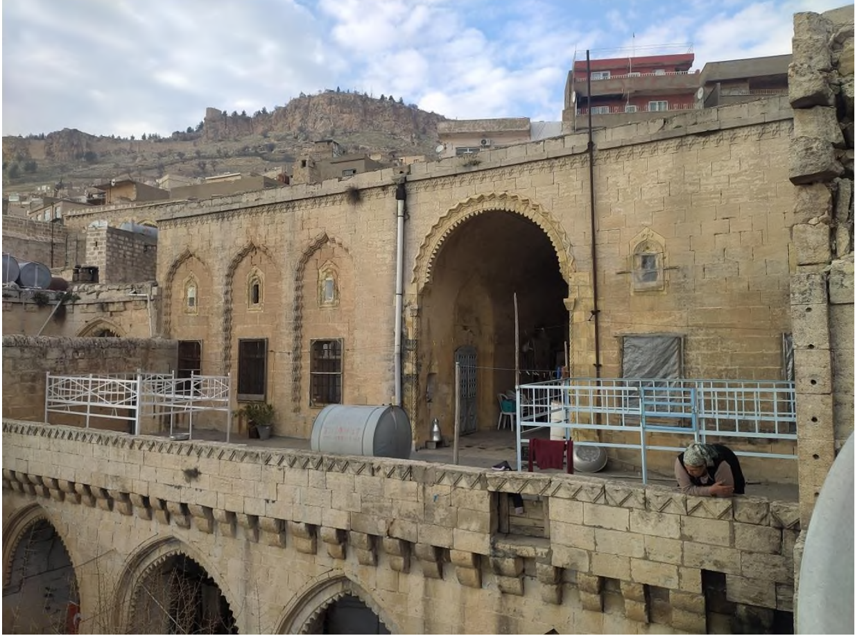
Şekil 11. Üst Kat Genel Görünümü ve Ana Eyvan

Konağın asıl yaşam alanı olan bu kat oldukça geniş tasarlanmıştır. Destan Sokak üzerinden iki farklı kapı ile konağa giriş (Ş.12) sağlanabilmektedir 6 . Kesme taş malzeme hâkim inşa ögesidir. Tonoz, avlu duvarı gibi bölümlerde yer yer moloz taş kullanımı da görülür. Düz damlı olan üst kat hem oturma alanı hem mekân (oda, eyvan, servis mekânları) sayısı hem de süsleme açısından zemin kattan daha detaylı düşünülp tasarlanmıştır.