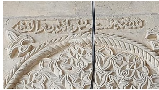
c- Girişin Üstündeki Tarih Kitabesi