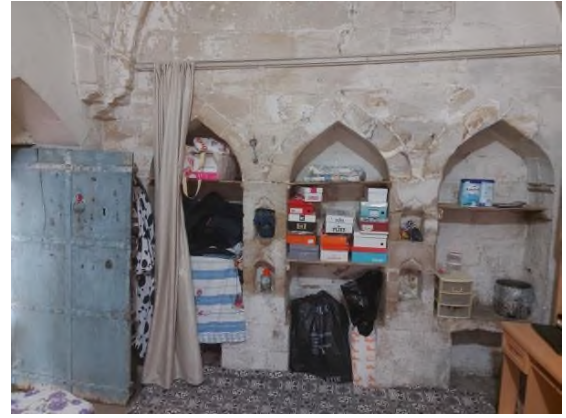
d- Sivri Kemerli Niş Formları