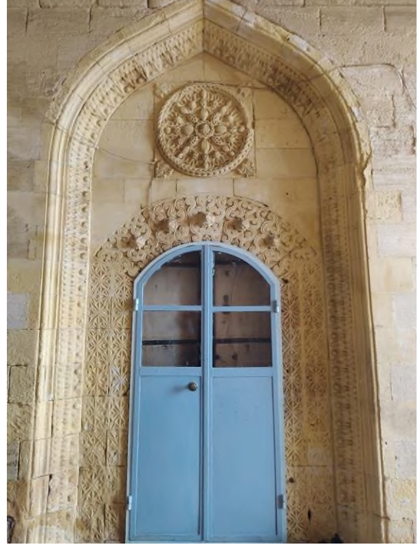
b- Eyvanın Doğusundaki Başoda Kapısı