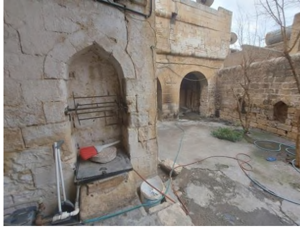
Şekil 10. Su Kuyusu

Konağın su ihtiyacı eyvanın girişinde yer alan su kuyusu (§.10) ile sağlanmaktadır. Sivri kemer formu bir niş ile teşkilatlandırılan su kuyusunun yüksek bir ağızlığı ile su çekmek için kullanılan demir makarası vardır. Günümüzde konağın banyosu (§.8-b) mutfak olarak kullanılan mekânın içinde ayrı bir birim olarak sonradan tasarlanmıştır. Tuvalet konutun dışında avlunun güneydoğusunda yer almaktadır 5 .