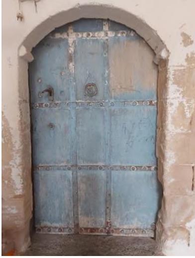
a- Oda Kapısı

Konağın zemin katında iki oda yer almaktadır. Biri doğu-batı diğer kuzey-güney yönünde uzanan odalara giriş eyvandan sağlanmaktadır. Kuzey-güney doğrultusunda uzanan oda (Ş.6-b) dikdörtgen planlıdır. Basık kemerli bir kapı ile girişin sağlandığı (Ş.6-a) iki çapraz tonozla örtülüdür. Oda kapısı tek kanatlıdır. Odanın tüm yönlerinde yer alan çeşitli boyut ve genişlikteki nişler (Ş.6-c,d) hem cepheleri hareketlendirmekte hem de günlük kullanım eşyaları için alan açmaktadır. Kemer üzengi taşları palmet motifi ile sonlanmaktadır. Genel anlamda sade tutulan bu odanın güneyinde cephenin tam ortasında daha derin ve bir niş (Ş.6-b) yer alır.