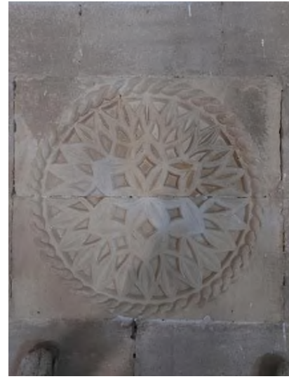
d- Başoda Kuzey Duvarındaki Pano