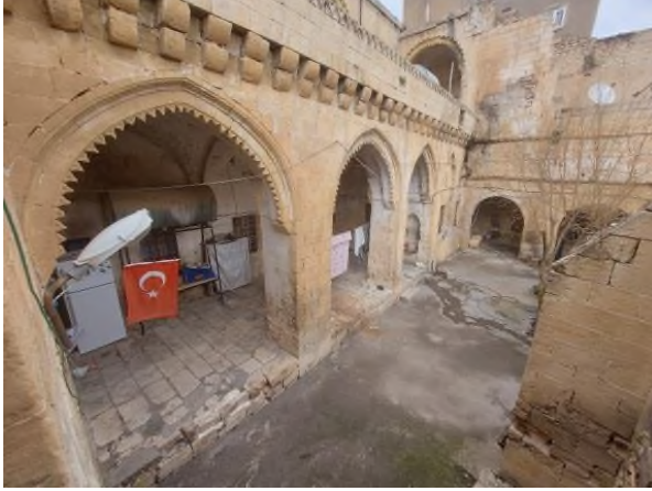
a- Zemin Kat Revak Düzeni

Mardin evlerinin en önemli unsurlarından olan açık ve yarı açık mekânlar sıcak iklim bölgeleri için vazgeçilmezdir. Akikol konağının zemin katı avlu, eyvan ve revak etrafında şekillenen plân kurgusuna sahiptir. Konakta eyvan (§.9-b/§.3-a); kış ayları için kuruluk, yaz ayları içinse gölgelik olarak kullanılmış, aynı zamanda da odalara bağlantının sağlandığı bir ortak mekân olarak tasarlanmıştır. Kalın ayaklar üzerinde birbirine sivri kemerle bağlanan üç gözlü revak ise (§.9-a) hem avlu-eyvan bağlantısını sağlamakta hem de iklime karşı korunaklı bir birim meydana getirmektedir. Revakların üzerinde üst kat çıkmasını taşıyan kademeli taş konsollar yer alır. Diğer bir revak ise avlunun doğusunda (§.9-a/§.3-d) yer almaktadır. Kalın bir ayakla birbirine bağlanan yarım daire formu kemerler kuzeydeki kömürlük-depo ile güney istikametteki (§.3-d) tuvaleti birbirine bağlamaktadır. Revakın içinde sivri kemer formu iki adet niş yer alır. Revaklar çapraz tonozla örtülüdür. Üst kat için taşıyıcı vazifesi gören revaklar zemin kat içinde bir sundurma ve muhafazalık görevi üstlenmektedir.