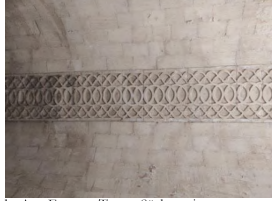
b- Ana Eyvanın Tonoz Süslemesi