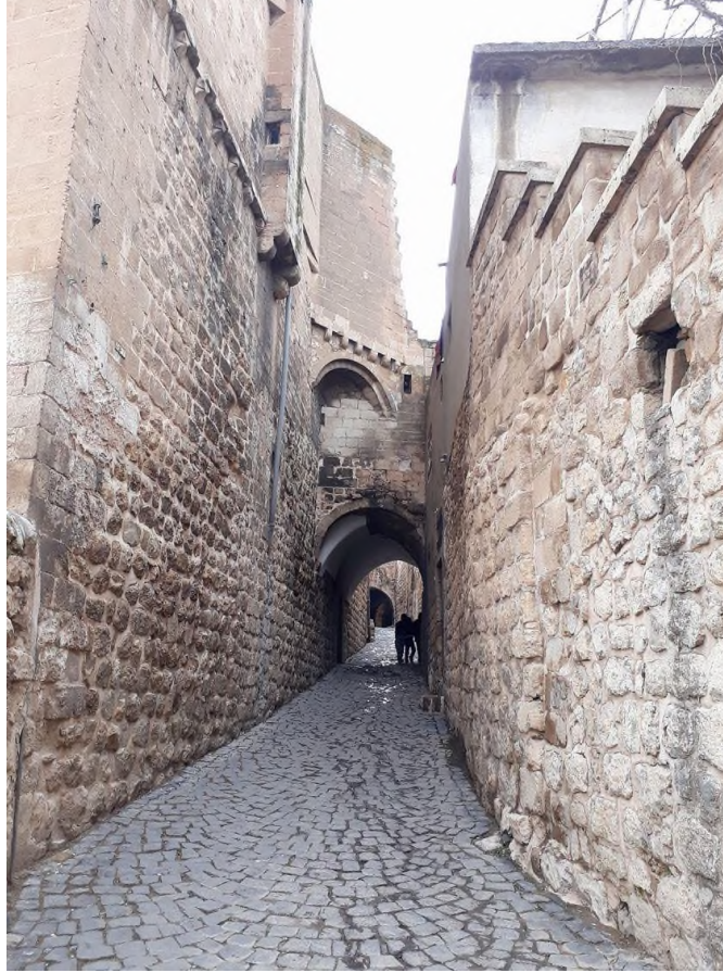
Şekil 1. Mardin Sokak Dokusu ve Abbaralar