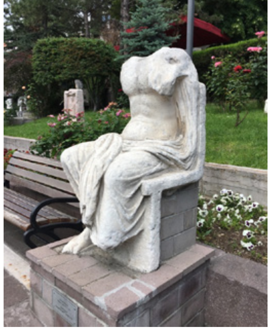
F.2- Heykel'in F. 6'ya benzer açıdan görünümü (Sedat Bornovalı)

Eser günümüzde AAMM bahçesine ziyaretçi kapısından girildiğinde ortadaki yolun üzerinde sol tarafta, açık havada ve dinlenme banklarıyla aynı sırada ancak elli santim kadar yükseklikteki bir çağdaş kaidenin üzerinde, ziyaretçiyle doğrudan iç içe şekilde teşhir edilmektedir.