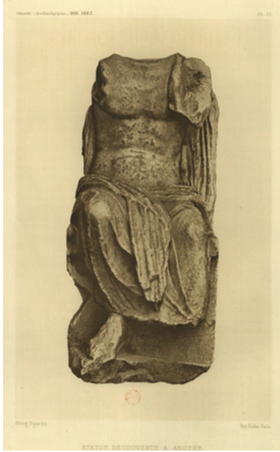
F.5- AAMM 9041 No’lu Heykel, Jermakoff tarafından çekilen fotoğraf (Longpérier, 1881, Levha XIII)

1897 yılında ise, sonraları hayli ünlü olacak bir genç mimar, Giulio Mongeri (İstanbul, 1873 - Venedik, 1951) Ankara seyahatinde bu eserle karşılaşacaktır. Kendisine Vali’nin yaveri tarafından tahsis edilen eşlikçinin görmesini önerdiği Heykel için Vali’nin konağına ziyarette bulunan Mongeri ayrıca eseri fotoğraflama fırsatı da bulacaktır (F.6). 4 Heykel’in Vali’nin konağında bulunuyor olması bu dönem içerisinde de ender rastlanır özelliğiyle ilgi çekişinin ve koruma altına alınma gerek-