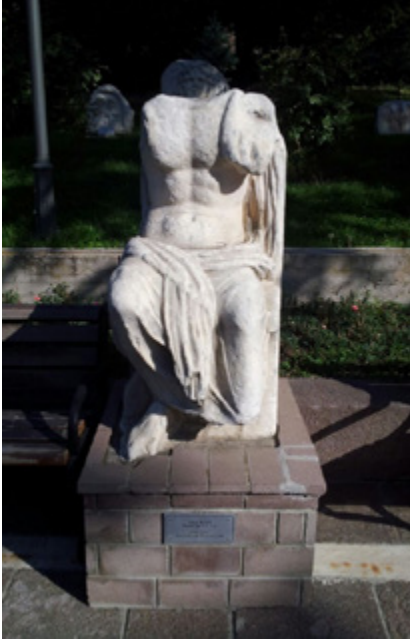
F.1- AAMM 9041 No'lu heykelin önden görünümü (Suat Tural)

Ankara Anadolu Medeniyetleri Müzesi'nde (AAMM) 9041 envanter numarası ile kayıtlı Roma imparatorluk dönemine ait olduğu anlaşılan ve Müzede yer alan açıklamaya göre M.S. 2. yüzyıla tarihlenen başsız, oturan erkek heykeli (Heykel) çeşitli kaynaklarda yayınlanmış ve tartışılmış olarak karşımıza çıkmaktadır. Bu çalışmada bir yandan Heykel'in kısaca tanıtımına yer verilirken diğer yandan da eserin hareketli geçmişinin izi sürülmeye çalışılacaktır.