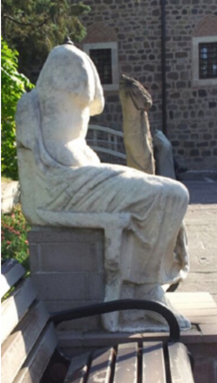
F.3- 9041 No'lu Heykel'in sağdan görünümü (Suat Tural)

AAMM'ndeki teşhirde de yükseltilmiş alt platformun üzerine Heykel'in alt tarafındaki boşluğu da ayrıca dolduracak şekilde duvar örgüsü kaide oluşturulmuştur. Heykel tarihi fotolarında da mutlaka çevresinden destek alır şekilde yer bulmuştur. Orijinal konumunda ise ne şekilde yerleştirilmiş olduğunun bilgisi bulunmamaktadır.