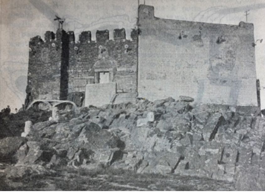
F.11- Akkale'nin 1933 yılı fotoğrafı (Mamboury, 1933)

Diğer yandan Akkale'nin yine Mamboury'nin kullandığı birkaç yıl sonraki bir fotoğrafına 19 bakıldığında alanda bir miktar düzenlemenin gerçekleştirildiği ve içeri erişimin daha kolay hale gelmesi için beton merdiven uygulaması yapıldığı görülebilmektedir (F.10). Bu düzenlemeler dışında farklılık arz etmeyen aynı kayalık alanda birçok aslan heykelinin bulunduğu, bunların Hacı Bayram'da teşhire indirilmediği, bilakis bazı diğerlerinin de getirildiği gözlemlenmektedir. Bu durum da yine 9041 numaralı heykele kentin bir parçası olarak gösterilen özel bir ilginin kanıtıdır.