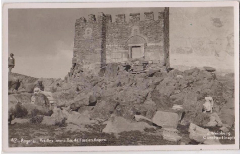
F.9- Akkale fotoğrafında AAMM 9041 No'lu Heykel (Cangır, 2007)

toğraflardaki zaman aralığı Ankara'da bulunuş tarihi konusunda yardımcı olabilecektir. Cangır resmin açıklama yazısında kaynak sunmaksızın tarihi 1926 olarak belirtmiştir. 16 Avni Lifij'in Ankara'da bulunduğu yılın 1923 oluşundan yola çıkarak Weinberg'in kartpostalının (F.9) 1921-23 yılları arasına tarihlenmesi önerilebilecektir.