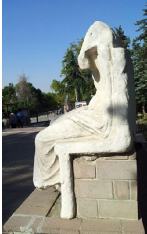
F.4- Heykel'in soldan görünümü (Suat Tural)