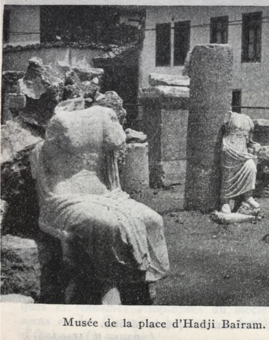
F.10- Sébah & Joailler fotoğrafında AAMM 9041 no'lu Heykel (Mamboury, 1933)

Bayram'da teşhiri kuşkusuz buraya doğrudan getirilen birçok diğer eserin aksine, Akkale'nin yetersiz olmasıyla gerekçelendirilemez. Heykel henüz açıklanamayan bir nedenle Akkale'den indirilmiştir ve Augustus Tapınağı'nda başladığı yolculuğuna, nihai konumu olan AAMM bahçesinden önce, Vali Konağı ve Akkale'nin ardından, ait olduğu tapınağa çok yakın bu noktada uzunca süre mola vermiştir.