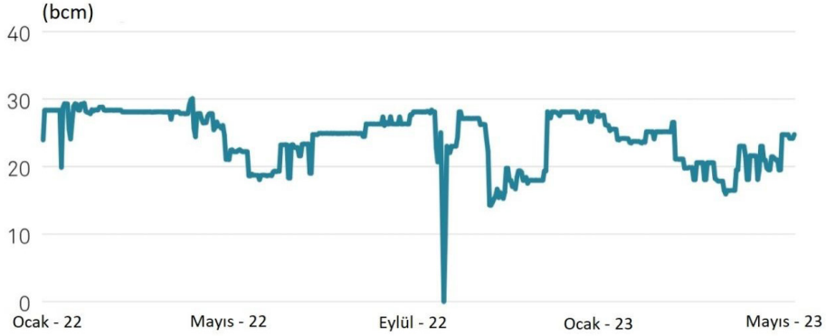
Şekil 2: Cezayir'in 2022-23 döneminde İspanya'ya (boru hatları) yoluyla doğalgaz ihracatı (S&P)