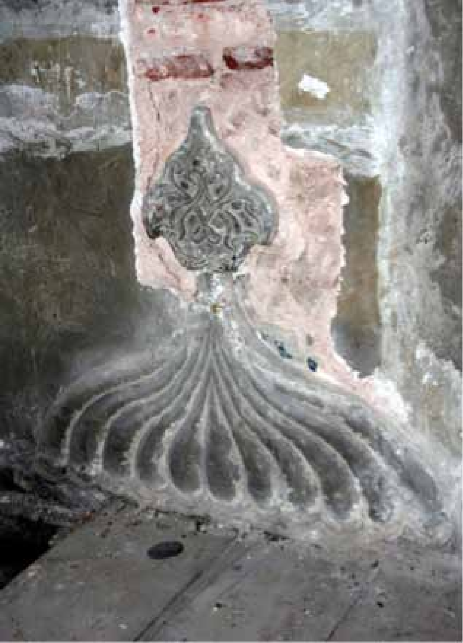
Resim 3. Çeşmenin palmetle taçlana tepelik bölümü ve kenarında çini izleri.