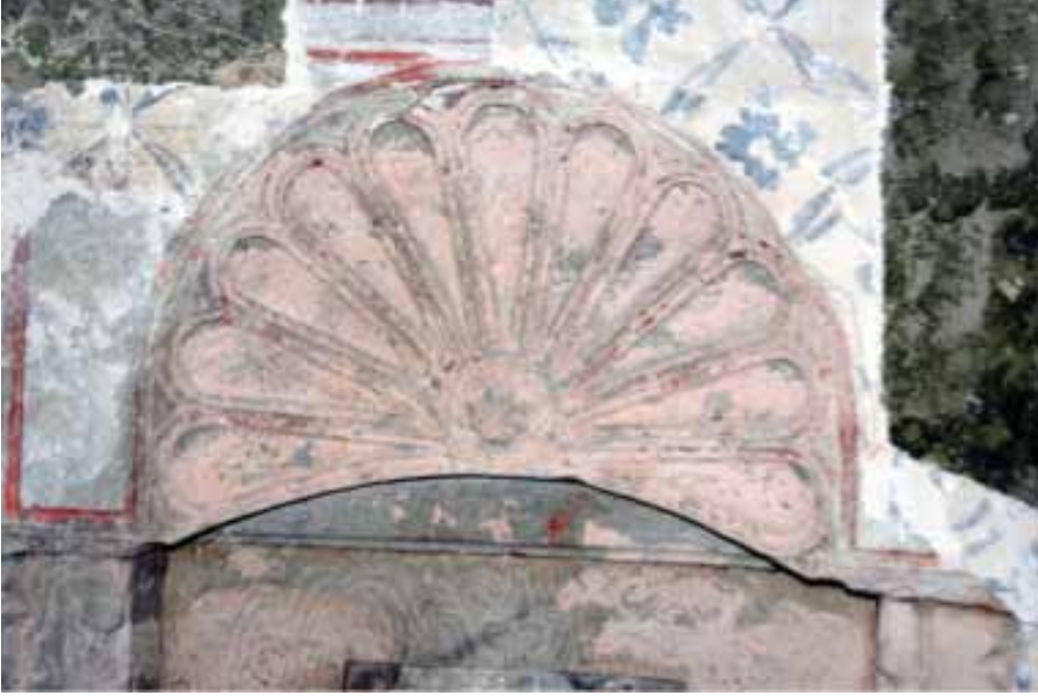
Resim 6. İstridye kabuğu biçiminde kemer kavsarası