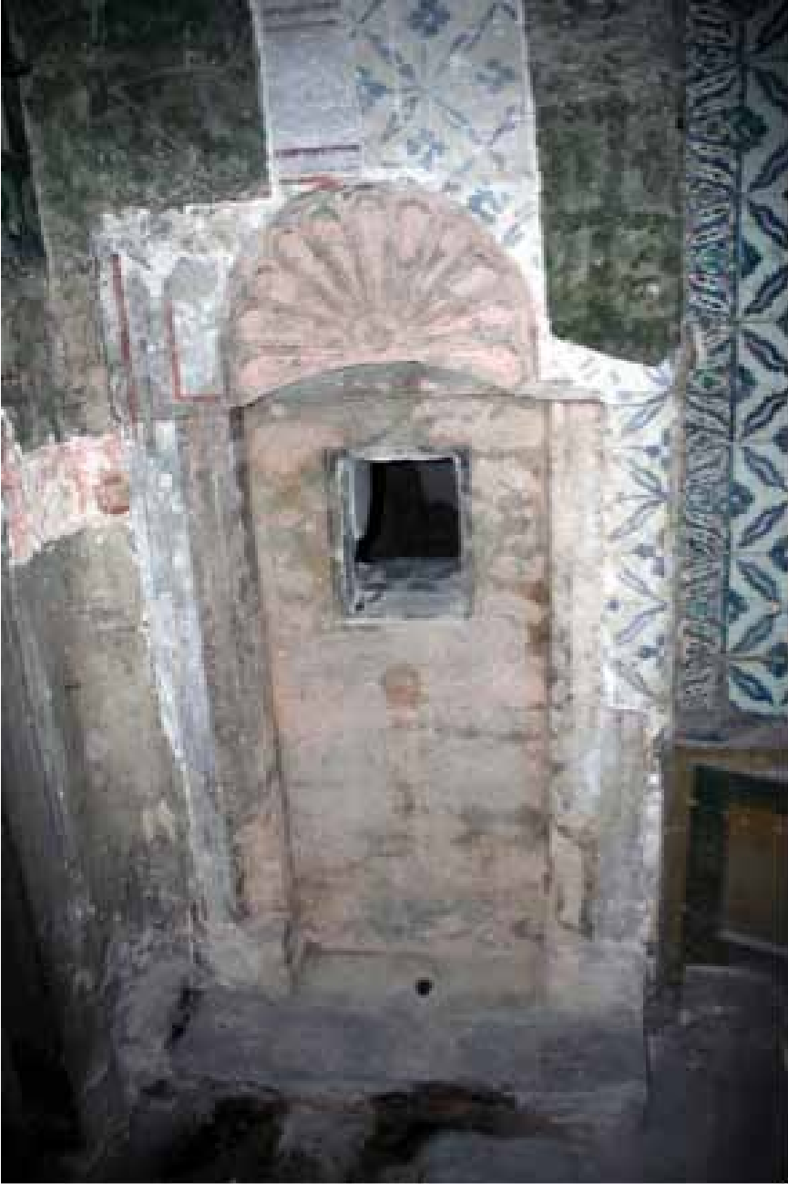
Resim 2. Hasekiler Dairesi'nin koridorunda sıva altından çıkarılan çeşme