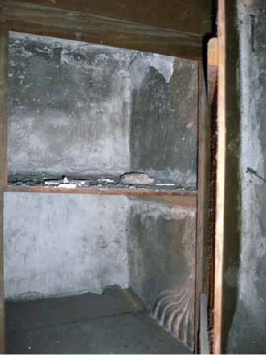
Resim 4. Şehzadeler odasına açılan şirvanda bir dolap içinde kalmış çeşmenin üst bölümü.