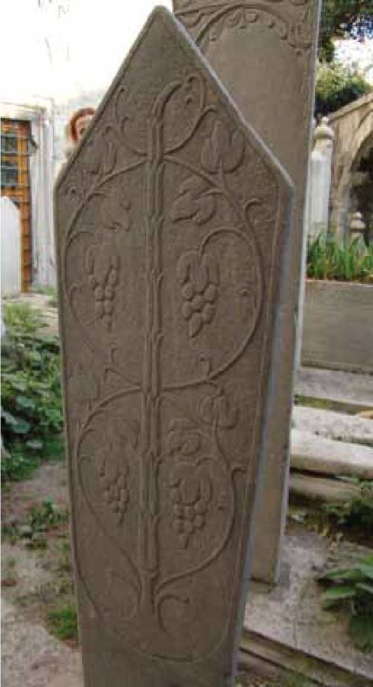
Resim 16. İstanbul, Çemberlitaş Atik Ali Camii Haziresi'nde ayak taşı. (Envanter no. 10)