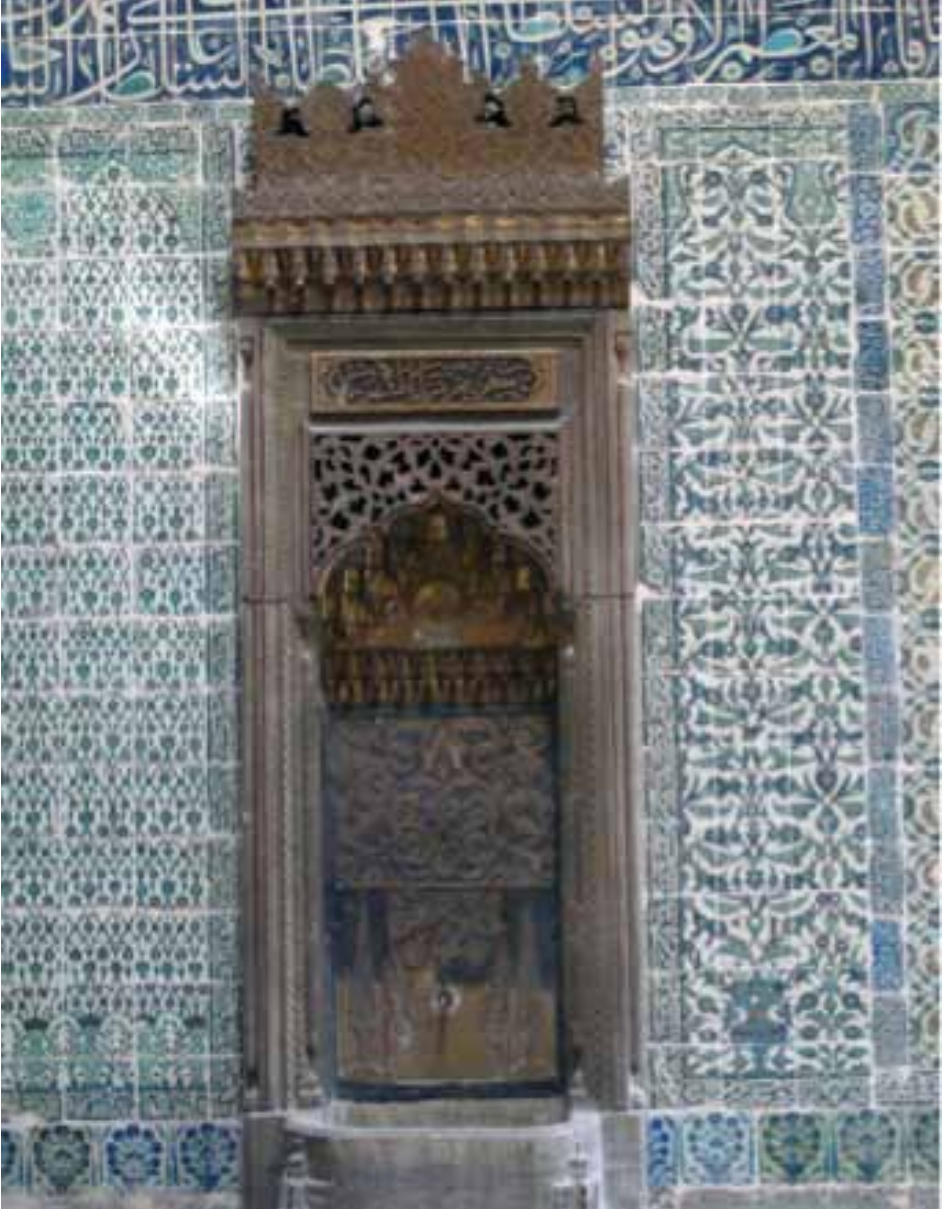
Resim 10. Topkapı Sarayı, Ocaklı Sofa'daki duvar çeşmesi