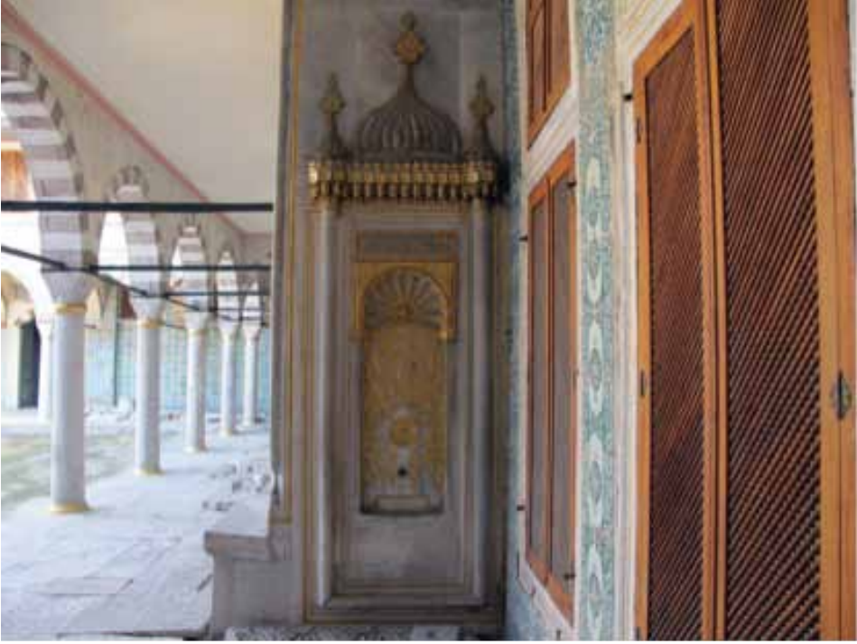
Resim 11. Topkapı Sarayı, Valide Taşlığı'nda duvar çeşmesi