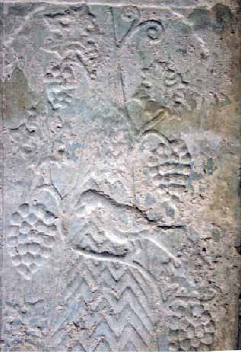
Resim 13. Üzüm yiyen kuşlardan detay