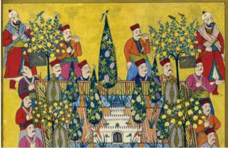
Resim 15. Surname-i Vehbi’de selvili bahçe düzenlemeleri, (Atıl, 1999)