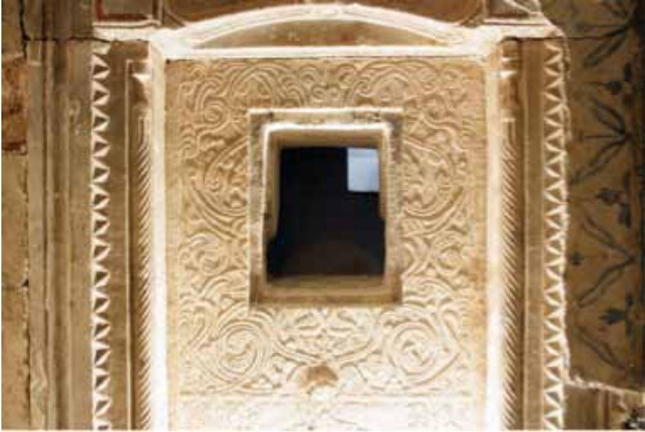
Resim 7. Ayna taşının üzerine açılan delik