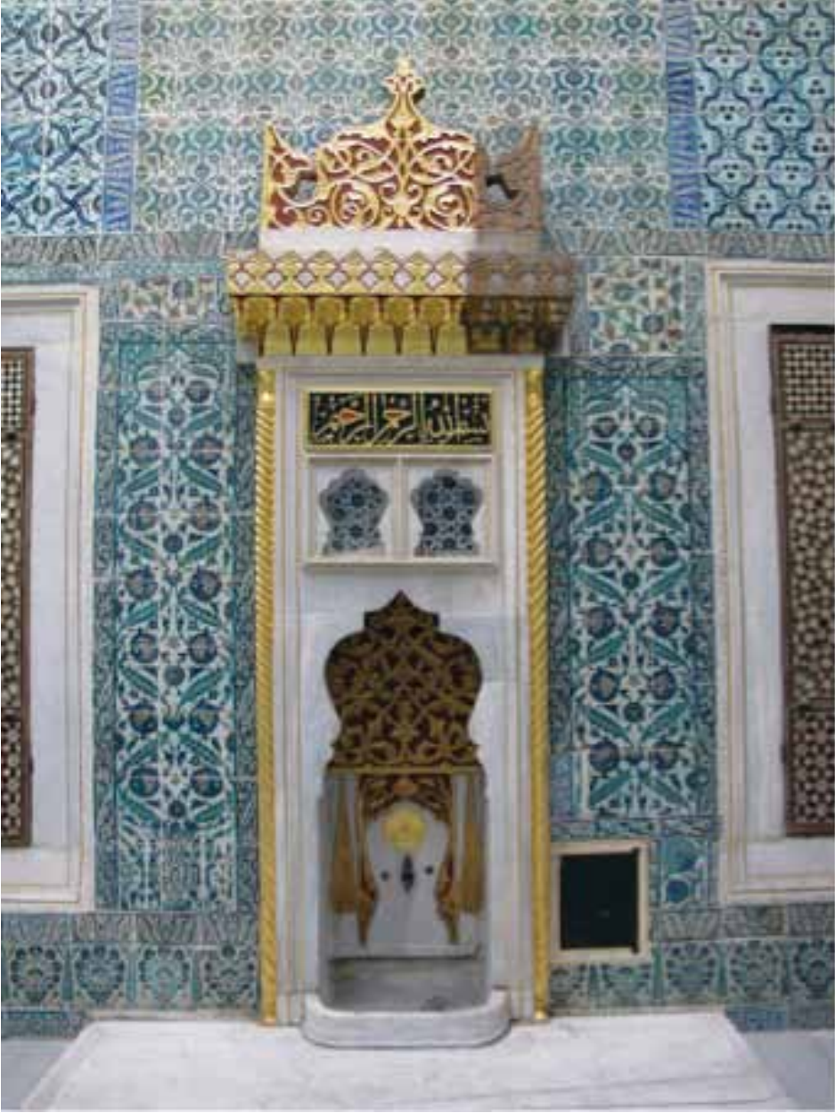
Resim 9. Topkapı Sarayı, Çeşmeli Sofa'daki duvar çeşmesi