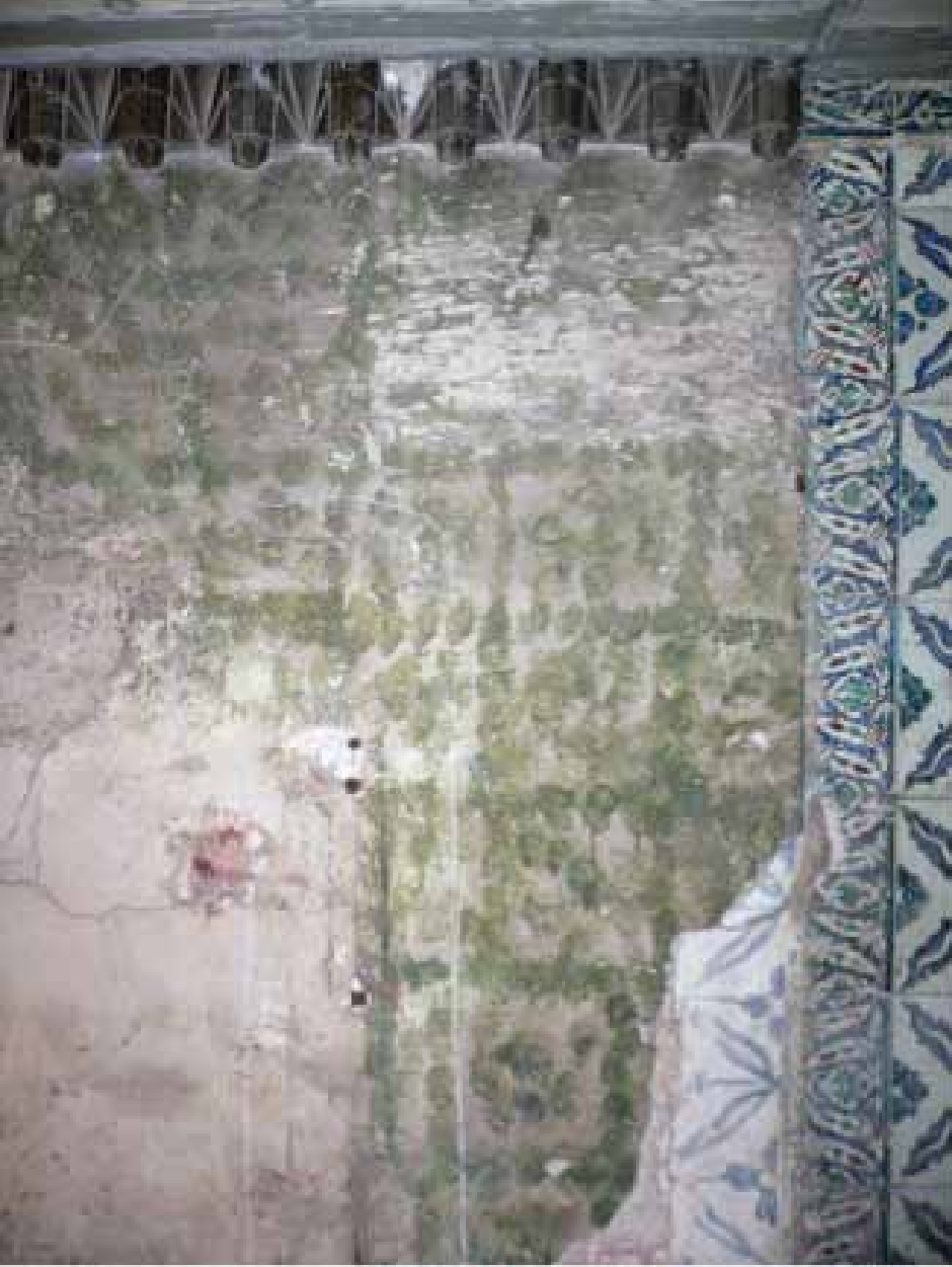
Resim 1. Hasekiler Dairesi Koridoru'nda çeşmenin sıva altındaki hali