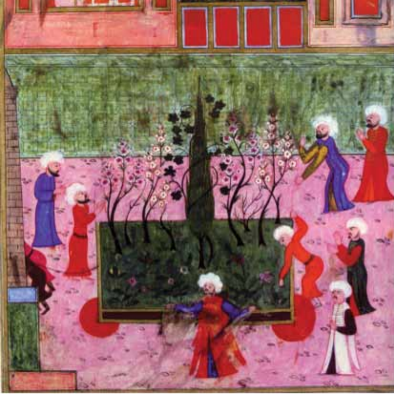
Resim 14. Surname-i Hümayun’nda selvi ağaçları, (Atasoy, 1997)