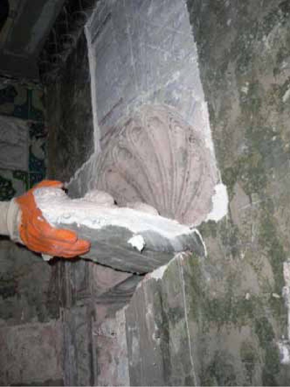
Resim 5. İstirdye kabuğu şeklinde süslemenin tuğla altından çıkarılması