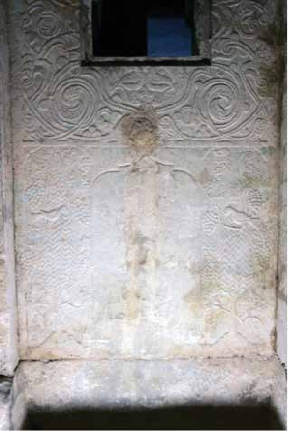
Resim 12. Ayna taşında selvi ağaçları, üzüm salkımları ve kuşlar