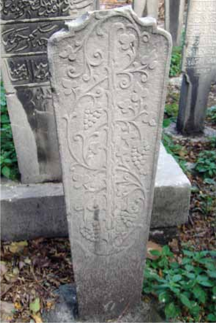
Resim 17. İstanbul, Çemberlitaş Atık Ali Camii Haziresi'nde ayak taşı. (Envanter no. 109)