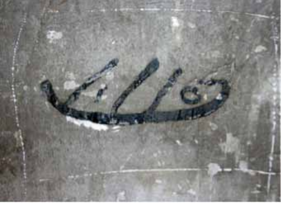
Resim 8. Mavi boyayla duvara yazılan tarih. H.115/M.1703-4