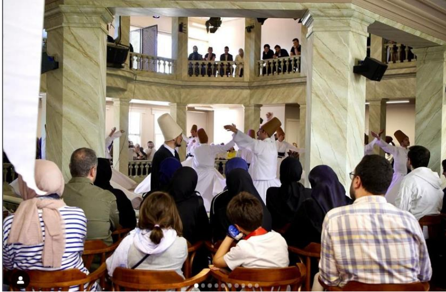
Şekil 8. İlk sema gösterisi (İnsan ve İrfan, 2024)