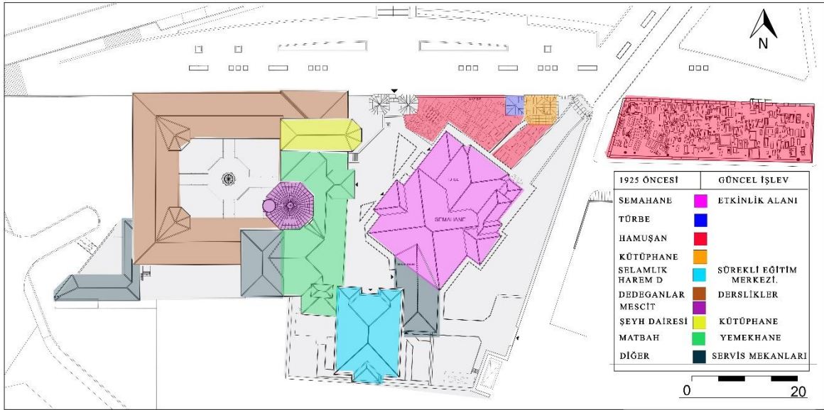
Şekil 4. Yenikapı Mevlevihanesi vaziyet planı üzerinde somut olmayan niteliklere ait eylemlerin olduğu mekânlar (İBŞB, 2016, Analiz çalışması Arapoğlu, 2024)

Murat Arapoğlu, "İstanbul Asitane Tipi Mevlevihanelerin Güncel İşlevlerinin Mevleviliğin Somut Olmayan Kültürel Niteliklerine Etkilerinin Değerlendirilmesi", ART/icle: Sanat ve Tasarım Dergisi , 4 (3), Aralık 2024, ss. 278-303.