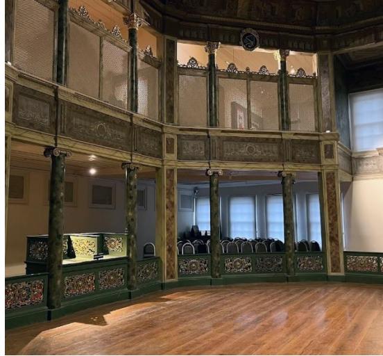
Şekil 2. Semahane ve mahfiller (Arapođlu, 2023)