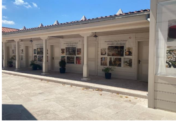
Şekil 12. Atölye olarak kullanılan dedegan hücresi (Arapođlu, 2024)