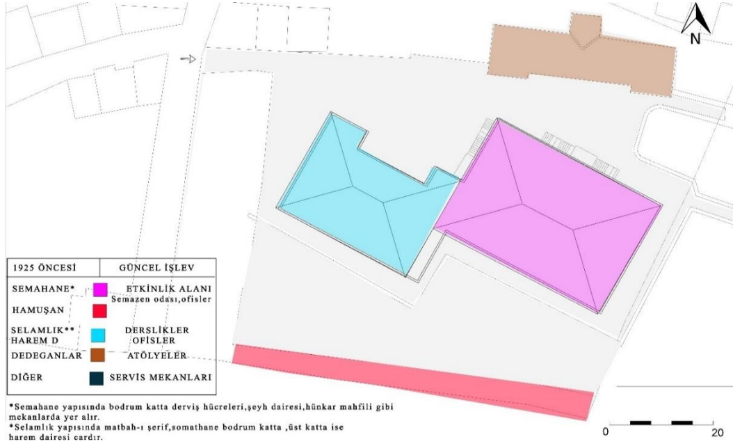
Şekil 7. Kasımpaşa Mevlevihanesi vaziyet planı üzerinde somut olmayan niteliklere ait eylemlerin olduğu mekânlar (İBŞB, 2022, Analiz çalışması Arapoğlu, 2024)