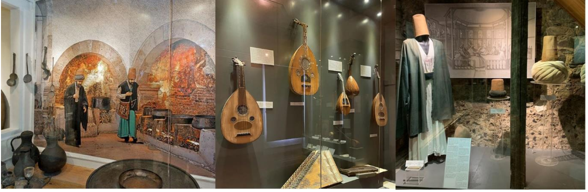
Şekil 3. Sergi mekânları (Arapođlu, 2023)

Yenikapı Mevlevihanesinde ilk olarak müze fonksiyonu ile kullanılmak için restorasyon çalışmalarına başlanmış fakat yapı günümüze kadar eğitim yapısı olarak çeşitli kurumlar bünyesinde faaliyet göstermiştir. Günümüzde üniversite tarafından Topkapı yerleşkesi içerisinde yer alan yapılardan biridir. Semahane belli zamanlarda sema töreni için kullanılan etkinlik mekânıdır. Türbe, hazire yerleri ve dedegan hücrelerine yakın mescit, muvakkithane ve kütüphane özgün işlevleriyle korunmuştur. Dedegan hücreleri üniversite bünyesinde farklı disiplinlerde eğitim veren fakülteler tarafından teorik dersler için sınıf olarak kullanılmaktadır. Şeyh dairesi olarak isimlendirilen harem yapısı Türk Hava Yolları Kütüphanesi olarak tahsis edilmiştir. Matbah-ı şerif yemekhaneye, şerbethane servis mekânları olarak düzenlenmiştir (Şekil 4, 5, 6).