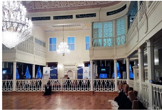
Şekil 11. Sema gösterisi (İSTEV, 2024)