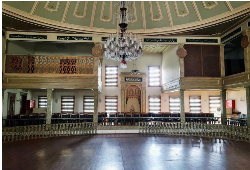
Şekil 5. Semahane (Arapoğlu, 2023)