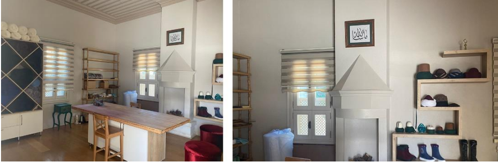
Şekil 9. Atölye olarak kullanılan dedegan hücresi (Arapođlu, 2024)

2011 senesinde restorasyon işlerinin bitiminden sonra Kültür ve Turizm Bakanlığı Vakıflar Genel Müdürlüğü Bahariye Mevlevihanesini İlim Sanat Tarih Edebiyat Vakfı, Girişimci İş Adamları Vakfı kurumlarına tahsis etmiştir. Ayda bir kez sema töreni ve mesnevi okunması yapılan semahane binası çeşitli etkinlikler içinde kullanılmaktadır. Selamlık binası Girişimci İş adamları Vakfı tarafından kullanılmaktadır. Semahanenin doğusunda yer alan harem yapısında eğitim ve toplantı fonksiyonlarıyla kullanılan odalar yer alır. Kuzeyde yer alan dedegan hücreleri geleneksel el sanatları eğitimlerinin verildiđi atölyeleri olarak düzenlenmiş matbah-ı şerif ile çilehane odaları servis işlevlerine uygun düzenlenmiştir, bu bölümün batısında yer alan cümle kapısına yakın mescit ibadethane olarak kullanılır. Haliç kıyısına bakan güneydeki alan seyir terası olarak düzenlenmiştir (Şekil 10, 11, 12).