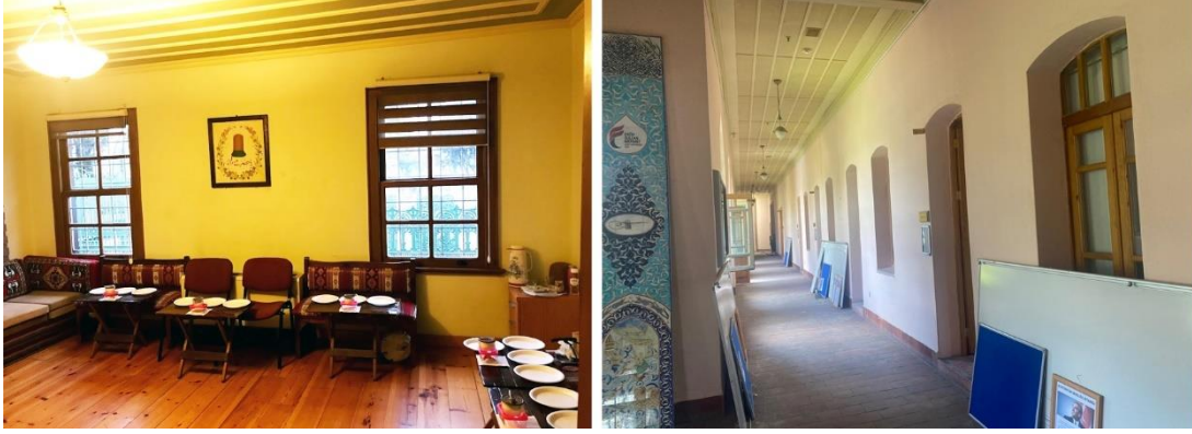
Şekil 6. Derslikler olarak kullanılan dedegan hücreleri ve koridor (Arapođlu, 2023)

2024 senesinde Kùltür ve Turizm Bakanlığı Vakfılar Genel Müdürlüğüne aslına uygun ihya edilen yapı İnsan ve İrfan Vakfının kullanımı için tahsis edilmiştir. Yaklaşık bir asır sonra ilk sema töreni semahanesinde icra edilmiştir. Yapının restorasyonu sırasında yan parsellerde olan mezar taşları toplanmış ve arazinin üst kotunda bulunan alanda bir hamuşan oluşturulmuştur. Sema törenin icra edildiđi yapının bir bölümünde semazenler odası tesis edilmiş, geri kalan bölümlerde odalar derslik ve ofis olarak düzenlenmiştir. Selamlık binasında bodrum katta teknik hacimler ve servis mekânları, diđer katlarda yer alan odalar sınıflar ve idari hizmetlere ayrılmıştır. Dedegan hücrelerinin olduđu yedi adet odalı bölüm günümüzde tarikat kùltüründe önemli yer tutan geleneksel el sanatların eğitime yönelik atölyeler olarak kullanılmaktadır (Şekil 7, 8, 9).