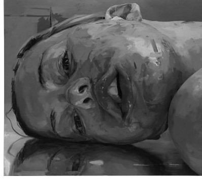
Jenny Saville, 2003, Tuval Üzerine Yağlıboya

Saville, resimlerinde daha çok kadın portreleri ve çıplak bedenlerini kullanarak klasik biçimde kadınların bir güzellik nesnesi olarak ele alınmasını eleştirir. Resimlerde açık renkler kullanmak yerine, daha çok renkleri karıştırarak boyayı yoğun, bir biçimde kullanır. Burada daha çok, hoş giden cezbeden klasik kadın beden anlayışının dışına çıkar. Sanatçı, şişman kadınlara resimlerinde yer vererek reddedilenin, aşağılananın üzerine giderek onu göstermeye ona yer vermeye çalışır. Şiddet üzerine ise bu resimde olduğu gibi yere düşmüş kadın yüzleri, bedenleri ile kadınların yaşadıklarına da tanıklık etmemizi ister. Oskay'ın da (1996, s.186) belirttiği gibi;