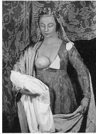
Ciny Sherman, İsimless, 1989, Renkli Fotoğraf, 170x142cm

Sherman'ın bu resmi, anne olma durumundaki kadını ele alır. Sanatçının çalışmalarında yapma biçimde meme kullanarak kadının memesinin çocuğunu doyurmaya yarayan bir biberon gibi eşyaya benzetilmesini eleştirdiğini görürüz. Fetişist bir davranış biçimi olan bu durum, kadının sadece organlardan ibaret bir varlık olarak görülmesine, düşünülmesine karşı gerçekleştirilmiş bir protestodur. Kadının, cinsiyle karşılıklı iletişime geçen, ruhsal, düşünsel bir cins olarak düşünülmesinin yerine, sadece görevlerini yerine getiren, hizmet eden ikinci bir cins olarak görülmesinin sonucudur.