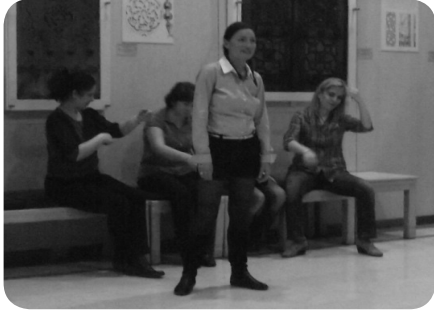
Ek 1: Etnografya müzesi'nden görüntüler