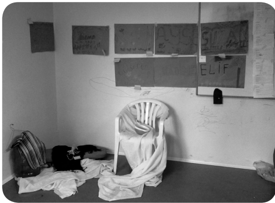
Ek 5: Müze deneme sergisinden görüntüler