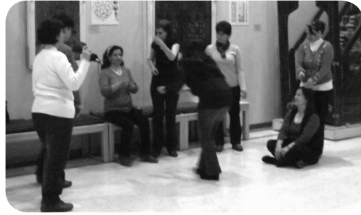
Ek 2: Eli işleyen, adı ve birçok rolü/maskesi olan kadına ait görüntüler