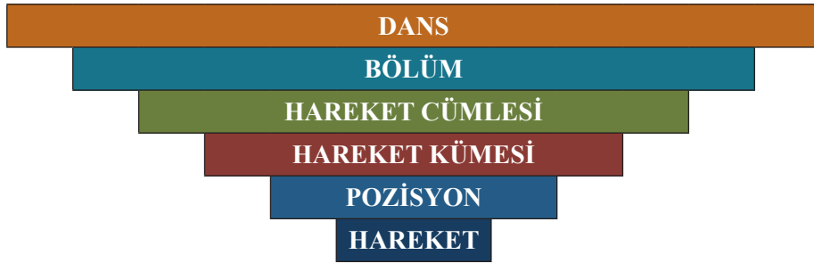
Şekil 1. HPNS'ye göre dansın yapısal unsurları

Gerek dansın/beden hareketinin yazıya geçirilebilmesini gerekse analiz edilebilmesini, dansın yapısal unsurlarına ayrılması sayesinde gerçekleştirir. HPNS'ye göre dansın yapısal unsurları -büyükten küçüğe-; bölüm, hareket cümlesi, hareket kümesi, pozisyon ve harekettir. Bu unsurlar birbirlerine ayrılmaz biçimde bağlıdırlar ve birbirlerini oluştururlar. En küçük yapısal unsur olan hareket, eklemlerde oluşan anatomik hareketlerdir ve bu anatomik hareketler "pozisyon"ları, pozisyonlar ve aralarında uygulanan geçişler "hareket kümeleri"ni, hareket kümeleri ve aralarındaki geçişler "hareket cümleleri"ni, hareket cümlelerinin birleşimleri ise dansın bölümlerini meydana getirirler. Diğer bir açıdan bakıldığında yapısal çözümlemesi yapılmış bir dans, yazılı bir kompozisyona benzetilebilir. Nasıl ki kâğıda çizilen çizgilerin anlamlı birleşimleri harfleri, harfler heceleri, heceler cümleleri, cümleler paragrafları ve paragraflar kompozisyonun tamamını oluşturursa, dansta da durum aynıdır.