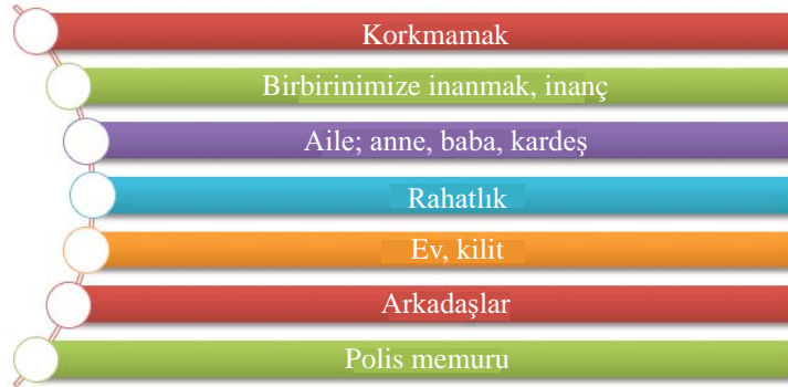
Şekil 3. Güven kavramına ilişkin öğrenci ifadeleri

Hem yaratıcılık süreci hem de yaratıcı drama öğrencilerin kendilerini özgür ve güvende hissetmelerine gereksinim duyar. Yaratıcı düşünme sürecinin spontan bir biçimde gerçekleşebilmesi ve yaratıcı drama etkinliklerinin başarıyla ilerleyebilmesi için olmazsa olmaz bir kavram olan güvene ilişkin öğrenciler öğrencilerin yanıtlarından alıntılanan ifadeler aşağıda sunulmuştur: