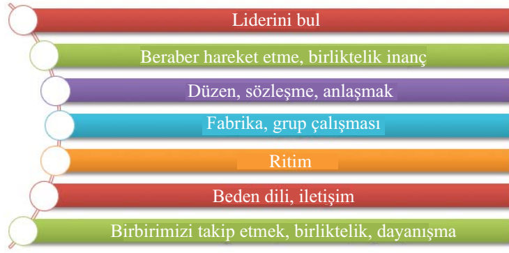
Şekil 2. Uyum kavramına ilişkin öğrenci ifadeleri