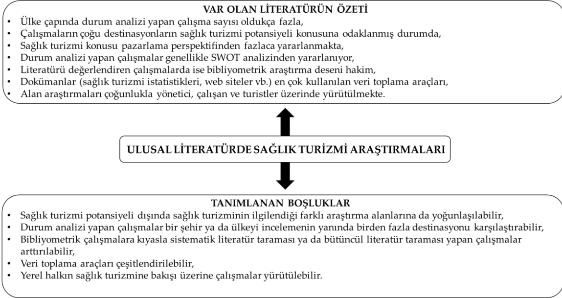
Şekil 2. Var Olan Literatürün Özeti ve Tanımlanan Boşluklar

Var olan literatür özetine bağlı olarak aşağıdaki boşluklar tanımlanmış ve gelecek araştırmalar için öneriler geliştirilmiştir. Buna göre;