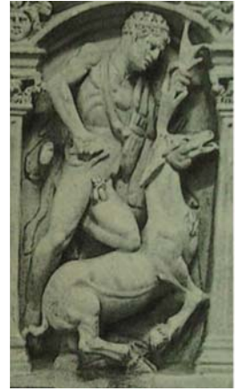
Res. 11 Roma