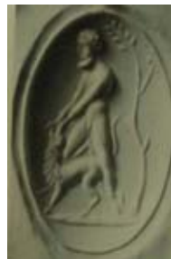
Res. 21 Sardon