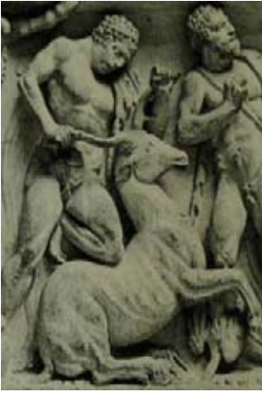
Res. 8 Florence