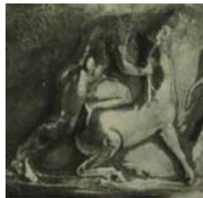
Res. 17 Pompei