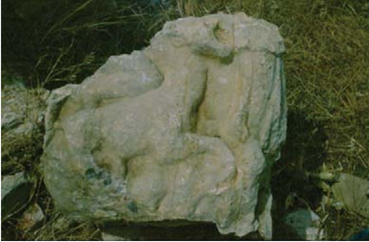
Res. 2 Avşar Fragmanı