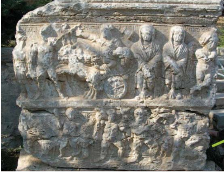
Res. 1 Avşar Ostoteki