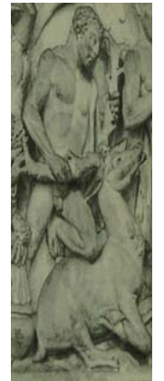
Res. 7 Roma