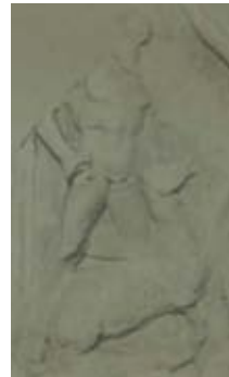
Res. 14 Roma