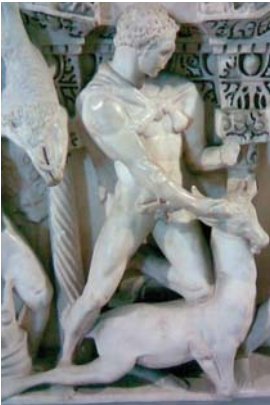
Res. 4 Konya