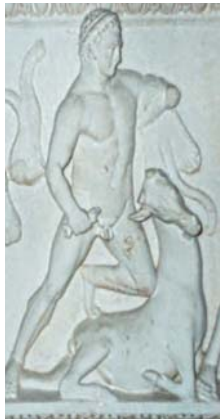
Res. 5 Kayseri