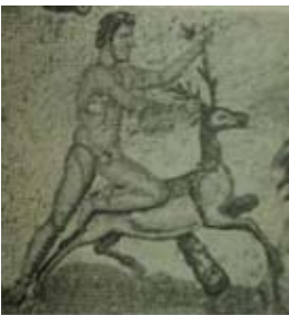
Res. 20 Paros