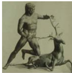
Res. 18 Palermo