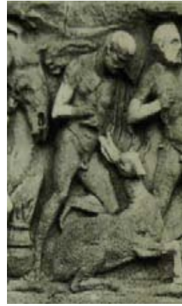
Res. 10 New York