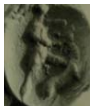
Res. 25 Münih