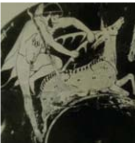
Res. 16 Paris