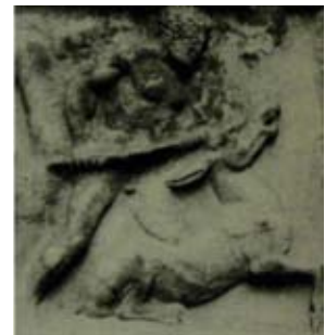
Res. 15 Londra