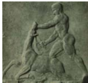
Res. 22 Dresden