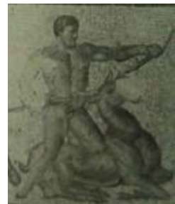
Res. 19 Valence