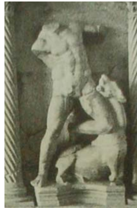
Res. 6 Antalya