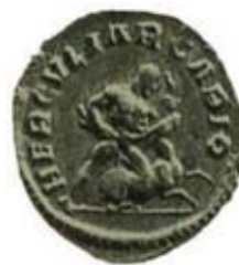
Res. 26 Cologne