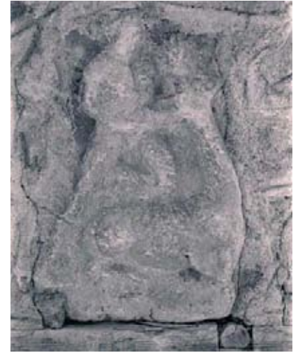
Res. 3 Isaura Nova Mezar Kabartması