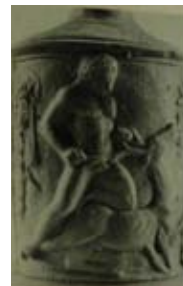
Res. 23 Atina