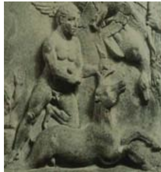
Res. 13 Vatikan