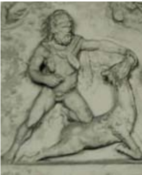
Res. 12 Vatikan