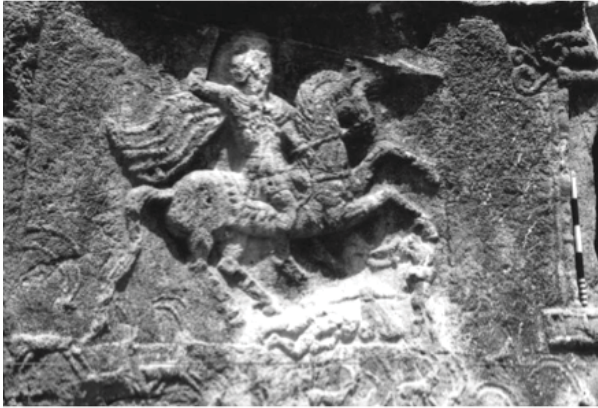
Resim 4: Süvari Betimi

Mezarın cephesi yatay olarak iki alana bölünmüştür. Kayanın süvari sahnesini taşıyan ön tarafı düzleştirilmiştir. Mezar kapısının solunda yer alan ana sahnede 5 , şahlanan atını yerdeki üç çıplak düşmanın üstüne süren muzaffer bir süvari betimlenmiştir (Res. 4). Pelerini arkasında dalgalanan süvari sol eliyle atın dizginlerini kavramış ve kaldırmış olduğu sağ elinde atmak üzere olduğu bir mızrak tutmaktadır. Ayrıca belinde sallanan bir kılıcı da bulunmaktadır.