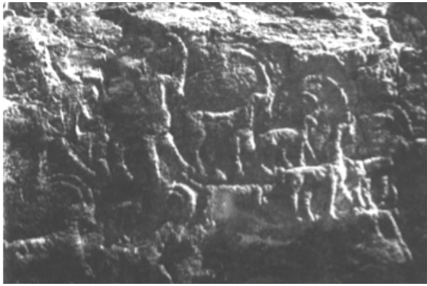
Resim 6: Yaban Keçisi Sürüsü Detayı

Süvari sahnesinin yer aldığı mezarın cephesinde bölgeye has hayvanlardan elli yaban keçisi (ibeks) ve iki av köpeği alçak kabartmayla işlenmiştir (Res. 6).