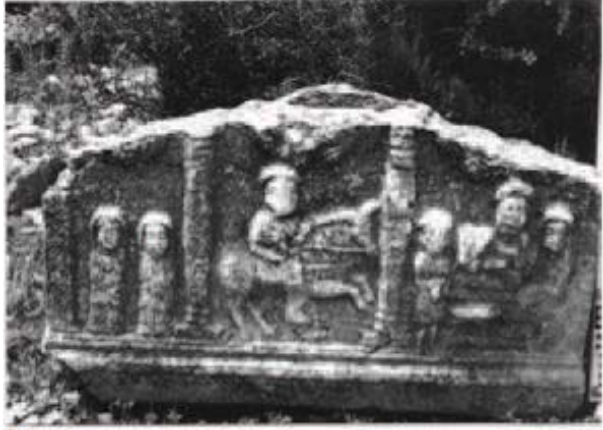
Resim 9: Astra'dan Bir Larnaks Kabartması

Süvari kısa bir tünik ile botlar giyer ve atının püsküllü bir eğer örtüsü vardır. Çok klasik bir işçiliği olan kabartma bölgede bilinen tüm süvari kabartmalarından daha mükemmeldir. Bu parça muhtemelen bir mezar anıtına aittir. Aynı bölgedeki Astra ve Artanada antik kentlerinde, benzer süvari motifi stel ve larnaklarda kullanılmıştır.