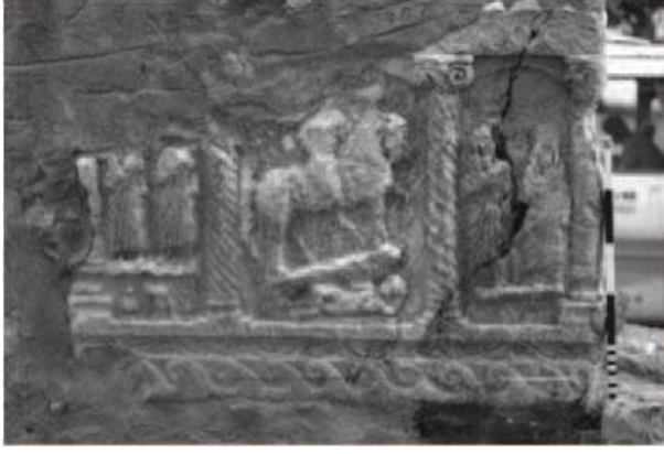
Resim 10: Astra'dan Bir Larnaks Kabartması

İsauria'da, Artanada antik kentinde, bir çeşmede devşirme yapı taşı olarak kullanılmış olan mermer larnaks üzerindeki betimleme diğerlerinden farklıdır. Burada ortadaki sahnede, süvari atının altındaki bir düşmanı ezmektedir (Res. 10). Süvarinin her iki yanında ayakta duran Roma giysileri içinde figürler betimlenmiştir. Süvari figürünün başı ve vücudundaki giysiler tahrip olsa da yenik düşmanın varlığı, ölünün askeri kimliğini açık bir şekilde ortaya koymaktadır. İsauria'dan bu iki larnaks bize Romalı motiflerin yerel mezar anıtlarında kullanıldığını ve bölgedeki geleneklerin ne kadar köklü olduğunu göstermektedir. Roma eyaletlerinde sık rastlanan süvari stellerinin yerini burada larnaks almıştır.