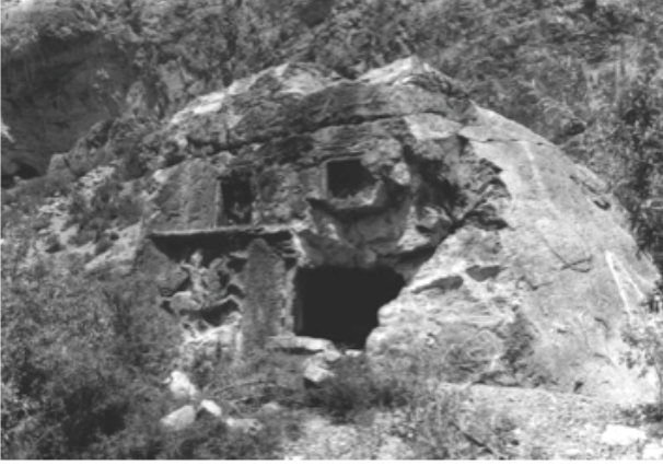
Resim 1: Yelbeyi Kaya Mezarı Güney Ön Cephe