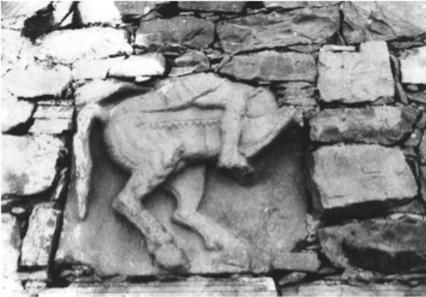
Resim 8: Konya İli Seydişehir İlçesi, Bostandere Kasabasındaki Kabartma

İsauria ve Lykaonia'daki çeşitli mezar kabartmalarında betimlenen süvarilerin sembolizmi Buckler, Calder ve Cox tarafından belirtildiği gibi değişebilir 27 . Süvari motifi İsauria sanatının tipik unsurlarındandır. Bunu temsil eden mükemmel bir kabartma parçasında, Yelbeyi örneğini çok andıran bir süvari, şahlanan atının üzerinde betimlenmiştir. Bu parça, Konya ili, Seydişehir İlçesi Bostandere kasabasında bir evde yapı taşı olarak kullanılmıştır (Res. 8). Süvarinin askeri kimliği giysilerinden ve atın şahlanmış olmasından anlaşılmalıdır.