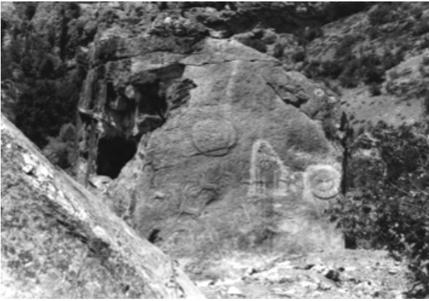
Resim 2: Yelbeyi Kaya Mezarı Doğu Yan Cephe