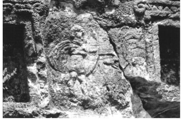
Resim 7: Av Sahnesi Detayı

İsauria ve Lykaonia'daki mezar kabartmalarında rastlanılmaktadır 14 .