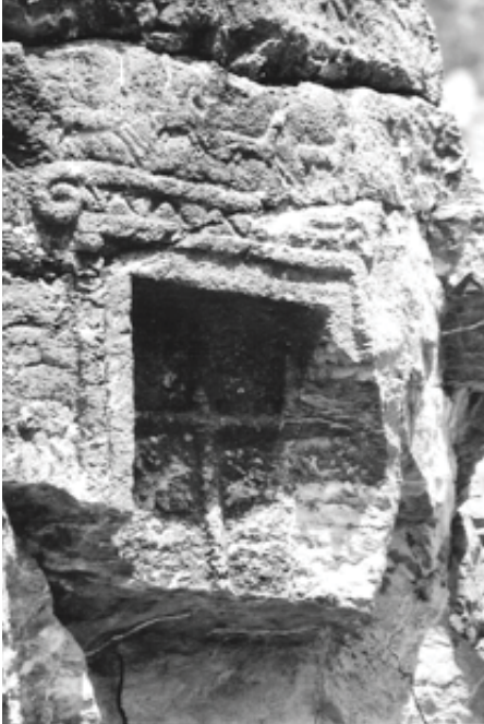
Resim 3: Pencere Detayı

Mevcut durumuna göre kaya mezarın bir ev gibi yapılmış olduğu, mimari detaylardan kolayca anlaşılabilir. Bunu destekleyen en önemli düzenleme mezarın giriş kapısı ve sahte pencerelerden oluşan giriş cephesidir 2 (Res. 3).