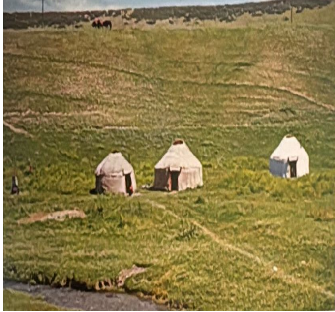
EK 7: Hun, Göktürk, Uygur ve daha geç devirlerin Türk topluluklarında yaygın olarak kullanılan yurt tipi çadırlar (Boz-Üyeler)