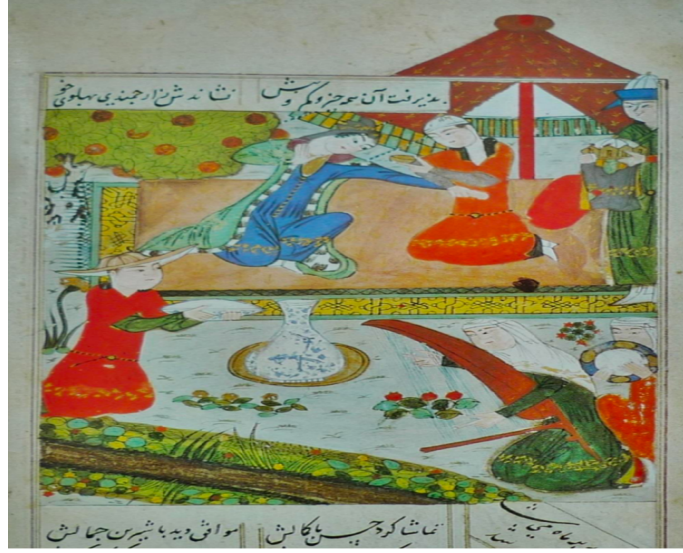
EK 3: Şirin'in taş takma töreni, Emir Hüsrev Dehlevi'nin Hamse'si, Timurlu dönemi, 1446, TSMK, H.898, y. 123b.