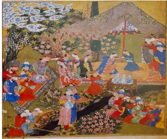
EK 4: Kadınların bulunduğu meclis sahnesi, Firdevsi'nin Şehnamesi, Timurlu dönemi 1444, Cleveland Müzesi, çift sayfalı 45.169 ve 56.10.