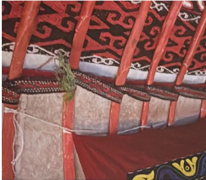
EK 8: Yurt tipi çadırın içinden ayrıntı