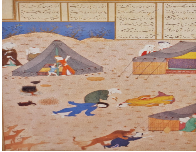
EK 1: Leyla ile Mecnun'un Bayılması, Nizami'nin Hamse'si, Timurlu Dönemi 1445-1446, TSMK, H. 781, Y. 138r