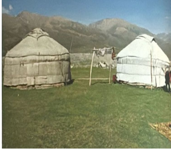
EK 6: Yurt Tipi Çadırlar (Boz Üyeler)