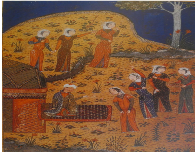
EK 2: Hüsrev ile Şirin'in Kouşması, Emîr Hüsrev'in Hamse'si, Timurlu Dönemi, 1407, TSMK, H. 796, y. 28s.