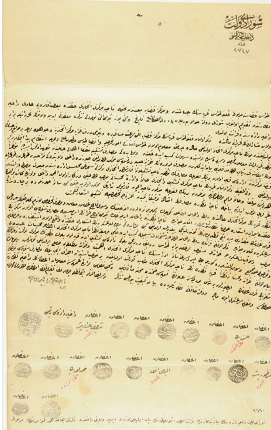
EK8: Kale Tavas'ın Nahiye Merkezi haline gelişine dair 25 Recep 1312 (22 Ocak 1895) tarihli Mazbata (BOA., İ.DH., 1321/1312 L.9, 14 L. 1312).