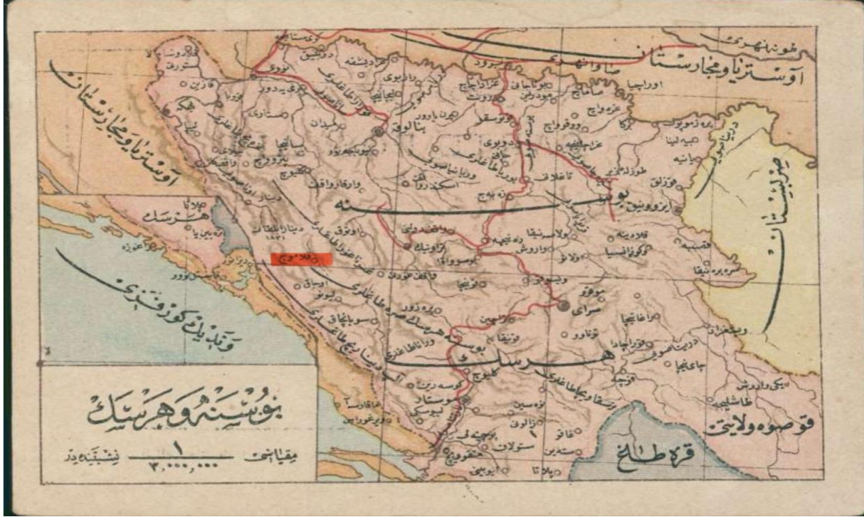
Ek 2: 19. Yüzyıl Bosna Hersek Haritası