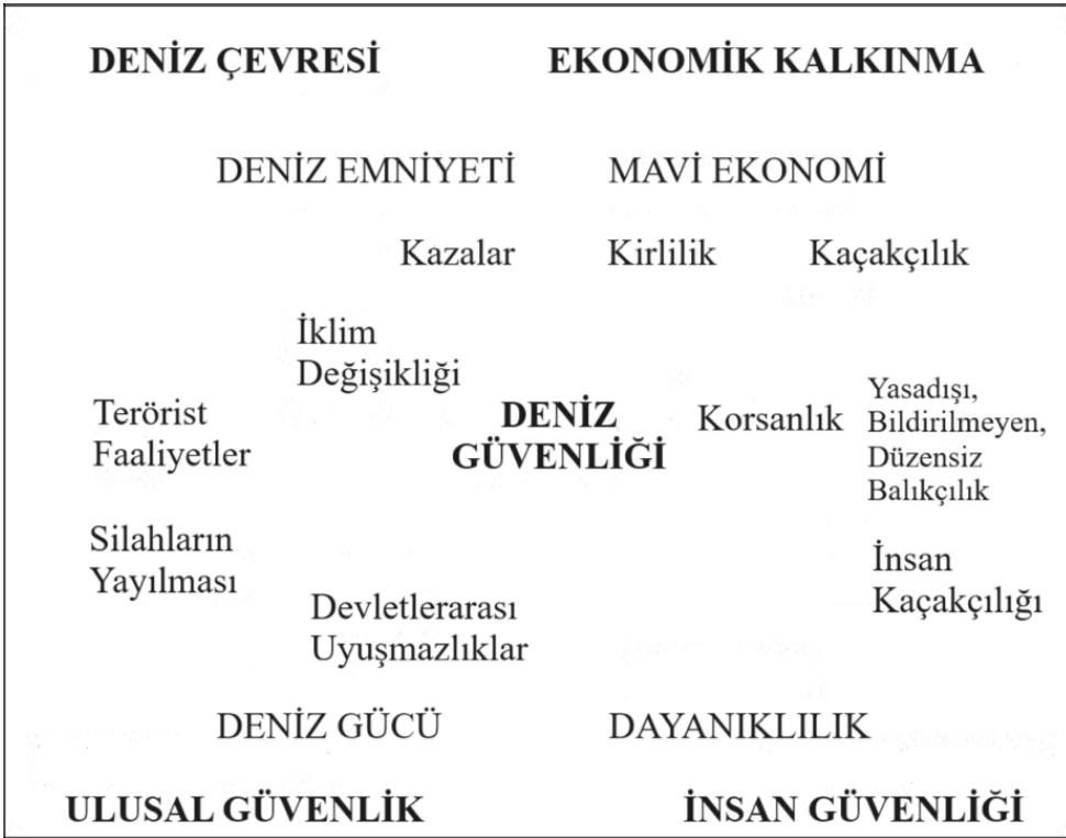
Şekil 1. Deniz Güvenliği Matrisi

Bueger (2015,s. 159), deniz güvenliğine yönelik devletler arası anlaşmazlıklar, terörizm, korsanlık, uyuşturucu, insan ve yasadışı malların kaçakçılığı, silah yayılımı, IUU balıkçılık, çevre suçları, deniz kazaları ve felaketleri gibi tehditleri saymaktadır. Bu kapsamda deniz güvenliğini bu tehditlerin yokluğu olarak tanımlanması gerektiğini dile getirmekte ve hangi tehditlerin deniz güvenliğine dahil edilmesi gerektiğine dair belirsizlik oluştuğunu savunmaktadır. Bueger (2015, s. 161), bir kavramın diğer kelimelerle olan benzerlikleri ya da farklılıkları üzerinden anlam kazandığını belirterek bir deniz güvenliği matrisi geliştirmiştir. Şekil 1'deki matris, farklı aktörlerin deniz güvenliği ile farklı kavramlar arasında nasıl bir ilişki kurduğunun analizini mümkün kılmaktadır. Bu süreçte deniz güvenliği içine hangi kelimeleri ya da kavramları dahil ettiği de görülmektedir. Örneğin, deniz güvenliğinin merkezde olduğu matriste bazı devletler ekonomik bazı devletler ise güvenlik kaygısıyla hareket etmektedir.