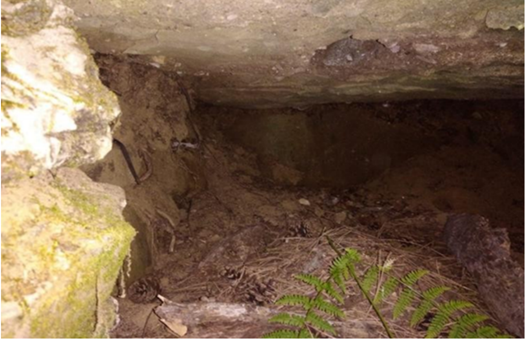
(fig. 10) Topbaşlar mevkiinde mezar