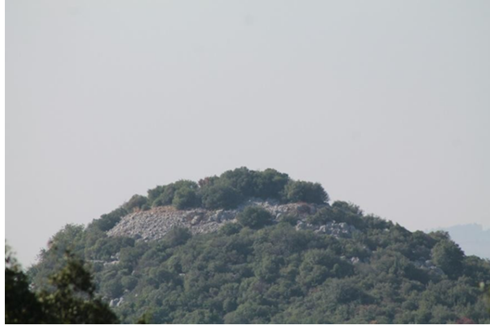
(fig.5) Büyükesik mezarındaki yerleşim alanı