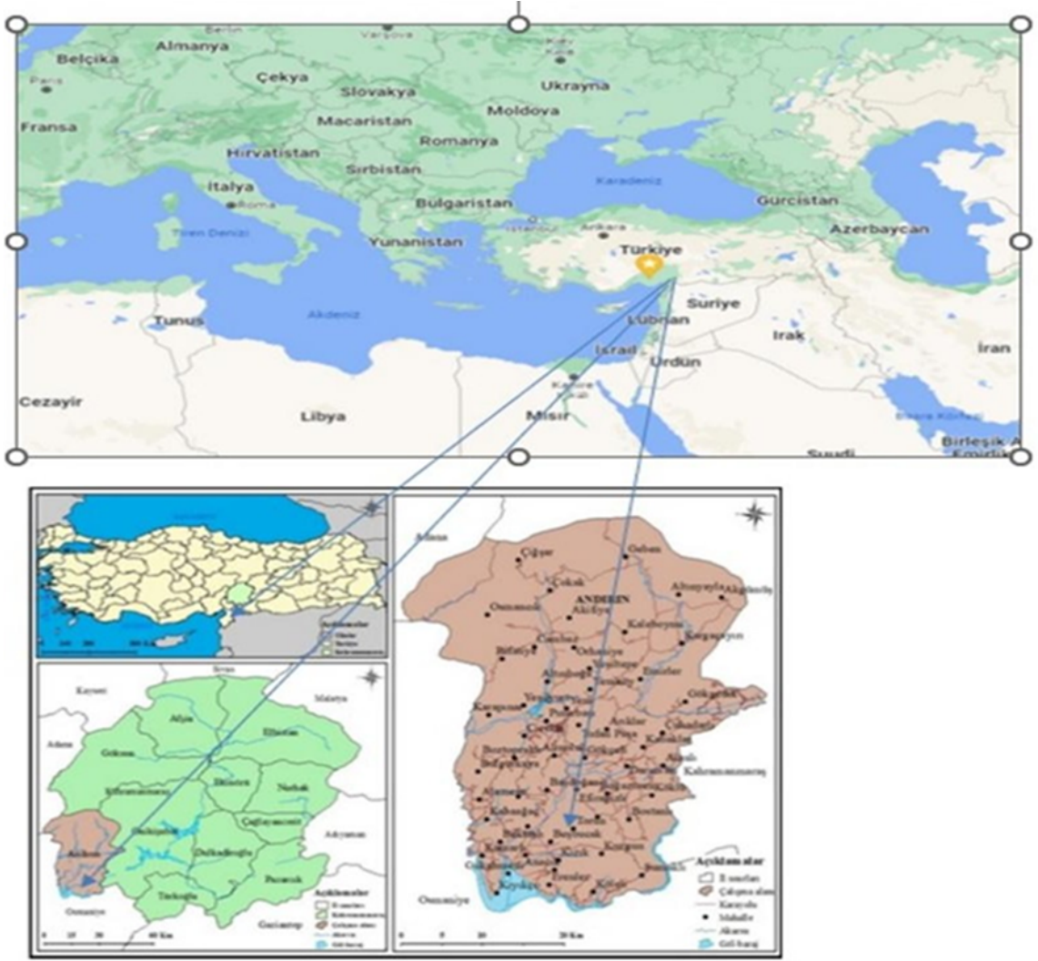
(fig. 2) Andırın Başdoğan Mahallesi'nin dünyadaki yeri