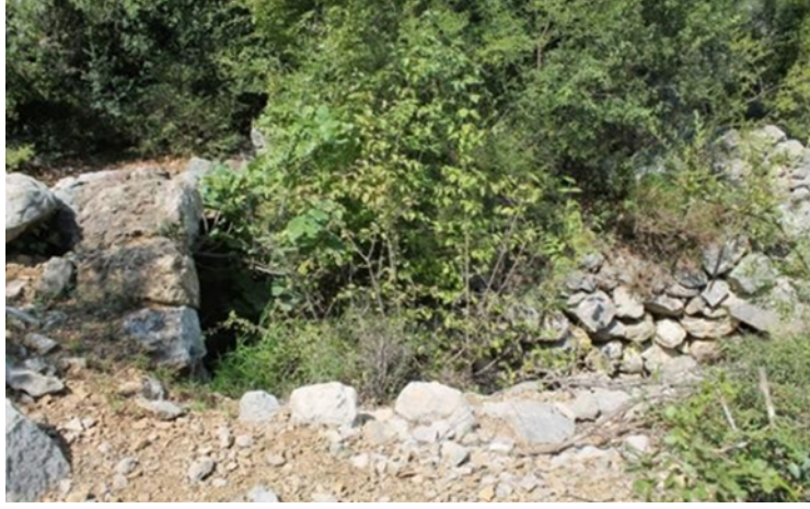
(fig. 8) Metmen Hopuru'nun nekropollerindeki kaçak kazılar