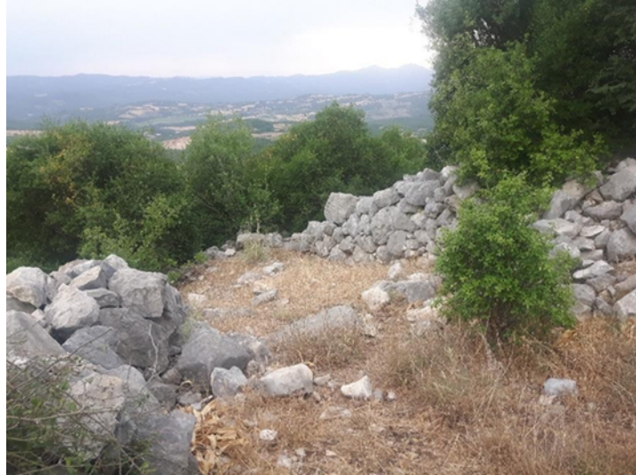
(fig. 6) Kalecik Kalesi'nde duvar kalıntısı