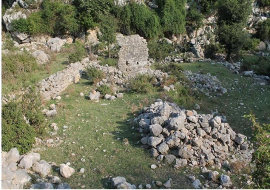
(fig. 9) Metmen Hopuru'ndaki kalıntılar