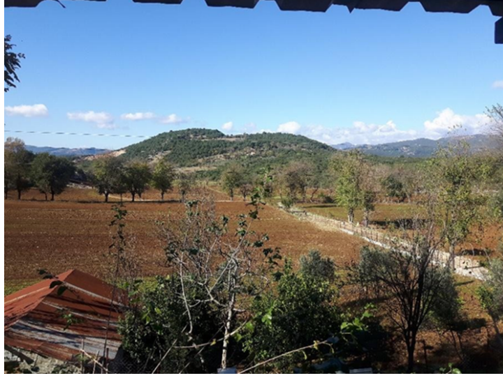
(fig.4) Metmen Hopuru'nun bulunduğu höyük