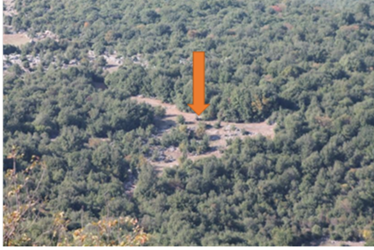
fig. 7) Kalecik Kalesi'ndeki kalıntıların yeri