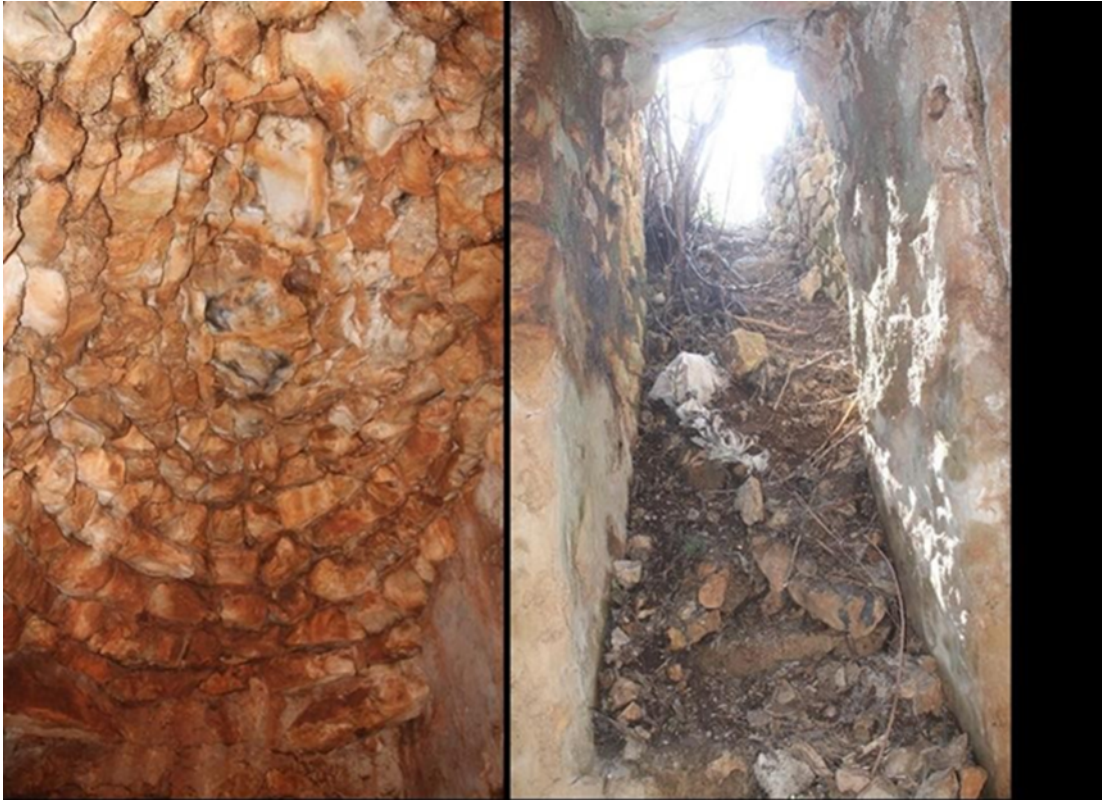
(fig. 11) Topbaşlar mevkiinde mezar girişı ve tavanı