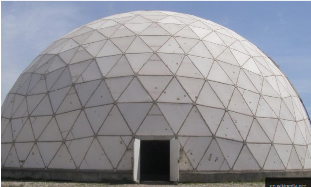
Resim 5: Merâge şehrine sembolik olarak dikilen rasathâne kubbesi. ( http://www.republika.co.id/berita/dunia-islam/islam-digest/16.11.10/ogf63n313-ilmu-pengetahuan-di-era-dinasti-timurid-tumbuh-pesat ).