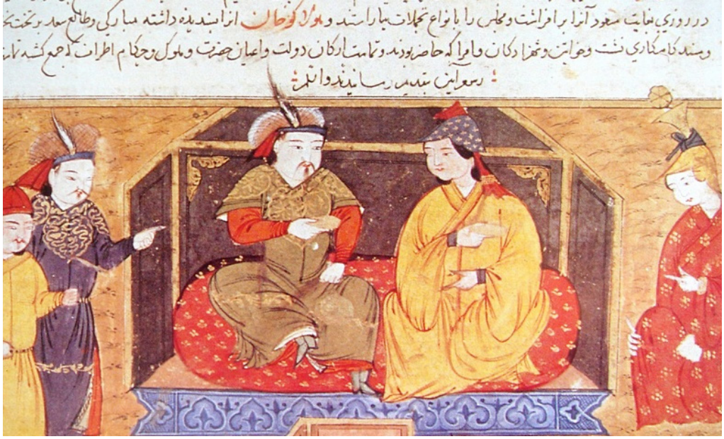
Resim 1: Hülâgû Hân ve Dokûz Hâtûn. ( http://www.turktoresesi.com/view-topic.php?f=19&t=1063 ).