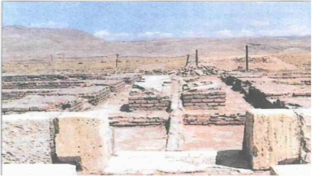
Resim 3: Arkeolojik kazılarda ortaya çıkan Merâge Rasathânesi'nin kalıntıları. (Özgüdenli 2004: 162).