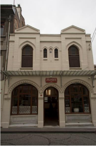
Şekil 5. Vefa Bozacısının 1900'lü yıllarda Milli Mimarlık Üslubunda Yapılmış ve Günümüzde de Halen Vefa Bozacısının Tek Şubesi Olan ve İstanbul Vefa'da bulunan Perakende Boza Satış Birimi.

(Kaynak: https://tr.wikipedia.org/wiki/Vefa_Bozac%C4%B1s%C4%B1 ).