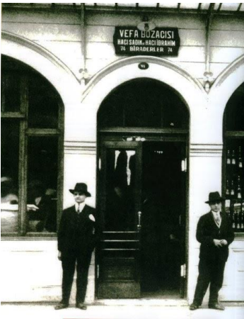
Şekil 3: 1930'lu yıllar Vefa Bozacısı.

(Kaynak: https://www.erolkara.net/2019/01/vefadan-bozaaaaaaaaaaaaa.html ).