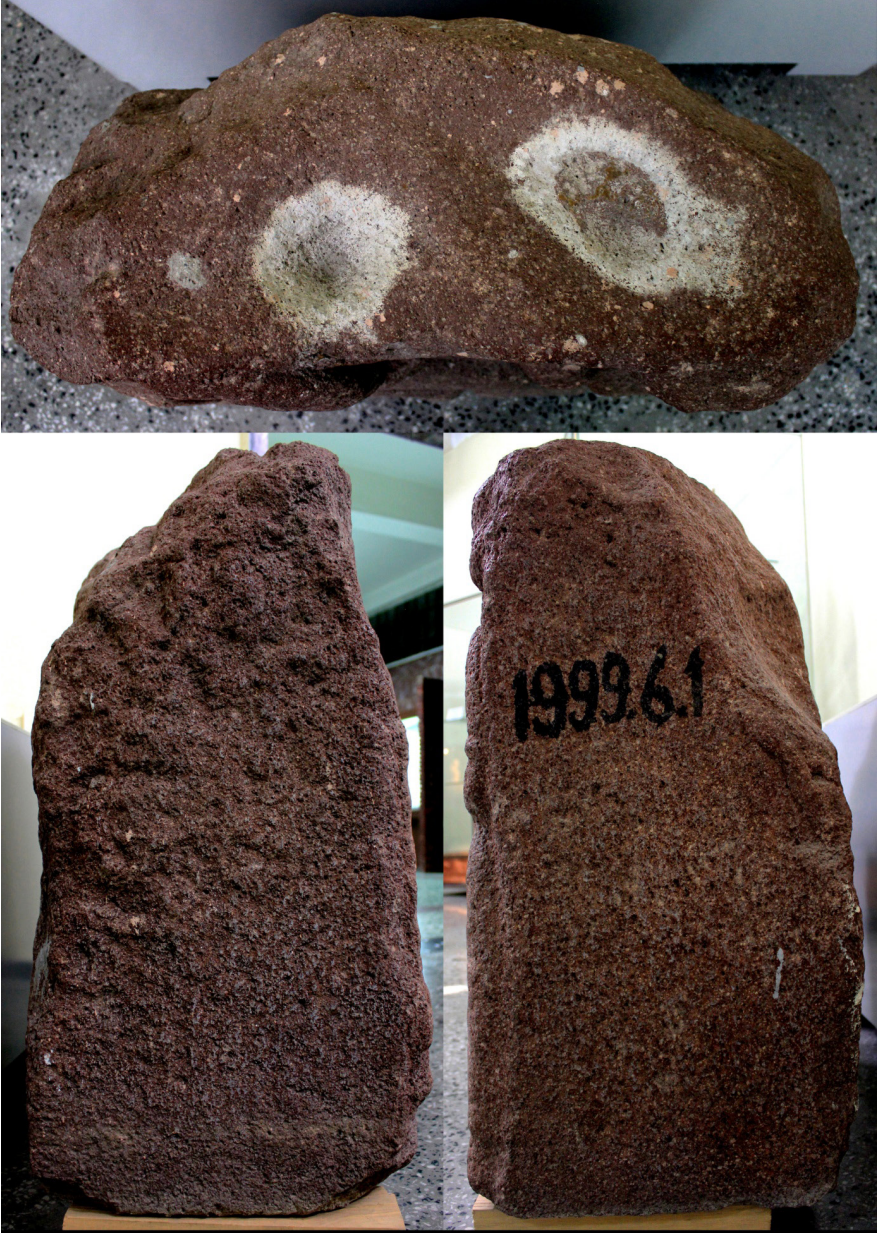
Levha 2: İnsuyu Geç Hitit Steli. Üstten ve Yandan Görünüm.