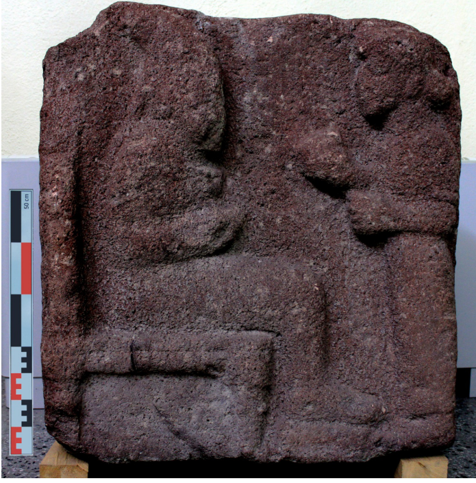
Levha 1a: İnsuyu Geç Hitit Steli.