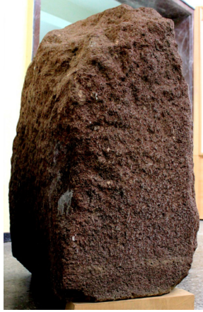
Levha 1b: İnsuyu Geç Hitit Steli. Arkadan Görünüm.